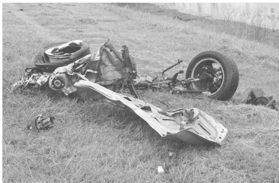
El fuerte impacto hizo que quedaran partes de ambos vehículos por todos lados.