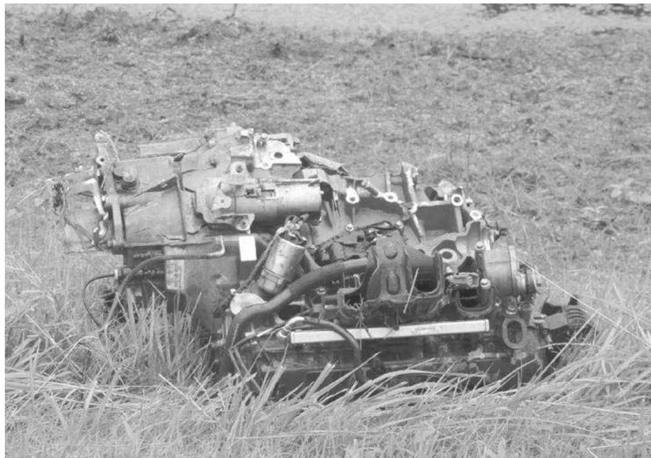
El motor del Ford Focus quedó en la banquina a varios metros del automóvil.

Como consecuencia de un impacto frontal de dos vehículos falleció un matrimonio de Castelar y dos de sus hijos menores de edad - Un tercer niño se encuentra en grave estado, al igual que los ocupantes del restante vehículo, oriundos de Chivilcoy.