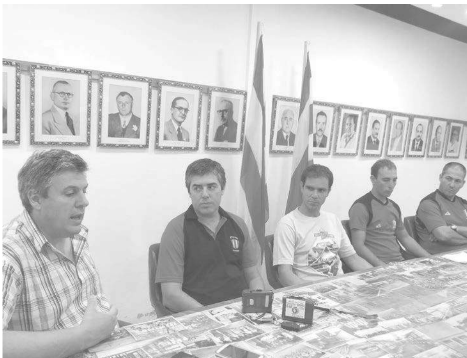
EL Club Atlético 9 de Julio presentó a la dirigencia del fútbol para la próxima temporada.

Como nuestro medio lo anticipara, en la tarde del jueves, el Club Atlético 9 de Julio desarrolló en su sede una conferencia de prensa en la que procedió a presentar el cuerpo técnico designado para una nueva temporada del fútbol de la Liga Nuevejuliense.