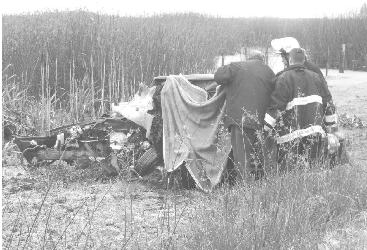
Personal de Bomberos trabaja en el auto que viajaban los fallecidos.