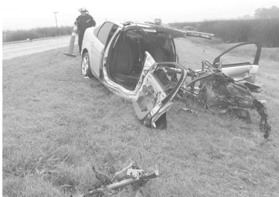
Estado en que quedó el Focus con sus dos ocupantes vivos.

Ante el llamado de alerta registrado en el