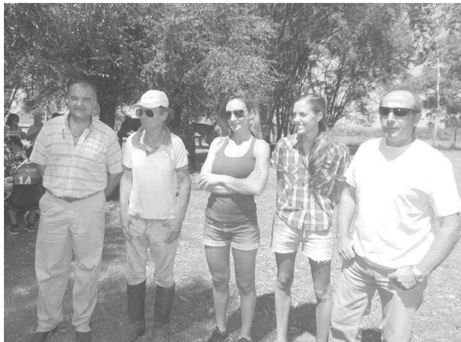
Directivos y colaboradores dieron detalles a la prensa.