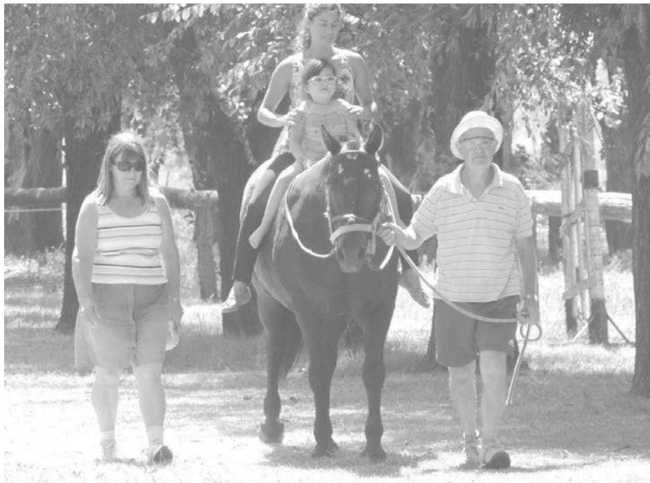
La actividad de Equinoterapia vuelve a funcionar nuevamente en el Club.

También retomó su actividad la Escuela de Equinoterapia.