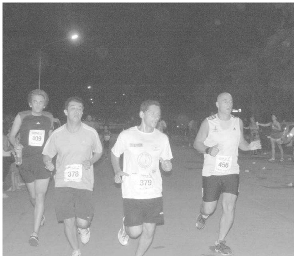
Maratonistas locales en plena competencia el día sábado.