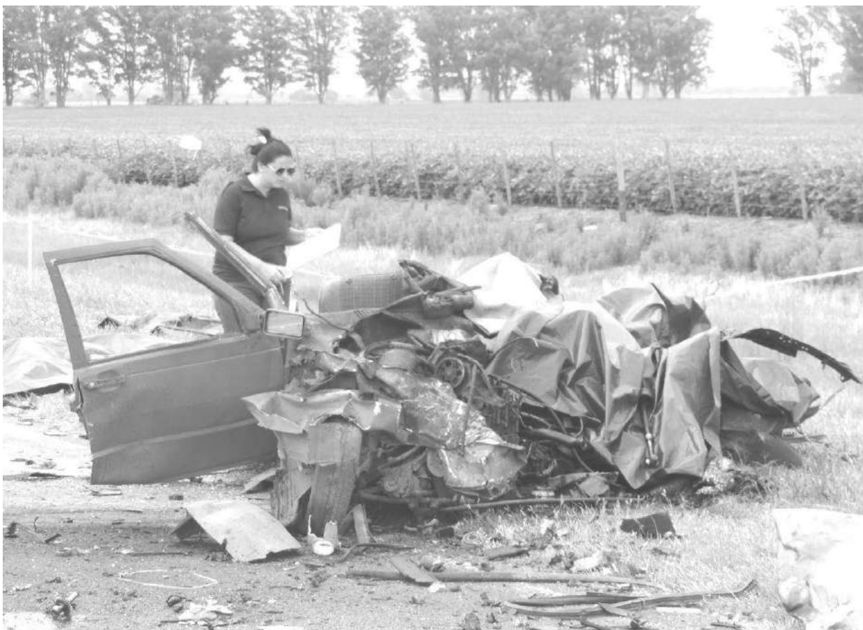
Policia Científica trabaja en el irreconocible automóvil protagonista del accidente.