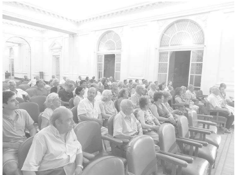
Asistentes a la presentación de "Con luz de farol" en el Salón Blanco.

Como se anticipara, en la noche del día viernes, en el Salón Blanco del Palacio Municipal de nuestra ciudad, se desarrolló la presentación del libro de autoría de Julio Guerriere, denominado "Con luz de farol",