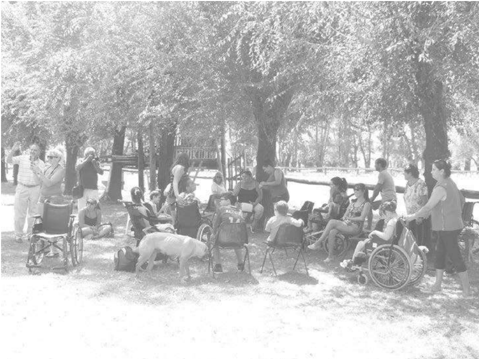
Familiares de personas con capacidades diferentes en el predio del Campo Hípico.

de recuperar el convenio que permitía que la Escuela de Equinoterapia trabaje con los alumnos del Taller Protegido y la Escuela de Educación Especial Nro. 501, así como en la necesidad de hallar alternativas para el traslado de los alumnos, ya que un remis hasta el predio tiene un valor de $ 50 por viaje.