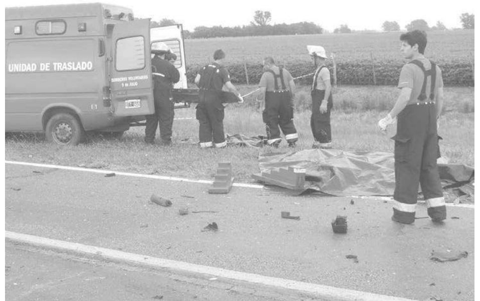
Personal de Bomberos realizan el traslado de las tres personas fallecidas.

Pocos minutos antes de las 10,00 hs. de la víspera, la Estación de Policía Comunal de 9 de Julio y los Bomberos Voluntarios de nuestra ciudad, recibieron un llamado de alerta informando acerca de un accidente grave, registrado en el km. 258 de la Ruta Nacional Nro. 5.