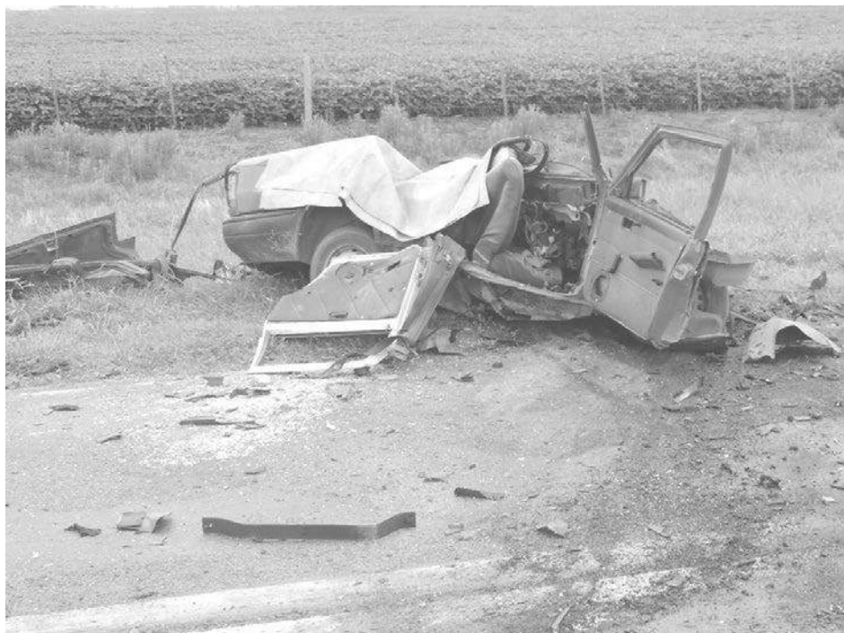
Unidad Duna en la que perdieron la vida los tres nuevejulienses.

PARA 3 Y 5 PERSONAS CON COCHERAS Y VISTA A LA PLAYA, TOTALMENTE EQUIPADOS MARZO 40% DE DESCUENTO - RESERVAS AL 2317-15-528536