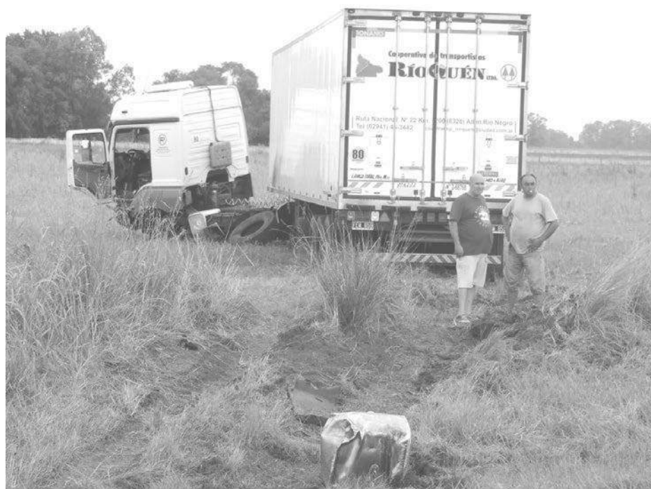
El camión terminó dentro de un campo lindero a la ruta.