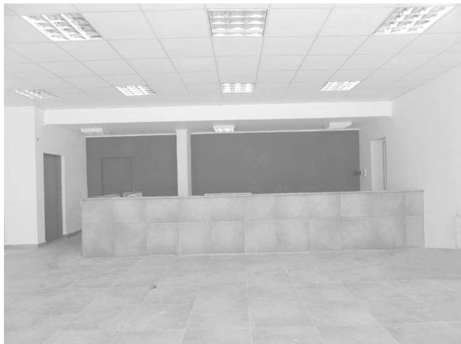
Vista del nuevo local de cobranza donde próximamente se atenderá al público.