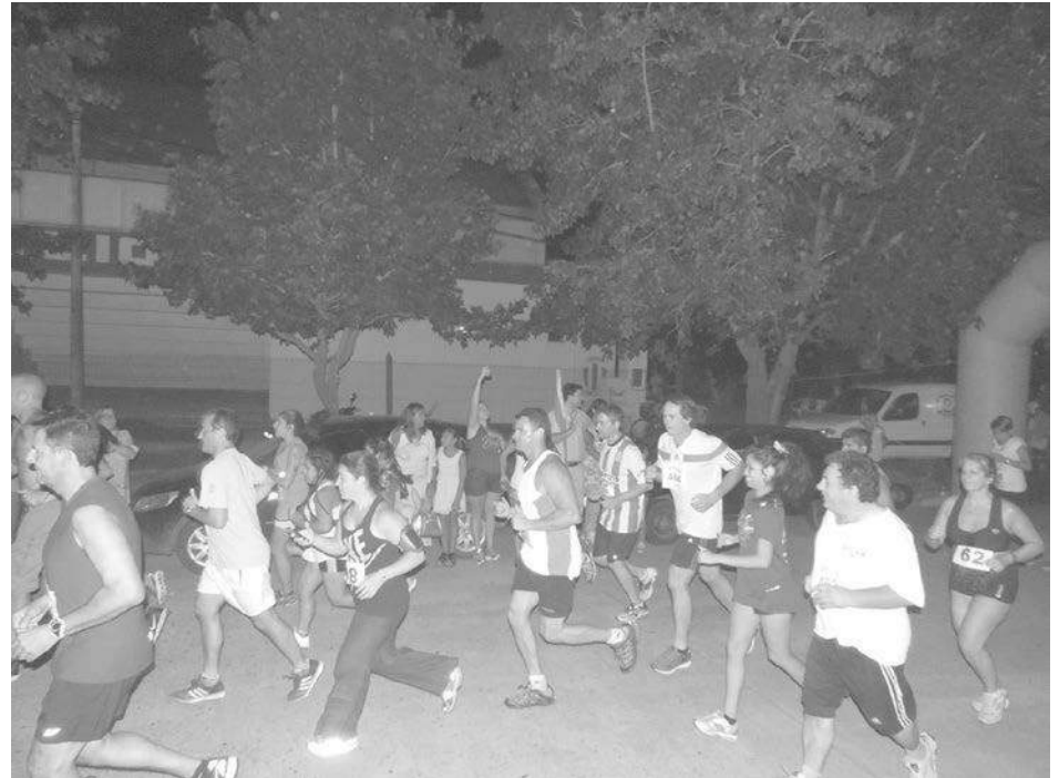
El maratón nocturno de Atlético 9 de Julio congregó a más de mil atletas.