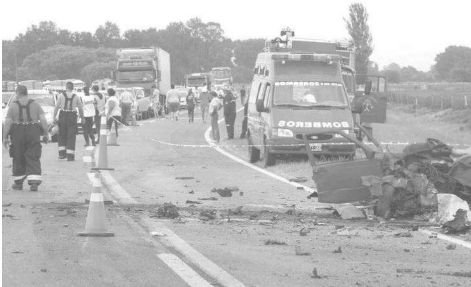
Debido al accidente la Ruta 5 permaneció cortada por un prolongado lapso de tiempo.

Un Fiat Duna en el que viajaban dos personas jóvenes y un menor de edad colisionó frontalmente con un camión cargado de frutas.