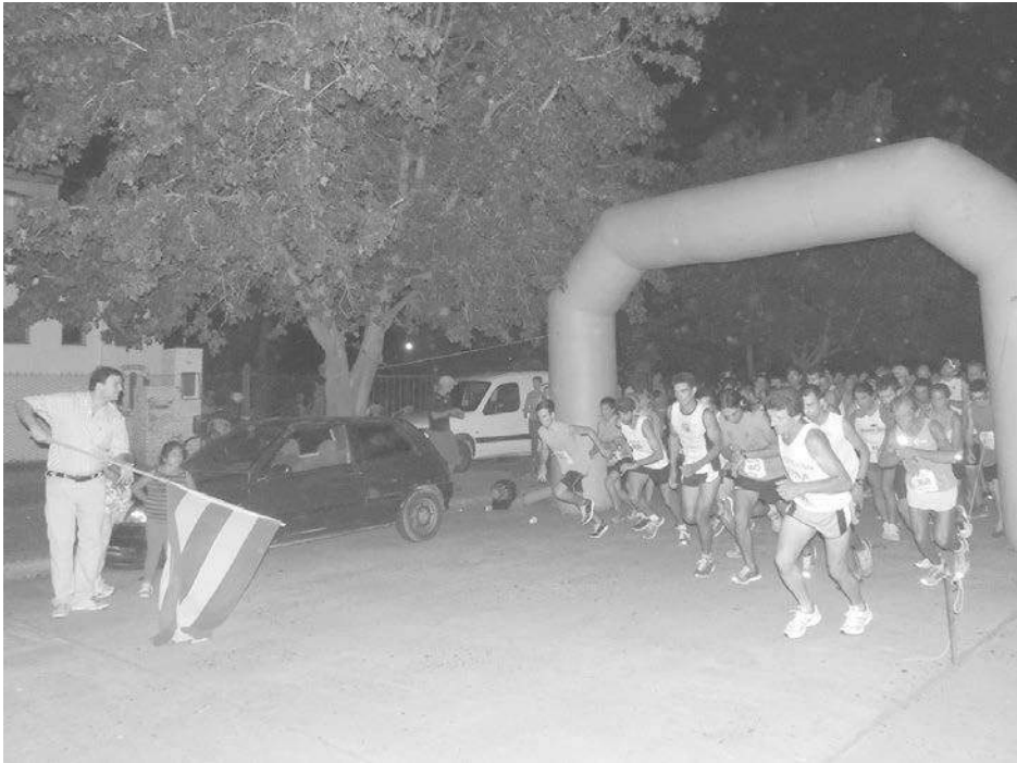
El Intendente realiza el banderazo del inicio de la carrera.