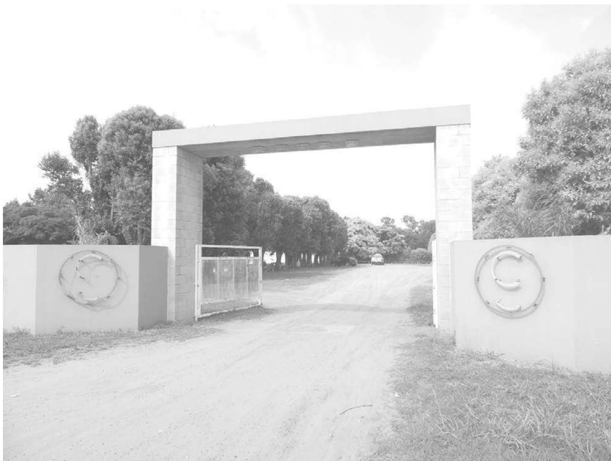
Entrada del predio de CEC donde se produjo un robo en el sector de la cantina.

El presidente de la institución, confirmó que "amigos de lo ajeno ingresaron a la cantina y robaron la mercadería, hicieron destrozos y dejaron las heladeras abiertas". Inf. en Pág. 2