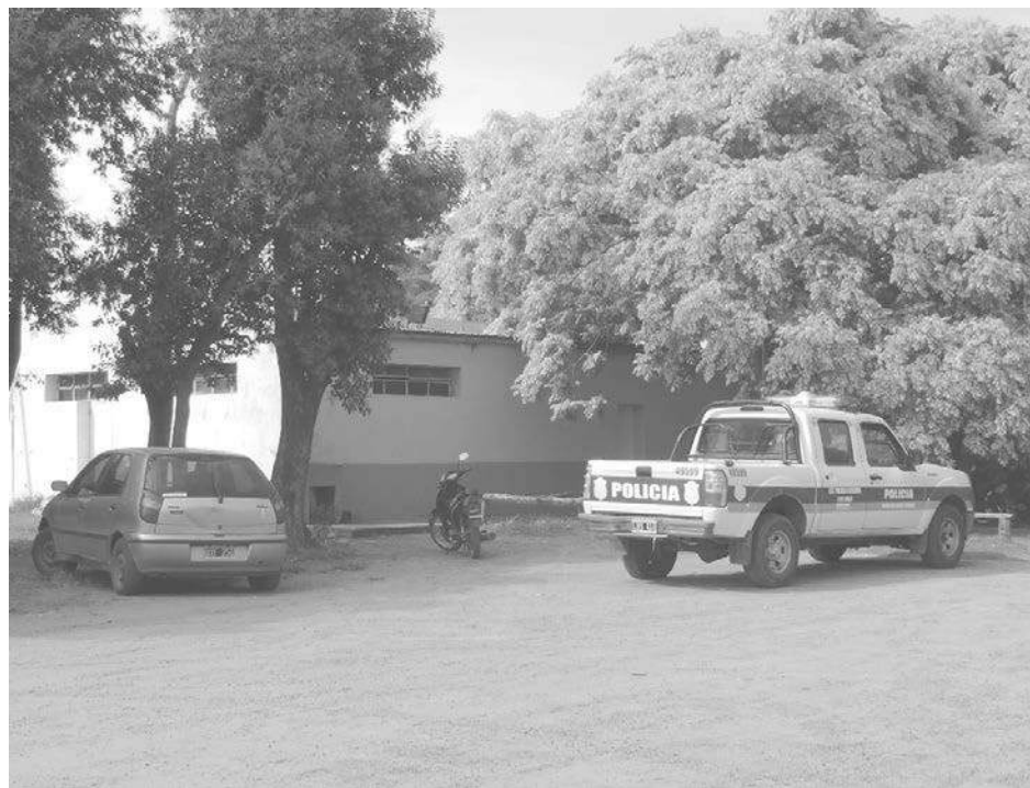
Los malvivientes rompieron una ventana y una puerta para ingresar.