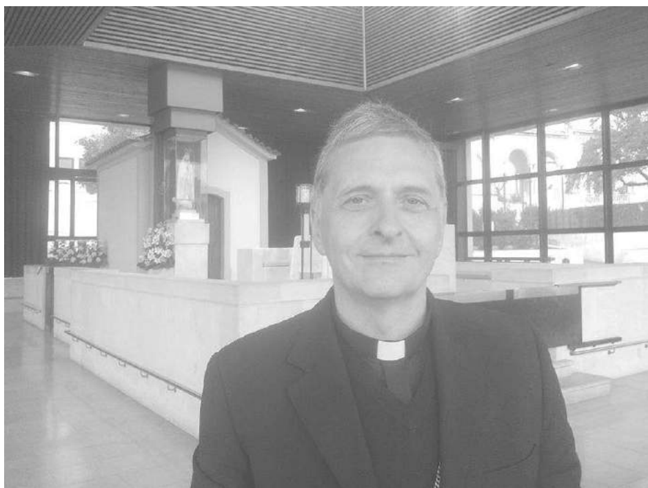
El Obispo de 9 de Julio en el Santuario de la Virgen de Fátima en Portugal.