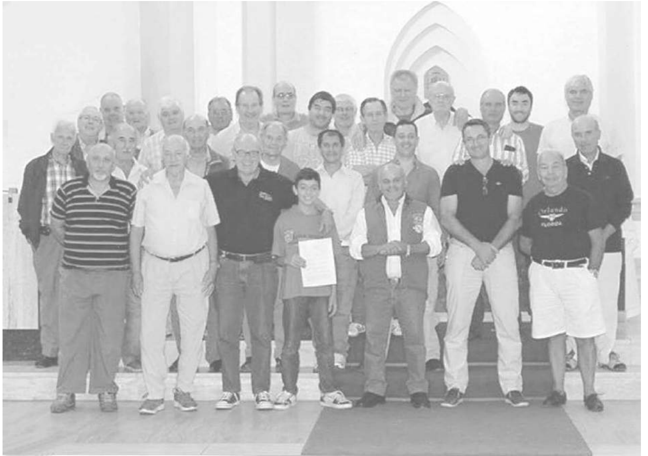
Integrantes del grupo Madrugadores del 9 en el altar de Catedral.

Un grupo de integrantes del movimiento religioso Los Madrugadores del 9 se encuentran recorriendo la zona de Villa Diamantina, visitando hogares de la zona e invitando a hombres, con motivo de rezar el Santo Rosario el próximo sábado 23 de enero. La finalidad es llegar a for-