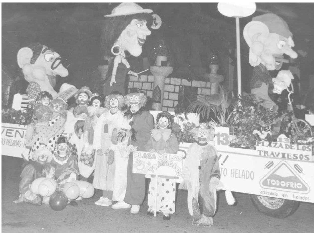
La comunidad de French se prepara para vivir los Corsos en el mes de febrero.

Se llevarán a cabo los 4 fines de semana de febrero con la presencia de destacadas atracciones. Inf. en Pág. 7