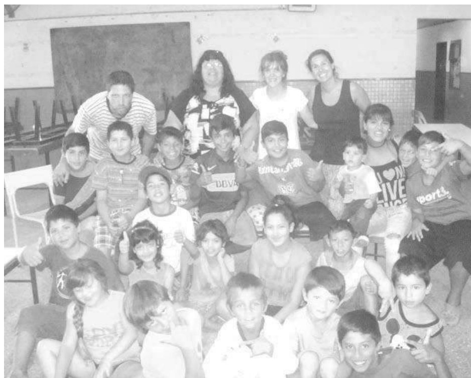
Grupo de alumnos junto a autoridades docentes y municipales.