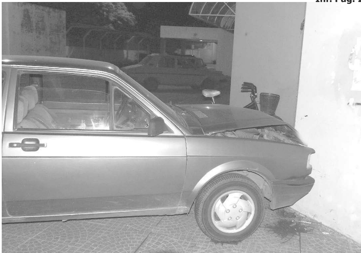
Luego del choque con la moto, el VW Gol impactó contra la pared de la Terminal.