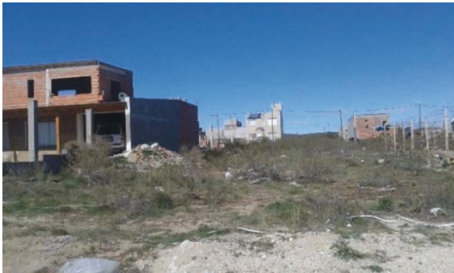
La toma de la tierra está en la Justicia tras la demanda de San Miguel.

Los precios iban de 20 mil hasta 70 mil pesos. La firma San Miguel, dueña de las tierras tomadas, ubicadas al suroeste de la calle Península Valdés, realizó un operativo preventivo para retirar a las casillas que se habían instalado en la zona. El objetivo es regularizar la situación.