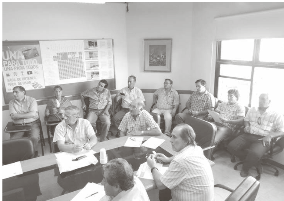
La primera reunión del año se realizó en nuestra ciudad.

Malondra comenzó con un breve repaso, en el que recordó que ocho coopera-