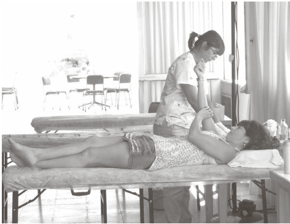
Personal del servicio de Hemoterapia llevó adelante la colecta.