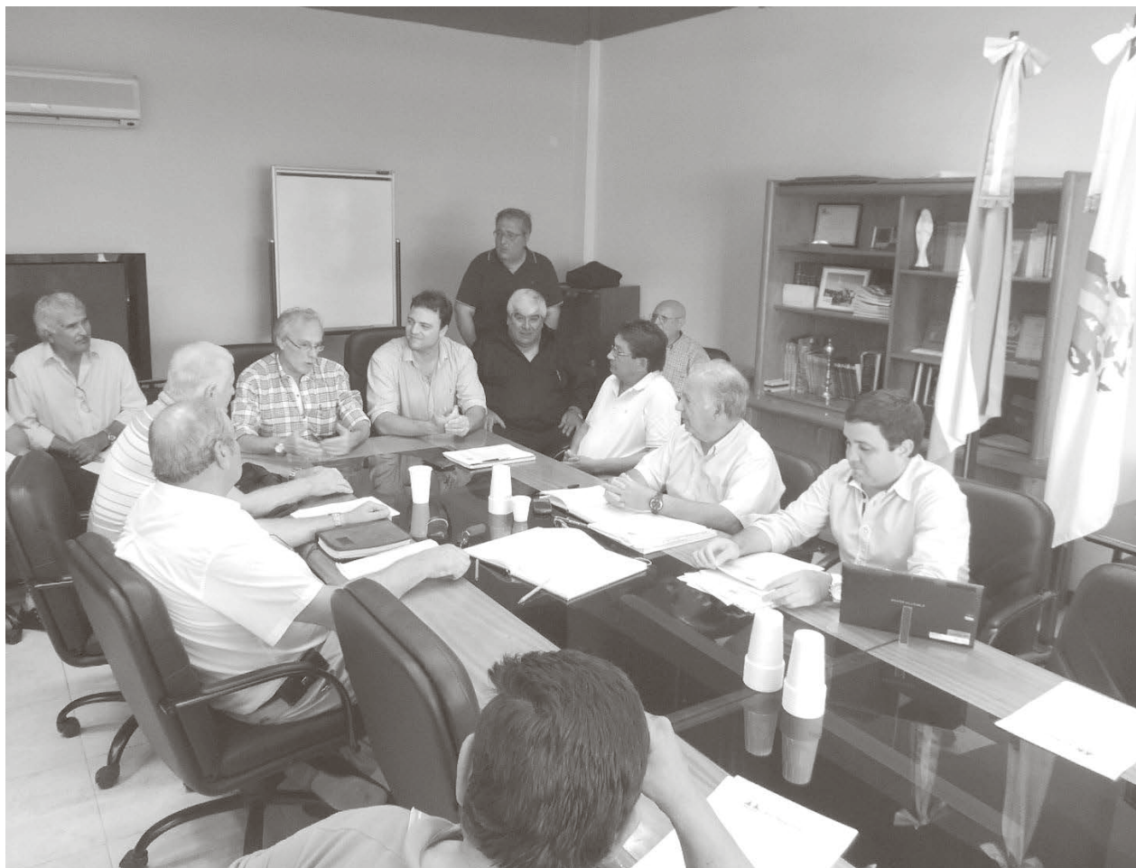
El presidente de la CEyS dio la bienvenida a los presentes acompañado del intendente Barroso.

En la tarde noche del pasado miércoles, se llevó a cabo en la sede de la CEyS Mariano Moreno la primera reunión correspondiente a este año de la Cooperativa de Cooperativas "La Regional Ltda." con asiento en la ciudad de Chacabuco. Inf. Pag. 2