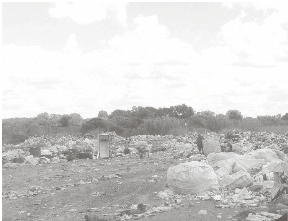
El basural a cielo abierto, un tema que realmente preocupa a todos.