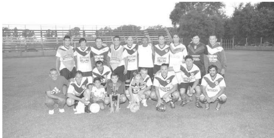
Equipo de El Fortín.