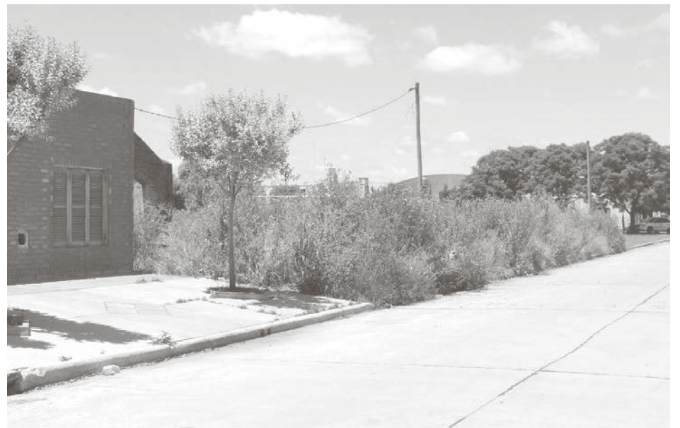
En la imagen, una vivienda lindera al pastizal.