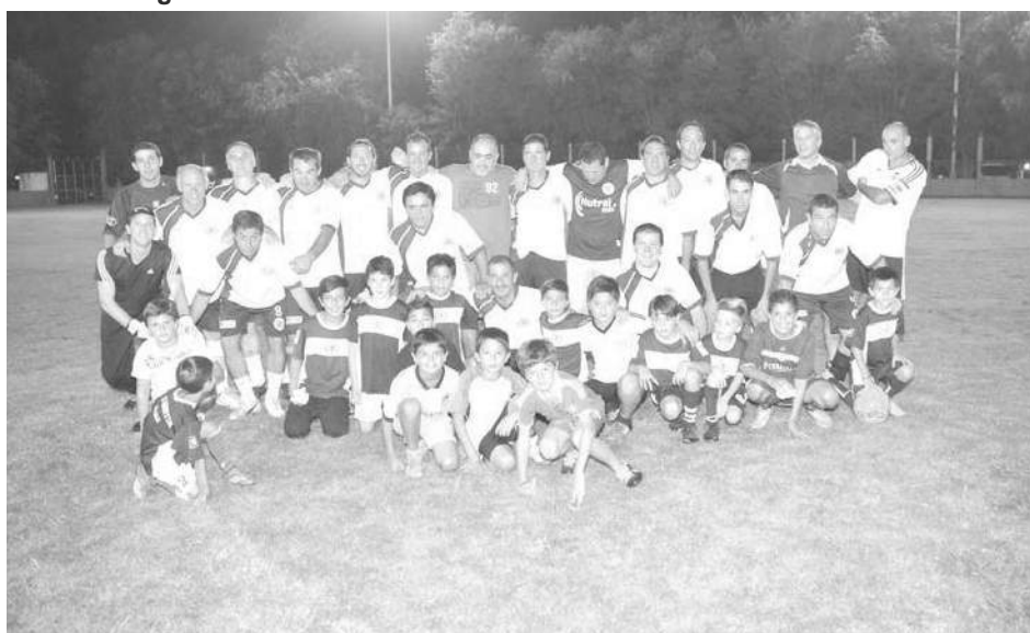
Equipo de Deportivo San Agustín.