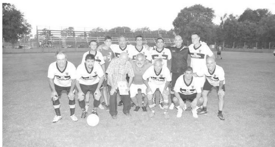
Conjunto de Libertad.