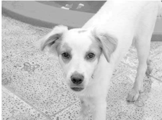
Por zona de Avellaneda (2630) entre Alberdi y J. V. González. Si la viste comunicate al 02317 15 509924.