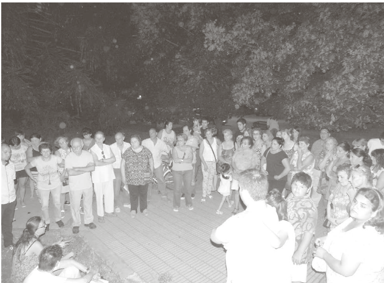
Vecinos autoconvocados piden mejor atención y compromiso de las autoridades.