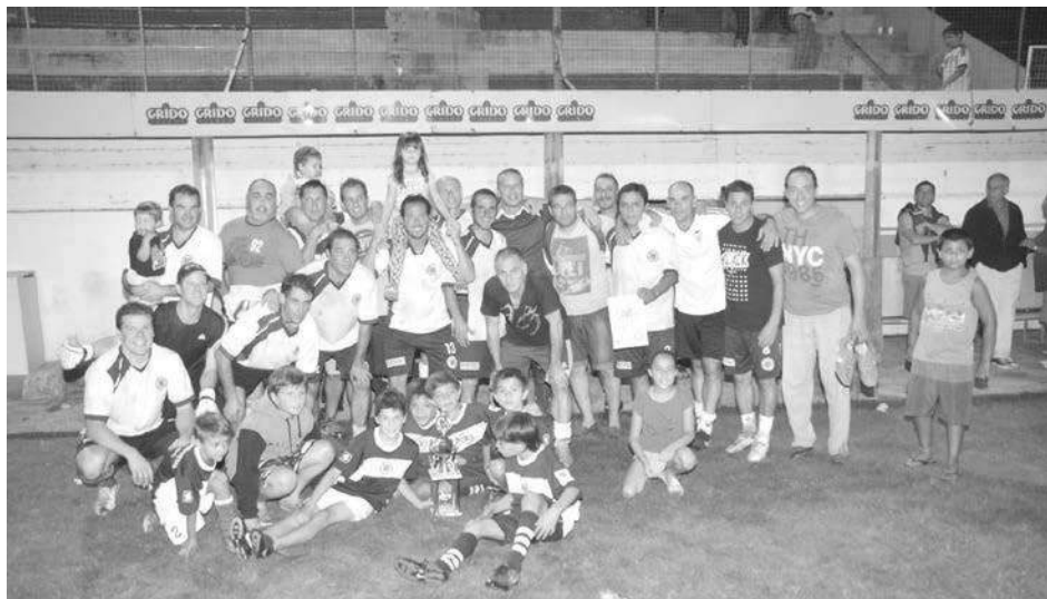
Festejo de Deportivo San Agustín.