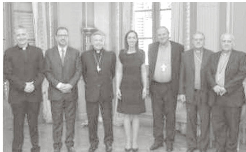
La gobernadora con nuestro Obispo y demás obispos de la provincia de Buenos Aires.

"Se han tratado problemáticas sociales, de vivienda, de pobreza, del trabajo, y hemos podido tener in intercambio interesante. La Lic. Vidal ha admitido la visión de la Iglesia, que por su estructura tiene presencia en cada lugar de la provincia, incluyendo el conurbano, le interesa mucho escuchar la voz de la Iglesia por tener un contacto directo con las problemáticas y esto ayuda a responder a las inquietudes más urgentes. Ella ha presentado algunas propuestas concretas en lo social y ha recibido nuestra voluntad para continuar el diálogo. La reunión ha sido cordial y fructuosa", sintetizó y aclaró "nosotros como Iglesia tenemos una responsabilidad pastoral, no política".