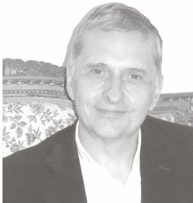
Obispo Ariel Torrado Mosconi.

Calificó el encuentro como "cordial y fructuoso". Destacó la predisposición de la mandataria para combatir el narcotráfico. Diferenció la responsabilidad de la Iglesia y la del estado.