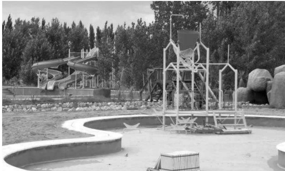
El Patagonia Splash está ubicado sobre la Ruta 22 a la altura del kilómetro 1248.