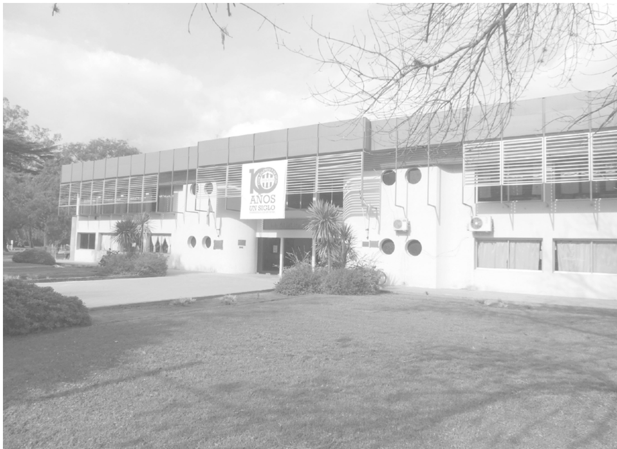
Autoridades del club denunciaron los hechos vandálicos sufridos del fin de semana.