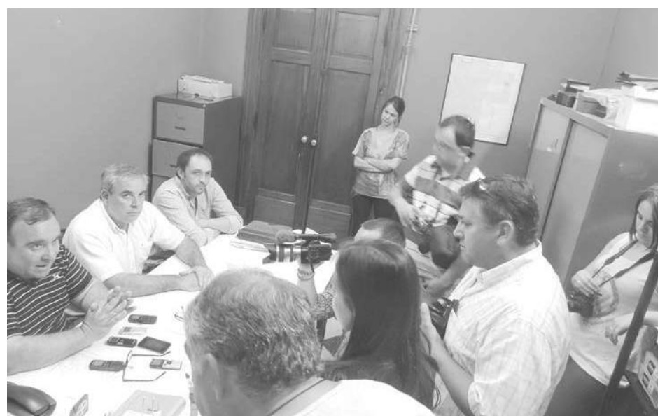
En conferencia de prensa los funcionarios se refirieron a los operativos.