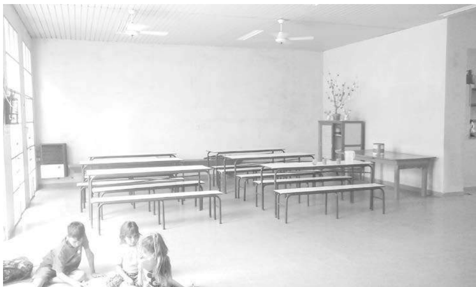
Sector de galería que se refaccionan.

A través de una campaña coordinada por la Comisión de Asociados del Banco Credicoop y el aporte de empresas y vecinos, se logró dar inicio a los trabajos de retechado de la sede.