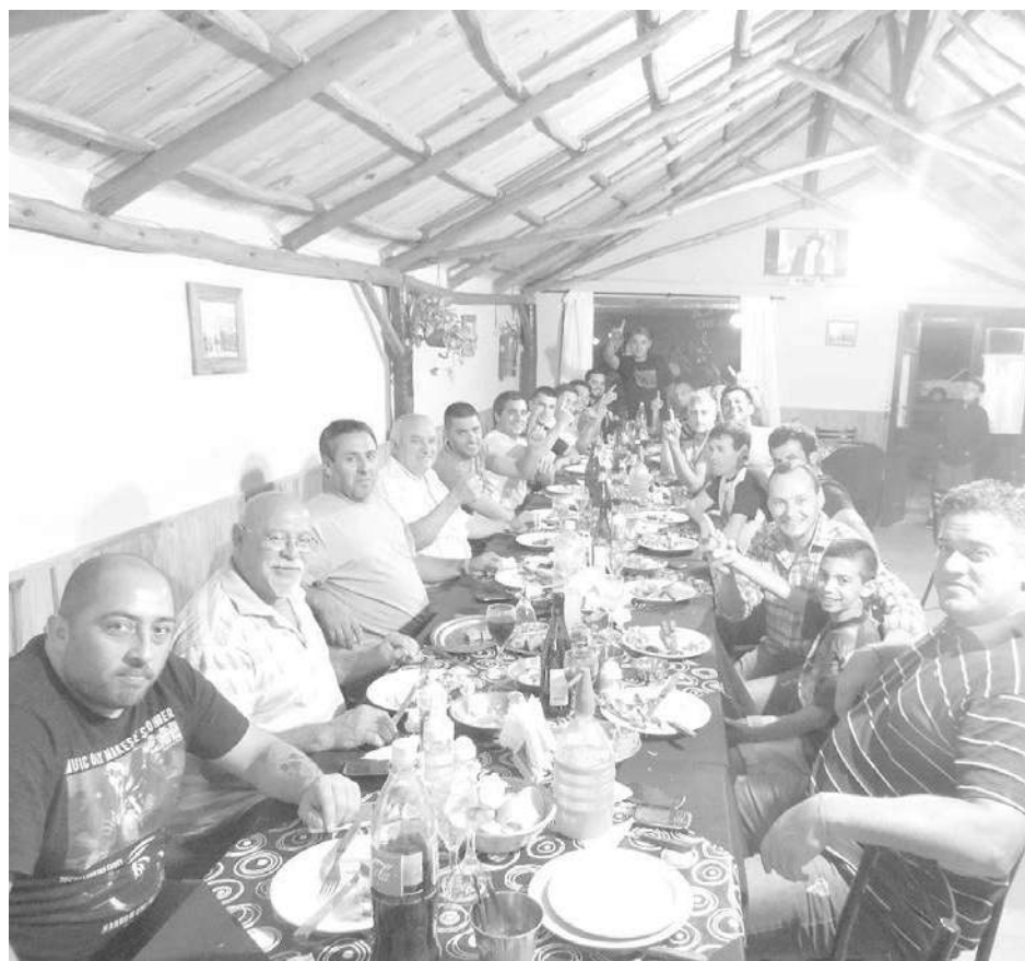
El festejo de campeonato realizado en "Parrilla El Hueso".