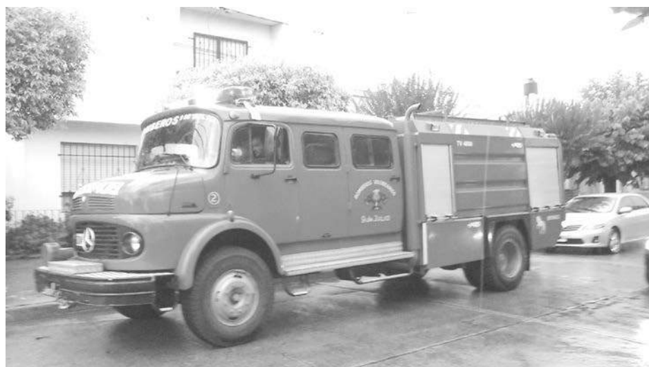
Personal de Bomberos tuvo varias salidas de emergencias.

árbol cayó sobre la cinta asfáltica. Estas situaciones determinaron el trabajo de los Bomberos Voluntarios de 9 de Julio, que además de esta situación registrada en la carretera provincial, debieron acudir a un domicilio de la calle San Juan al 1100, donde una vivienda sufrió anegamientos al verse tapada la rejilla de desagües.