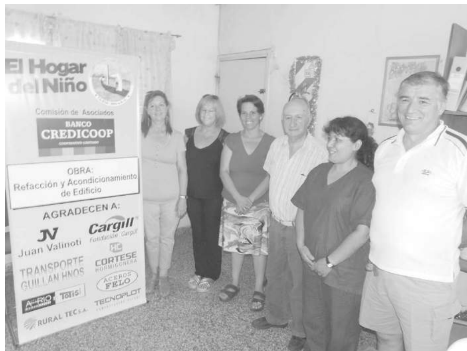
Integrantes de El Hogar juntos a la Comisión de Banco Credicoop.

tegrantes de la Comisión Directiva de El Hogar del Niño indicaron que desde la Fundación Cargill se recibió recientemente una importante donación de $ 27.000 para efectuar la obra, por lo que agradeció este gesto y el de las empresas que hicieron su aporte a través del Banco Credicoop, algunas de ellas en forma anónima. "Esta es una actividad más de las que nuestra institu-