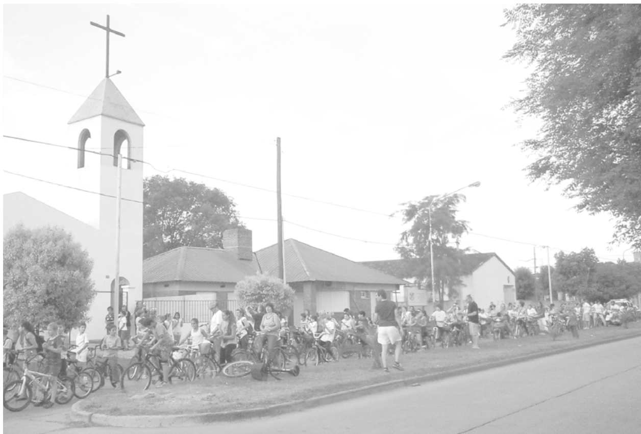
La caravana de la bicicleteada frente a la Capilla de Luján.