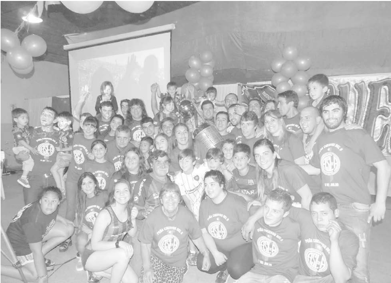
Los integrantes de la Peña "Cuervos del 9" posan con la Copa para Tiempo.

"El Club ha crecido notablemente en estos dos o tres años, se logró la Copa Libertadores y tenemos una actualidad brillante, con notable crecimiento institucional y en el interior del país a través de las Peñas, situación que mucho debemos reconocerle a la actual Comisión Directiva, que no solamente ha trabajado mucho en el fútbol, sino también en otras disciplinas sociales y deportivas", agregó.