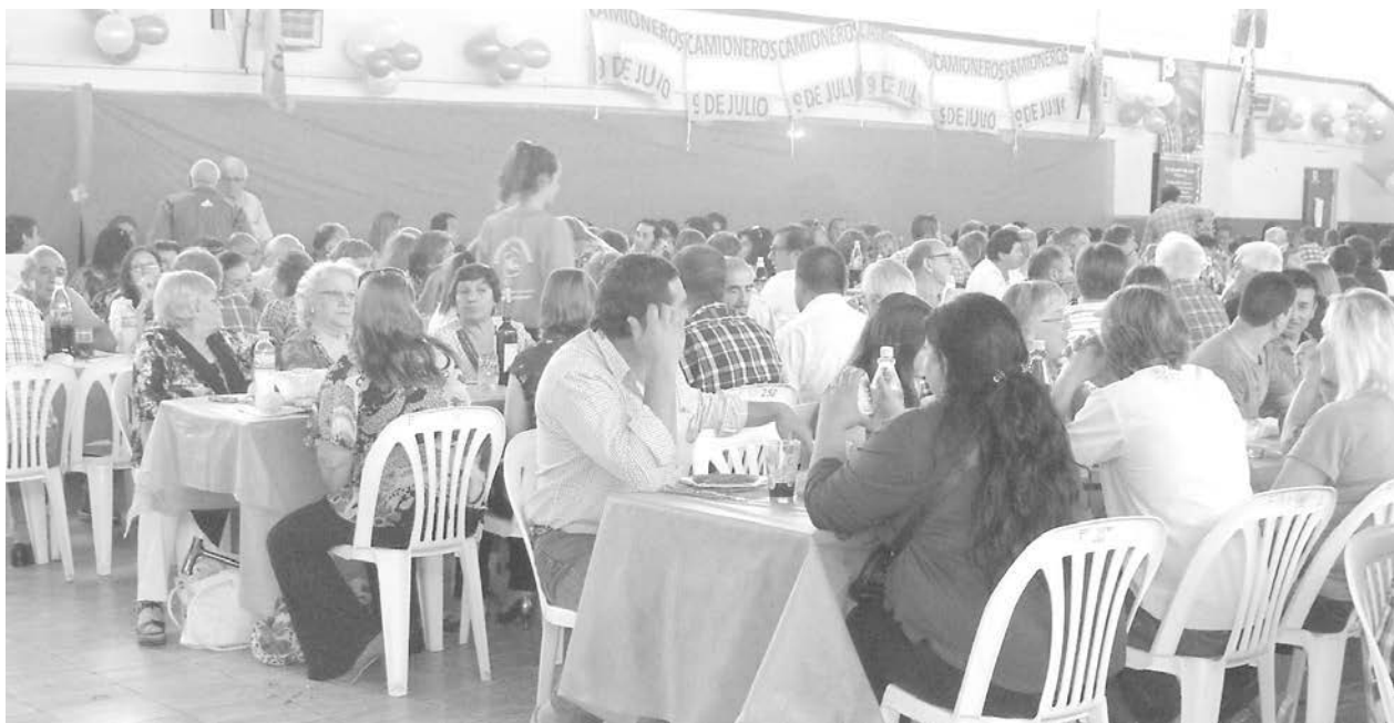
9 de Julio fue sede del festejo del Sindicato de Camioneros.