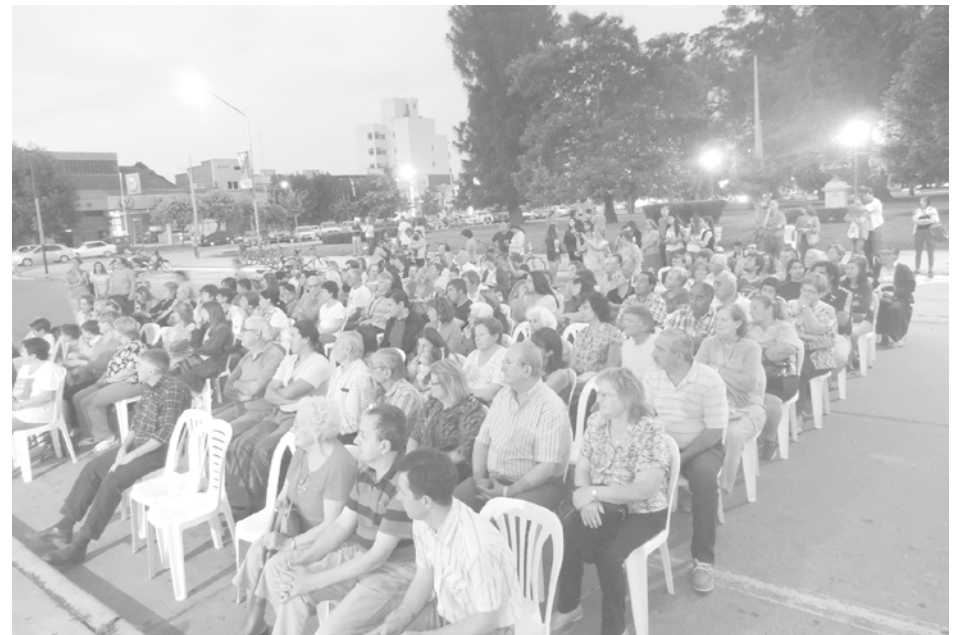
Asistentes a la misa que se celebró frente a Catedral en honor a la Virgen.