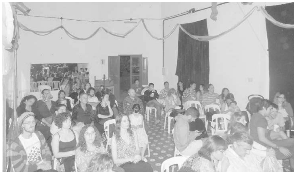
El público acompañó el variété el pasado sábado en La Esquina.

El público acompañó masivamente la propuesta, que fue merecedora de cerrados aplausos.