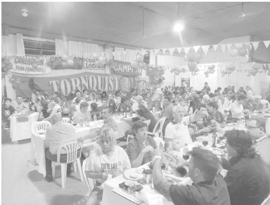
Hinchas y simpatizantes azulgranas colmaron el salón de El Fortín.