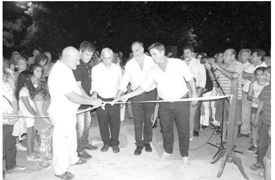
La obra de desagües de barrio Luján fue destacada especialmente por el mandatario.

para la comunidad que trascenderán el tiempo”. Asimismo, con sinceridad, el mandatario saliente, reconoció errores y omisiones, evaluó los mejores y peores momentos que debió afrontar en el ejercicio del poder; criticó mezquindades políticas y dejó un profundo agrade-