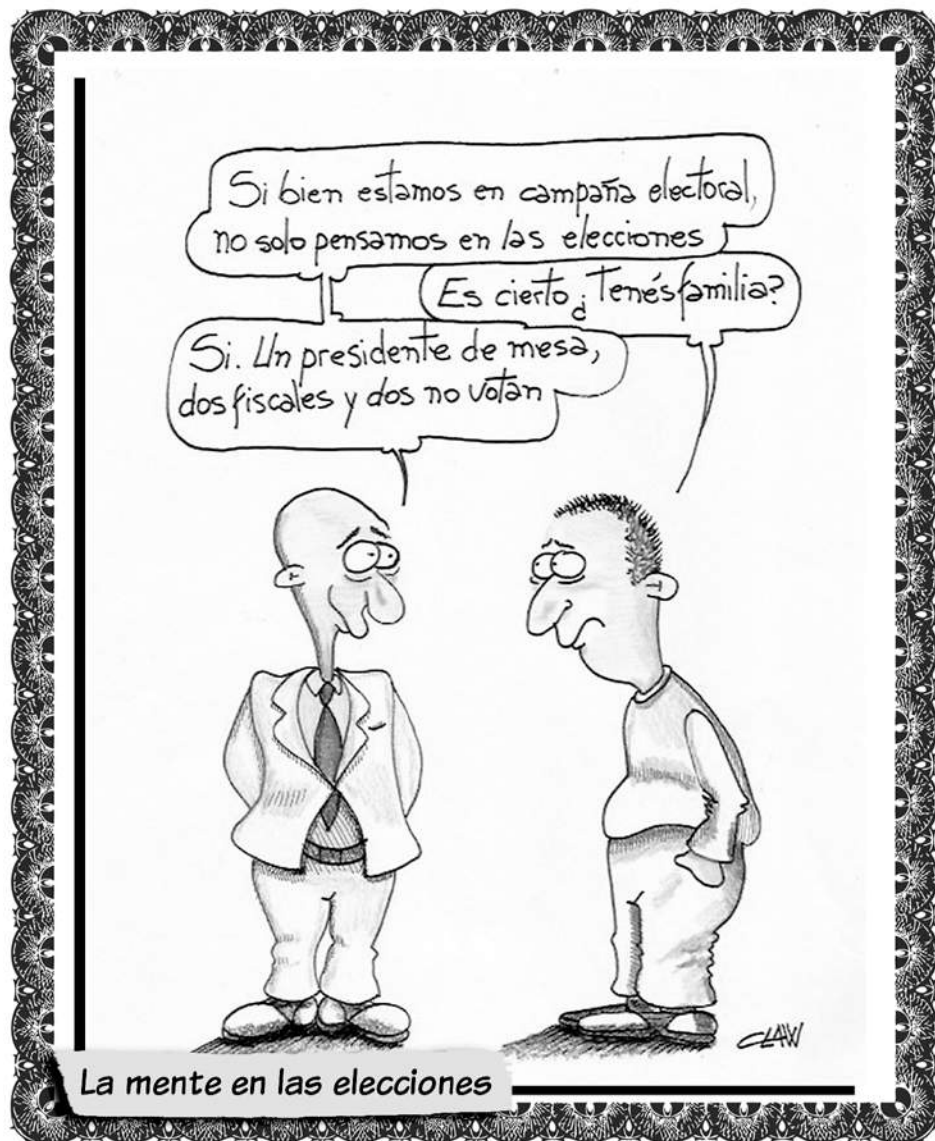
La mente en las elecciones