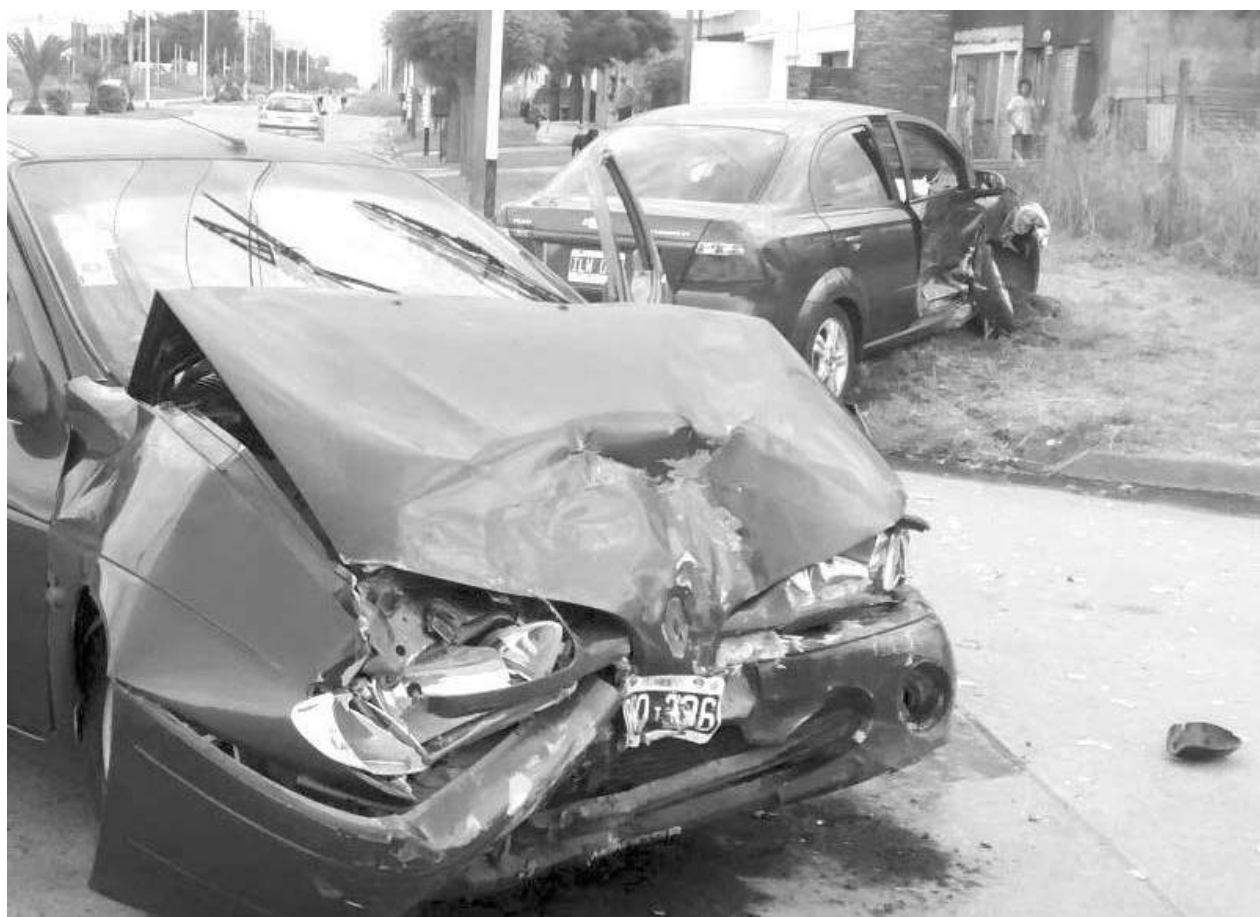
Estado en que quedaron los dos vehículos tras el violento impacto.

Producto del choque, ambos conductores fueron rápidamente asistidos por ClySa y trasladados al Hospital Julio de Vedia.