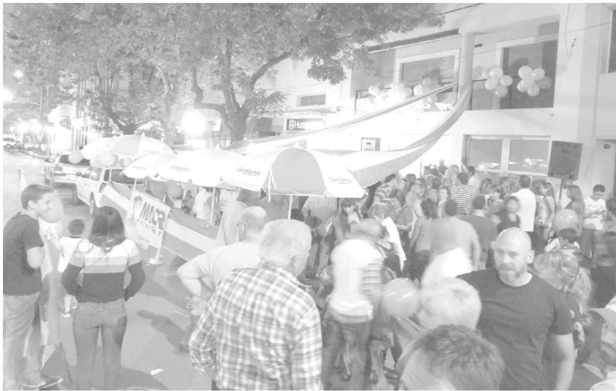
Integrantes de Cambiemos festejaron en el centro de la ciudad.