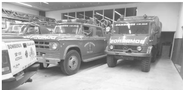
Vista del nuevo piso de Bomberos Voluntarios.