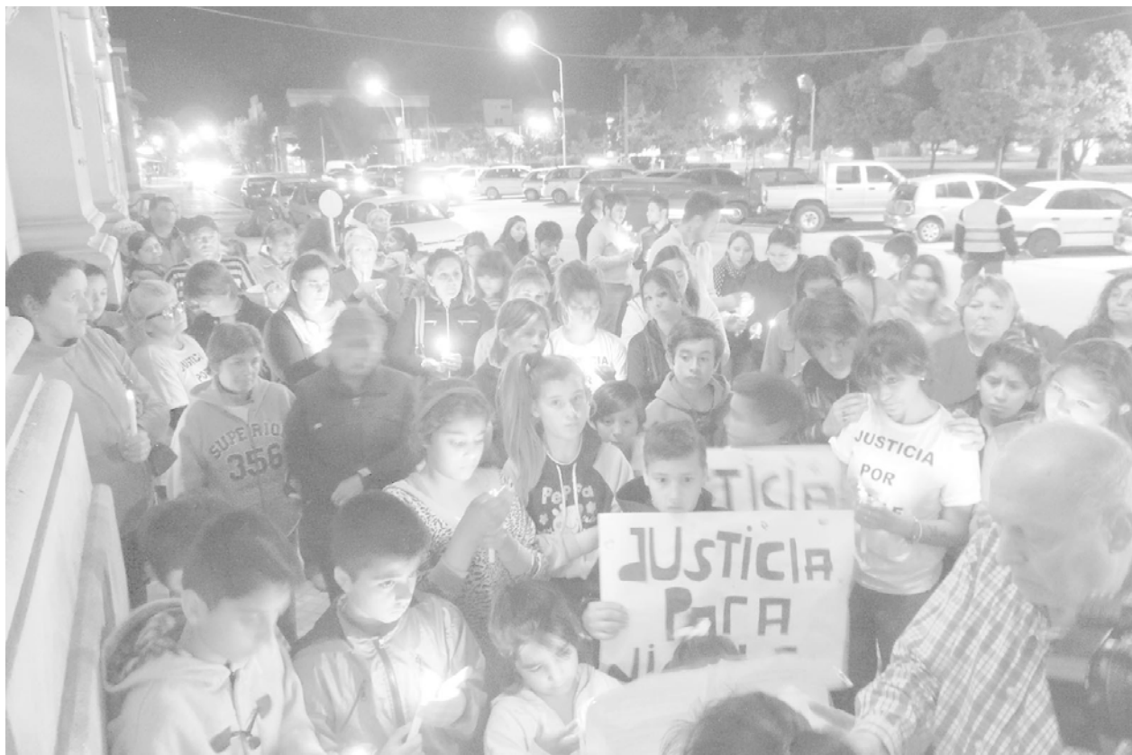
Familiares, amigos y vecinos participaron de la marcha por pedido de justicia.