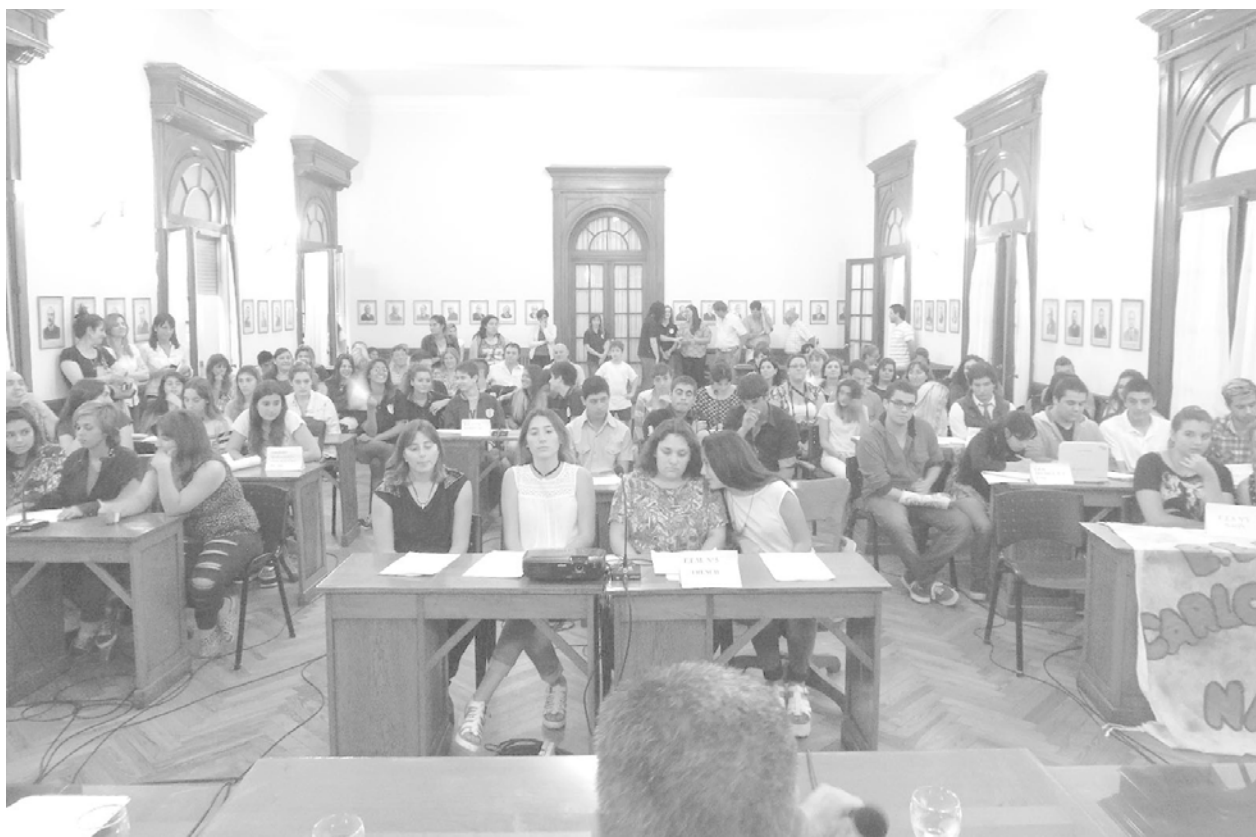
Los alumnos fueron concejales por un día en la sesión desarrollada ayer.