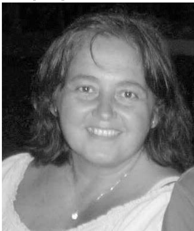
Te deseamos un muy feliz cumple!!!