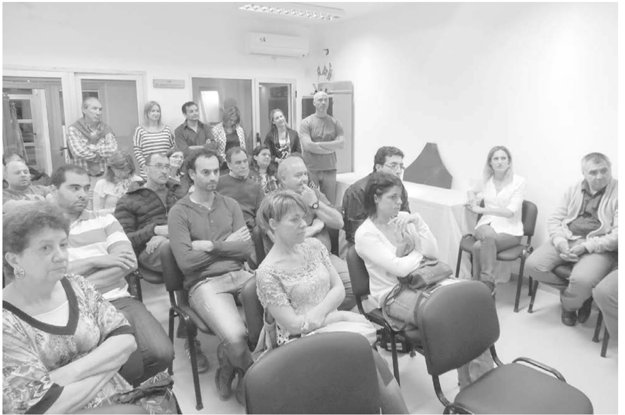
Arquitectos y personal de las empresas, presentes en la charla informativa.

"Sus chapas miden 3,20m por 1,50m o 3,60m por