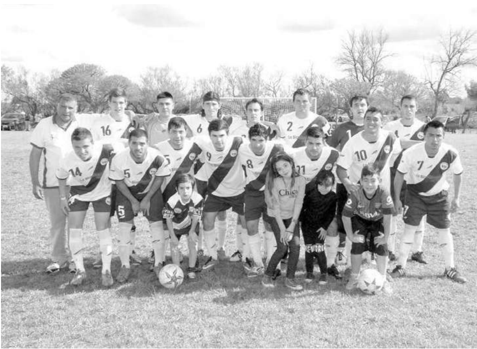
Compañía General Buenos Aires de Patricios.