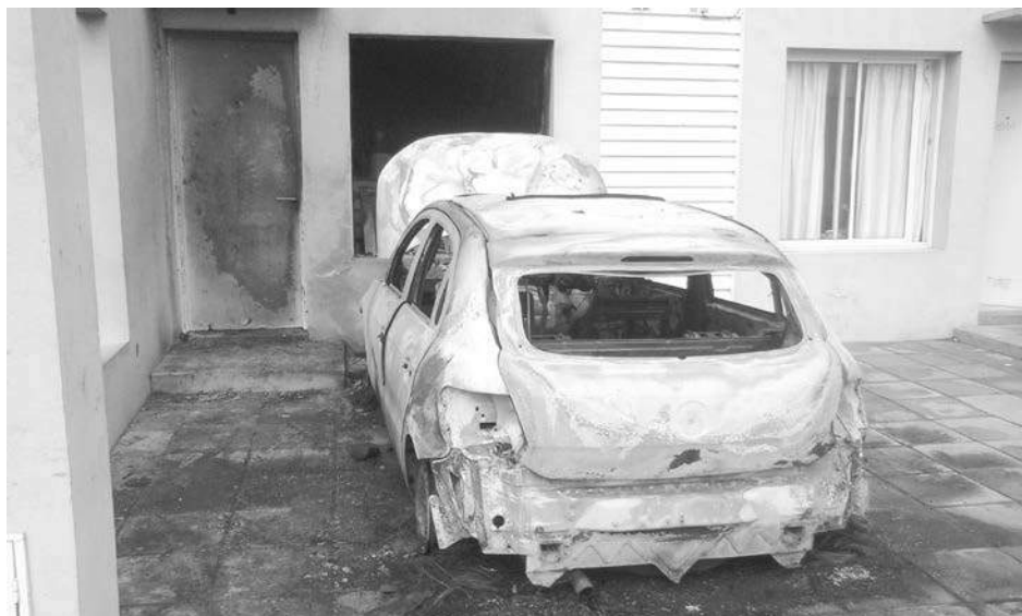
Tomó fuego tanto el coche como el departamento de los propietarios.

En la madrugada del viernes, efectivos de Bomberos Voluntarios de 9 de Julio fueron convocados desde una vivienda ubicada en calle Mendoza 1508, entre Garmendia y Gardel; en