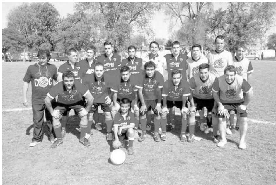
Club Atlético Naón.

Como la disputa se llevara a cabo por el sistema de puntos ninguno de los partidos exigirá definición, es decir, finalizarán invariablemente al cabo del tiempo de juego estipulado. En caso de existir igualdad en puntos al término de la Primera y Segunda Fase, a los efectos de establecer una clasificación se aplicará lo previsto en el punto