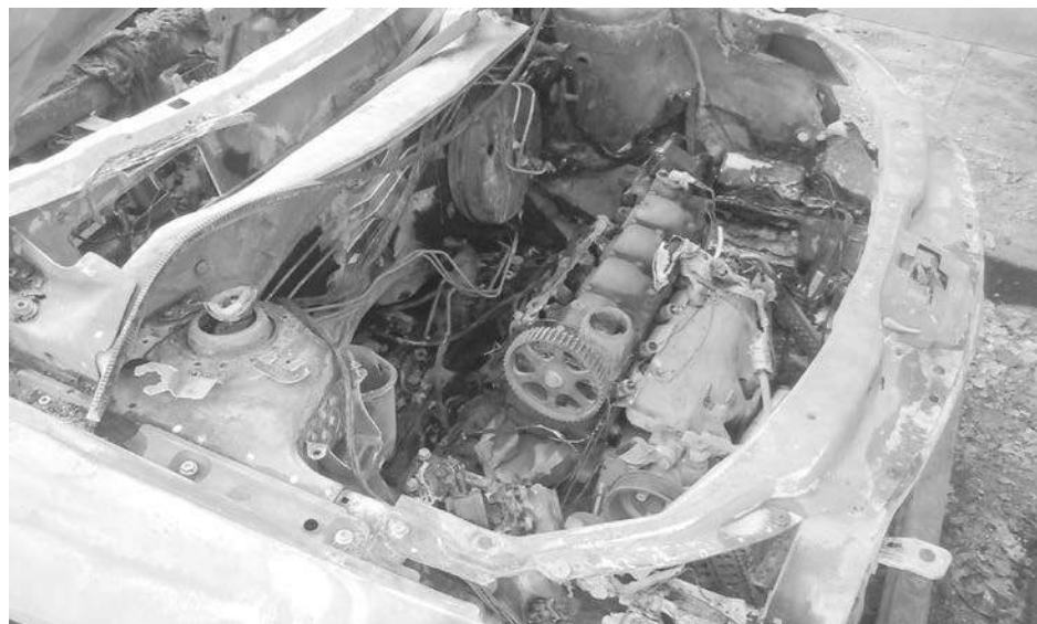
En la imagen se puede ver el estado en que quedó el motor.

do como en la parte externa y la planta motriz y tenía apenas cuatro meses de rodaje, ya que había sido adquirido mediante un plan y adjudicado en la cuarta cuota.