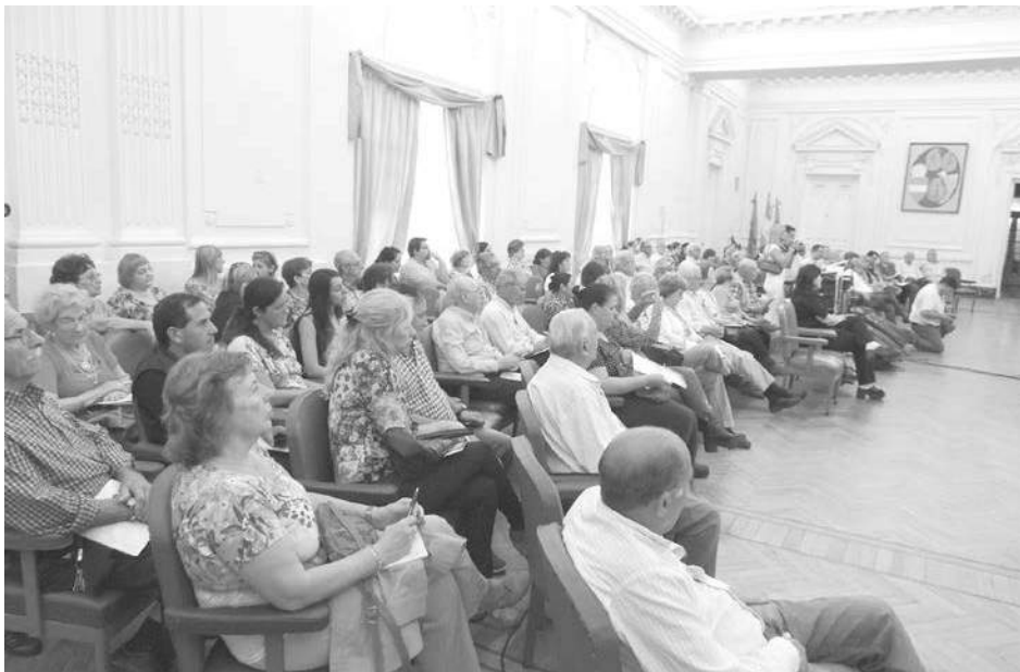
Asistentes a la importante charla realizada ayer.

El reconocido cardiólogo disertó en nuestra ciudad abordando sendas charlas sobre hipertensión. La primera de ellas abierta a la comunidad y la restante para profesionales de la salud.