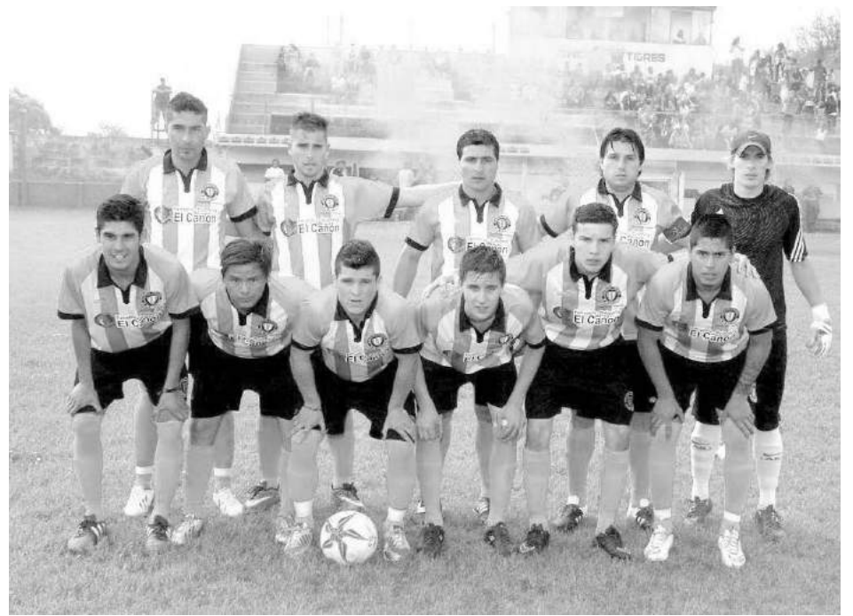
12 de Octubre.

Si el ganador de la primera fase coincide con la ubicación primero de la segunda fase, este asciende directamente a la Categoría "A" en el año 2016 y será el Campeón 2015 de la Liga Nuevejuliense de Fútbol Categoría "B". Si el ganador de la primera fase no coincide con la ubicación primero de la