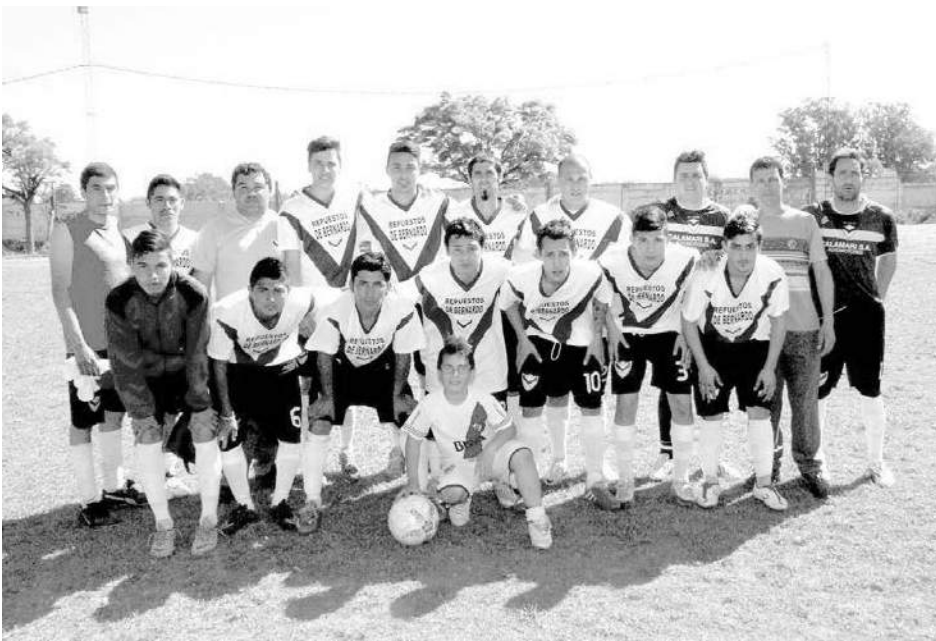
Club El Fortín.

segunda fase, se disputará dos partidos por el sistema de eliminación directa, uno en cada sede. La localía será establecida por ventaja deportiva para el que obtenga mayor cantidad de puntos en la fase que salga en primera posición. En caso de obtener los equipos que salgan primeros en su fase la misma cantidad de puntos, obtendrá la ventaja el equipo