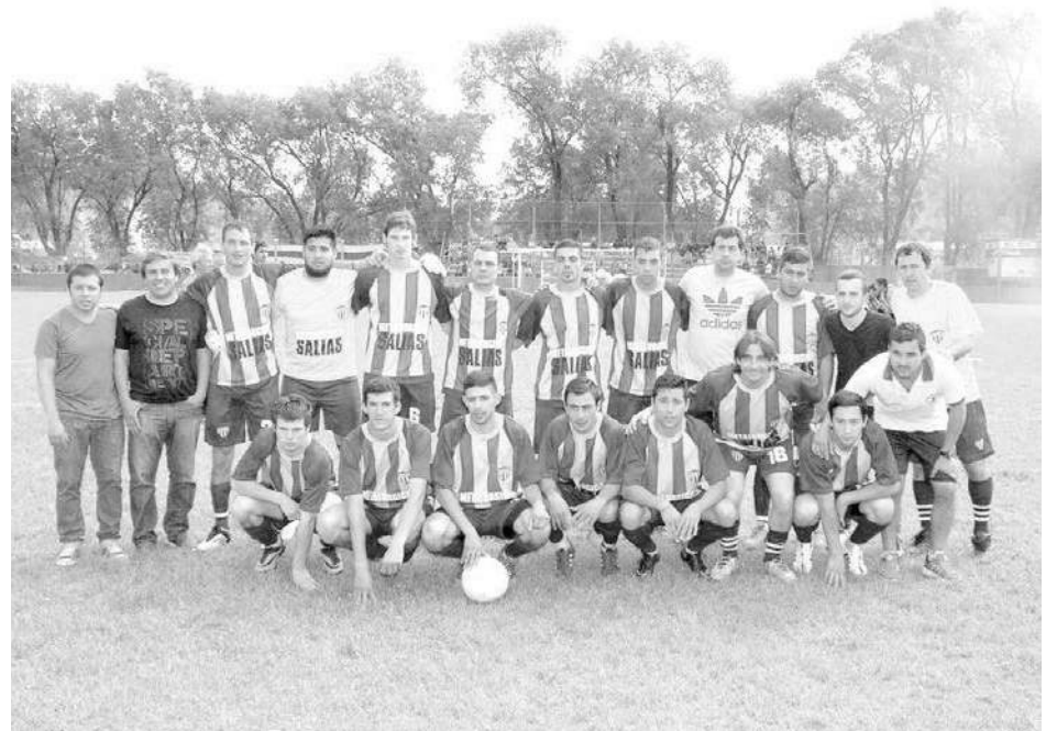
18 de Octubre.