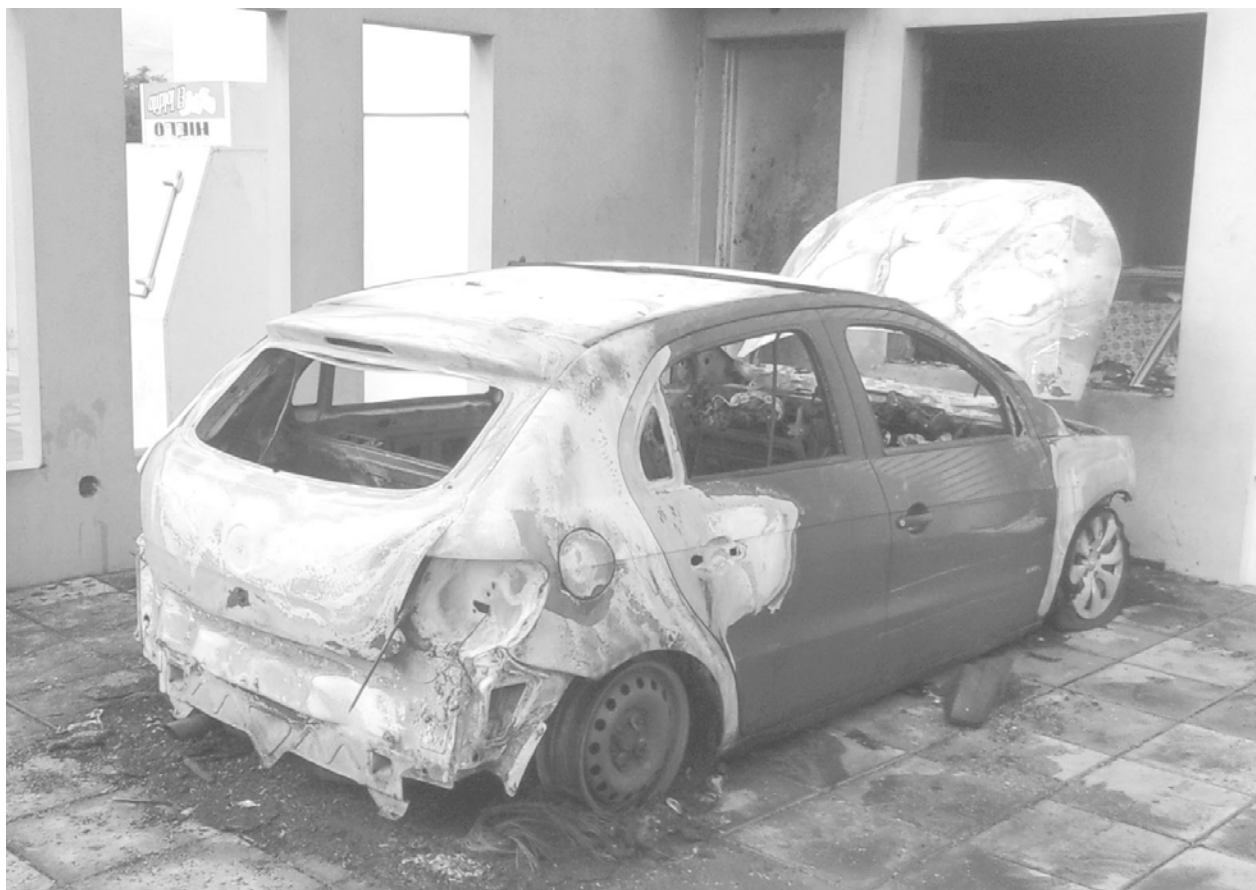
El automóvil incendiado el jueves quedó totalmente destruido.