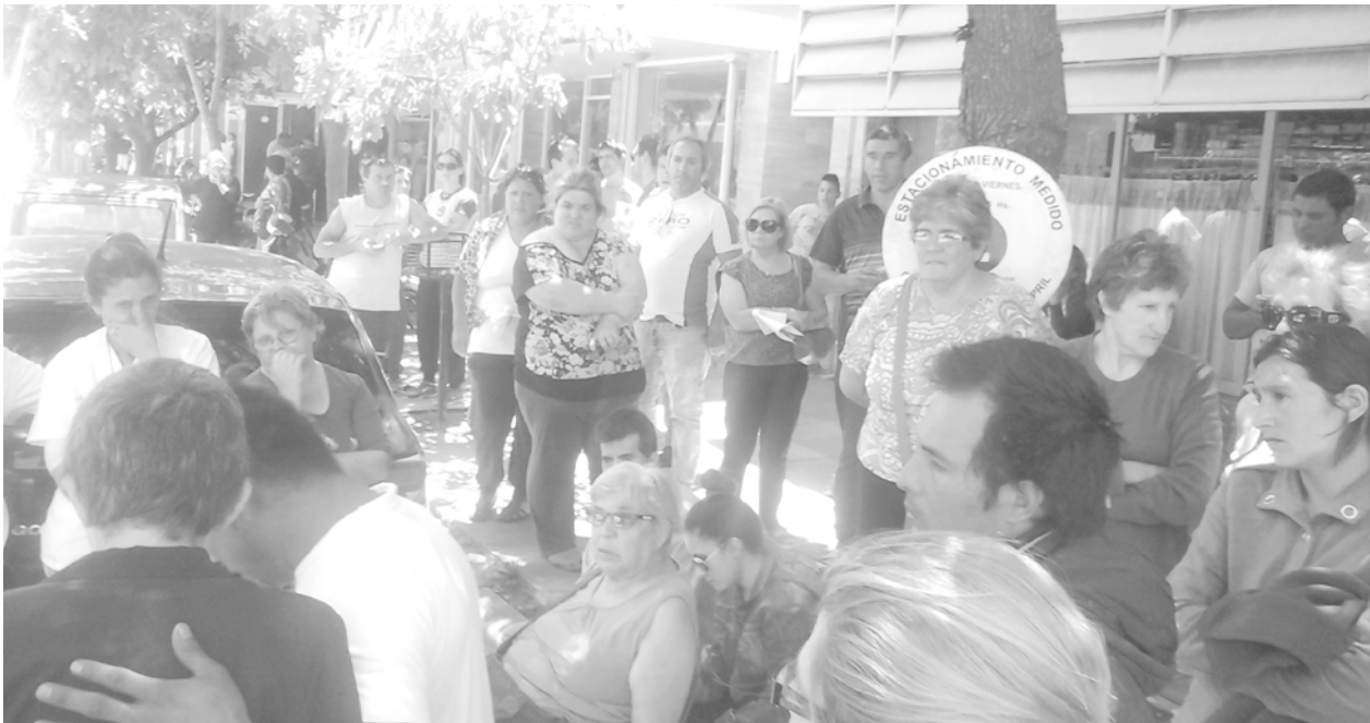
Numerosos vecinos se acercaron al Juzgado ante el inusual hecho.