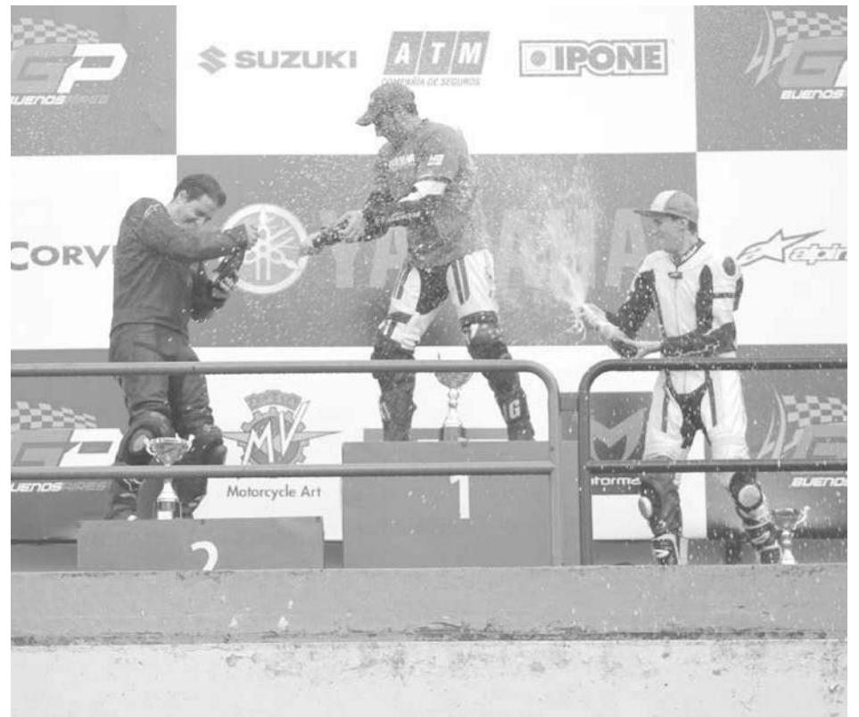
El nuevejuliense festeja en podio de Buenos Aires.

El último fin de semana en el autódromo de la ciudad de Buenos Aires se corrió la última fecha del Campeonato Argentino de Velocidad de Motociclismo. Desde el viernes que salieron las motos a pista, gran cantidad de gente acompañó al evento más grande de motociclismo nacional. Más de 200 motos divididas en 5 categorías dieron un gran espectáculo en el coliseo porteño.