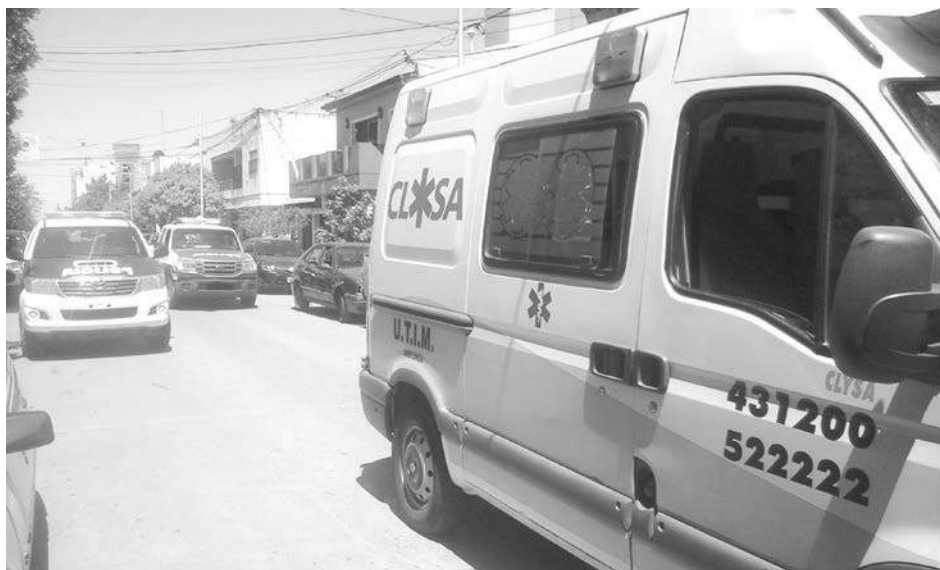
A causa del episodio fue necesario cortar la calle para permitir el trabajo de Policía, Tránsito, Defensa Civil y CLySA.

presentaciones, lo que hace a la lentitud de la causa". En el mismo plano, señaló que a quien está sufriendo