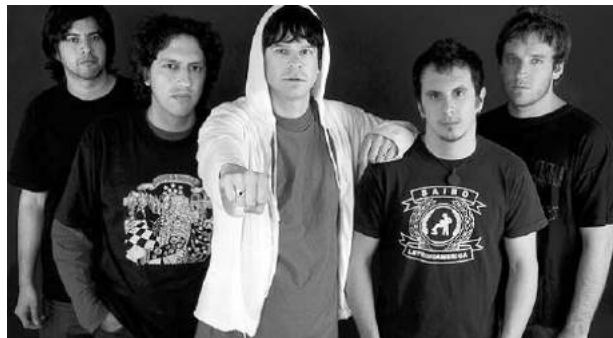
La banda de rock, Jóvenes Pordioseros, se presentará este domingo 15 de noviembre, en la plaza Islas Malvinas de La Plata.

La Plata, 10 Nov (InfoGEI).- Durante la jornada se presentarán bandas locales ganadoras del concurso "Maravillosa Música", habrá stands de productores locales, cooperativas y emprendimientos familiares, espectáculos para toda la familia y un show de Paka Paka. El evento contará en el cierre, con la banda Jóvenes Pordioseros.