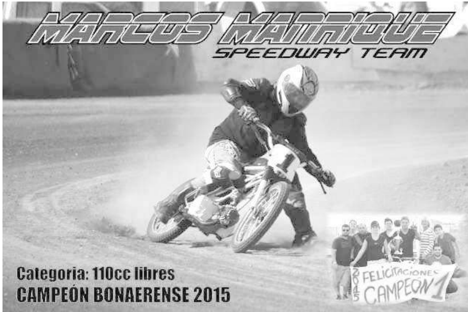
Categoría: 110cc libres CAMPEÓN BONAERENSE 2015

El pasado domingo 8 de noviembre de 2015 en Carlos Casares culminó el campeonato de 10 fechas de Motociclismo Speedway, asistiendo todas las categorías bonaerenses, y en el cual se consagró campeón