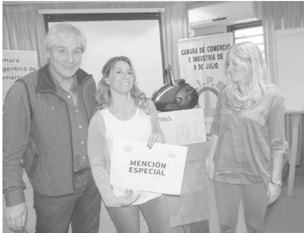
"Extramuros" recibió mención especial.