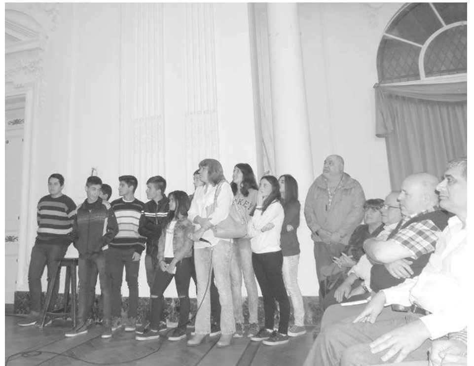
Alumnos y docentes de la Escuela Nro.8 presentan su proyecto educativo.

lari valoró la importancia del trabajo realizado a lo largo del calendario y las características del concurso, que apunta a "aplicar a la juventud la práctica de los principios y valores cooperativos a través de proyectos del bien común para la comunidad y el país". Por su parte, el presidente cooperativo, Omar Malon-