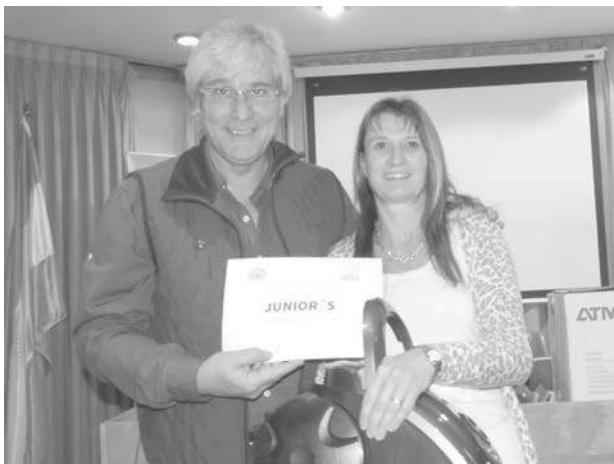
El presidente de la Cámara de Comercio entrega el 3er. premio a "Juniors".