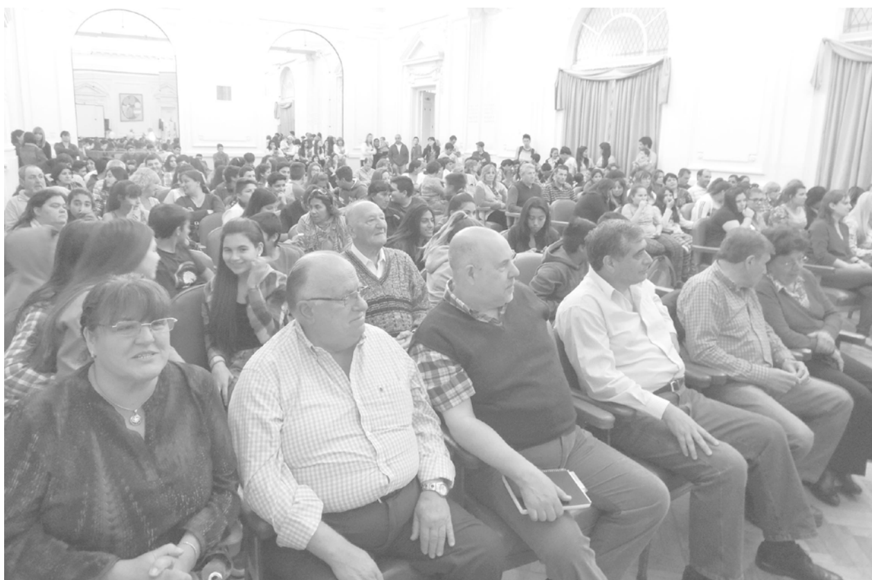
Directivos de la CEyS, docentes y alumnos presentes en el acto de entrega de certificados.