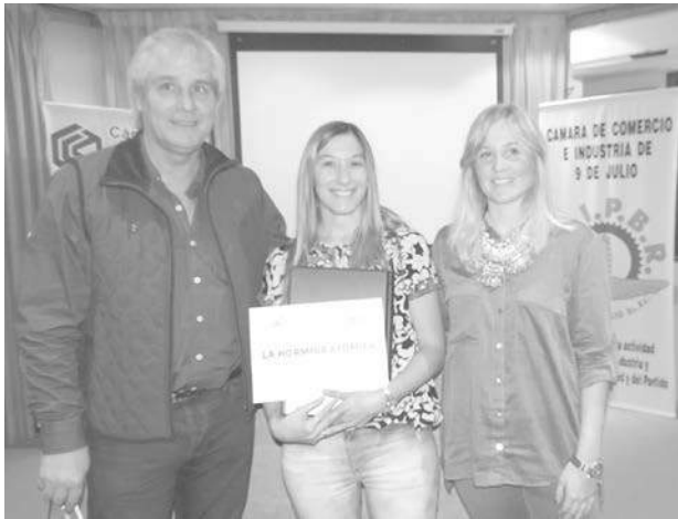
Entrega del 1er. premio a "La Hormiga Atómica".