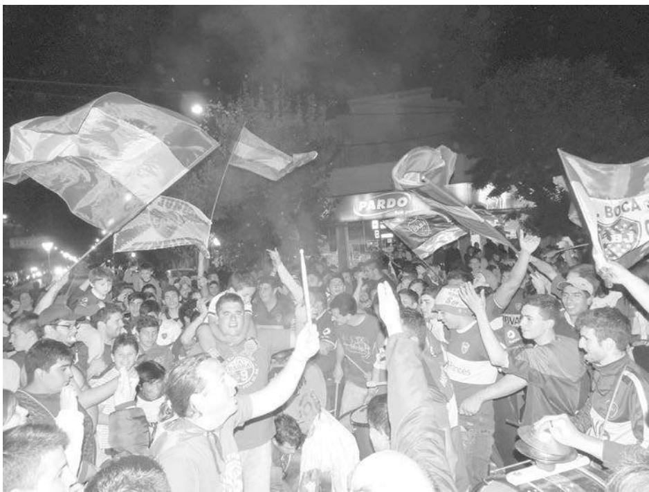
“La Banda del 9” pintó de azul y amarillo el centro de la ciudad.