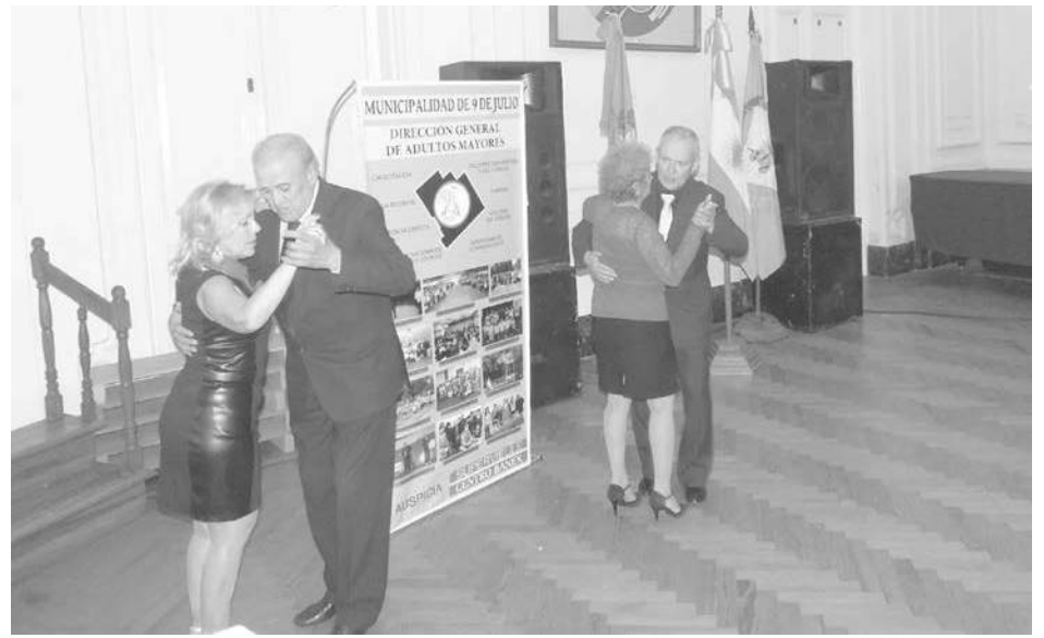
Integrantes de 9 de Julio Tango bailaron al ritmo del dos por cuatro.