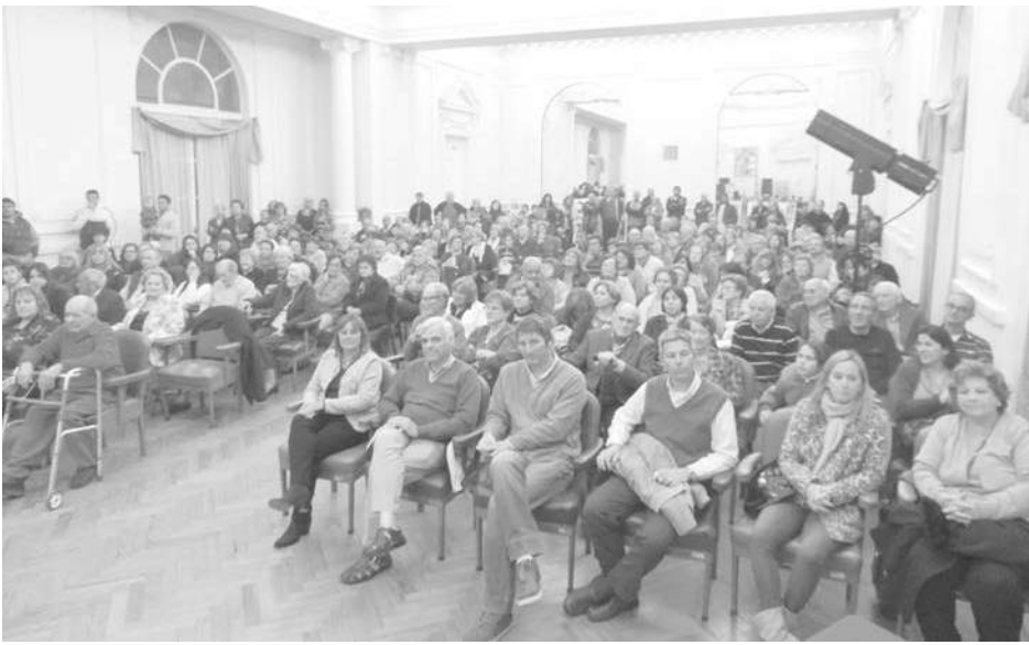
Autoridades municipales, del HCD, de Consejo Escolar y público, presentes.