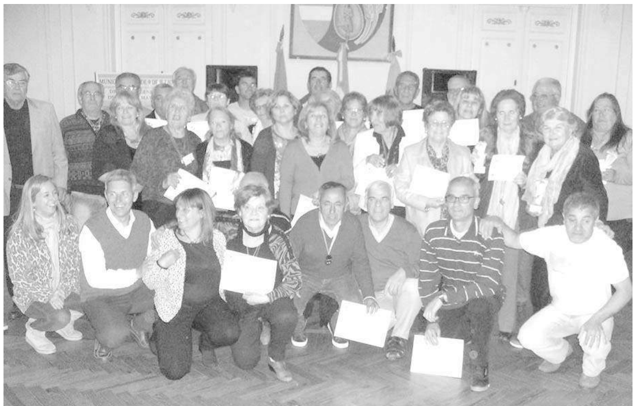
Vecinos reconocidos junto a autoridades, posan para los medios de prensa.

También recibieron diplomas los finalistas de los Juegos 2015 y "Barlovento".