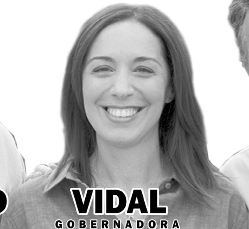
VIDAL G O B E R N A D O R A