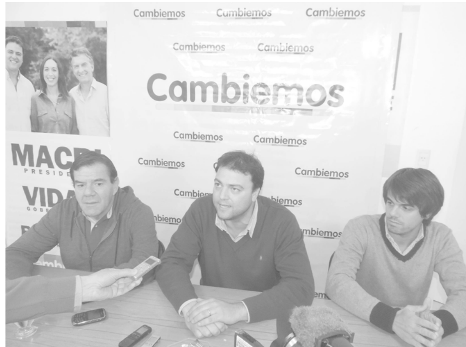
Montenegro, Barroso y Barbieri en rueda de prensa.