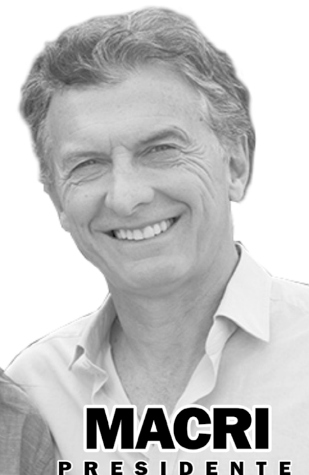
MACRI P R E S I D E N T E