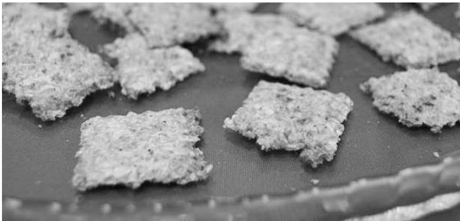
Imaginación, buen gusto y conocimientos científicos se combinan en este snack.

Combina productos saludables previamente estudiados científicamente y además revaloriza cultivos americanos que no se consumen masivamente. El bocadillo fue preseleccionado en el concurso nacional Innovar 2015 y por estos días se exhibe en Tecnópolis. Su explotación comercial requerirá una inversión del capital privado.