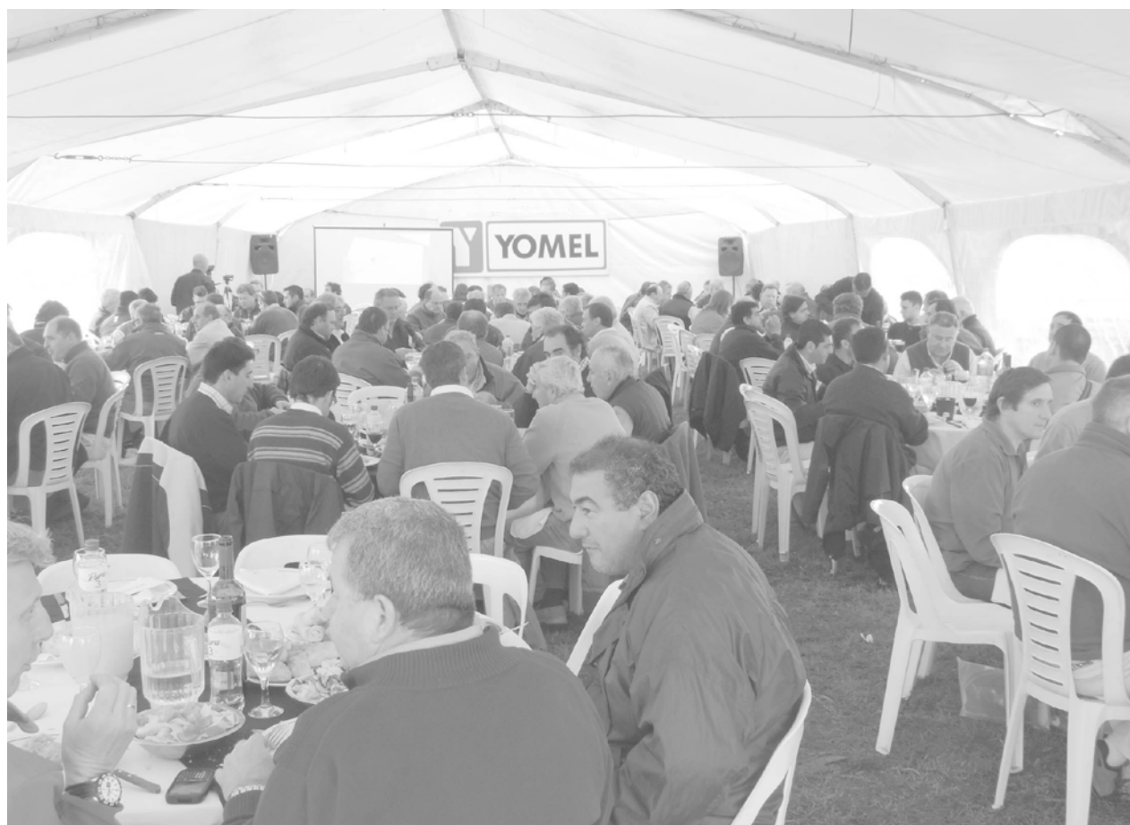
Importante concurrencia de representantes de la empresa y clientes en la mega muestra anual.

Más de un centenar de concesionarios de todo el país y el exterior presenciaron la presentación de un Mixer Vertical y una enfardadora de fardos gigantes, entre otras maquinarias. Inf. en Págs. 10 y 11.