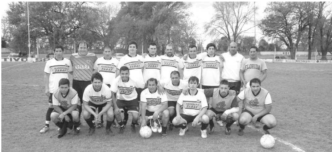
Defensores de La Boca.