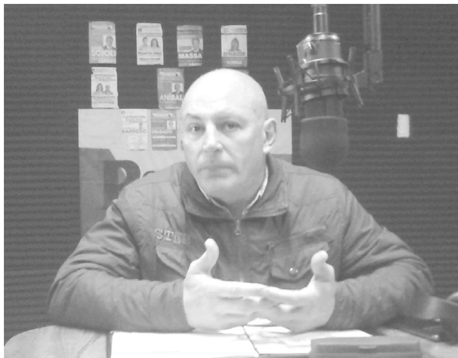
Delgado cuestionó el accionar en el área de Seguridad en nuestra ciudad.

"Tenemos mayor cantidad de efectivos años tras años, nuevos móviles, más comisarías, cámaras de seguridad y una Ayudantía Fiscal, entre otras nuevas dependencias; pero sin embargo los