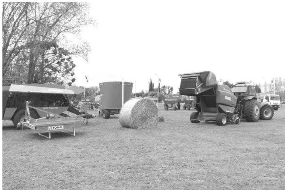
La empresa local expuso las últimas maquinarias que compiten en el mercado.

En la jornada de ayer, la empresa local "Yomel", en su planta fabril de Ruta 65 y Av. Mitre, llevó adelante su séptimo encuentro anual de capacitación y fortalecimiento a concesionarios. El mismo tuvo por objeto presentar los objetivos logrados este año, la proyección para el año 2016, y el desarrollo de nuevos productos, en este calendario un Mixer Vertical más tres