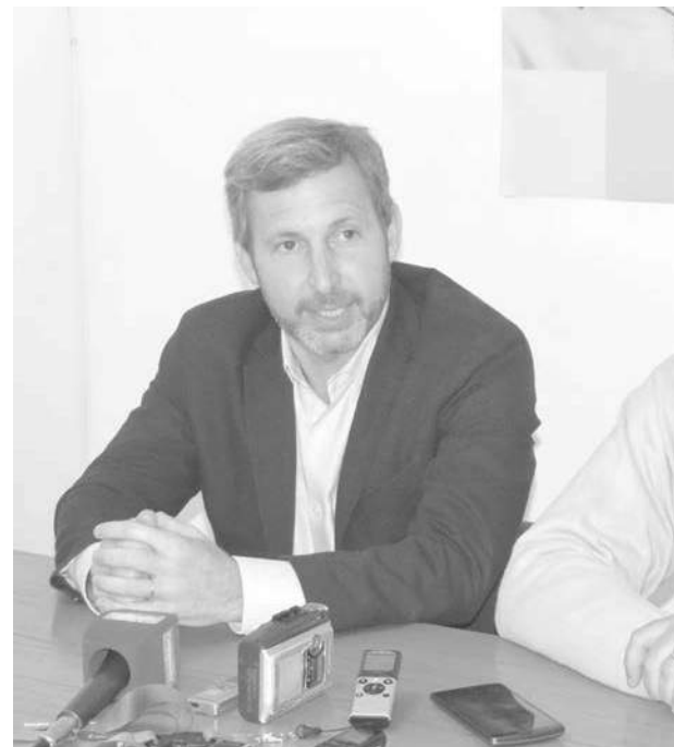
Rogelio Frigerio dejó su parecer económico.

"Hemos vivido los últimos 50 años pasando del populismo al ajuste, por lo que tenemos la necesidad de parar con esto, que ha dejado 14 millones de pobres 4 millones de argentinos que se van a dormir con hambre todas las noches, en un país que puede darle