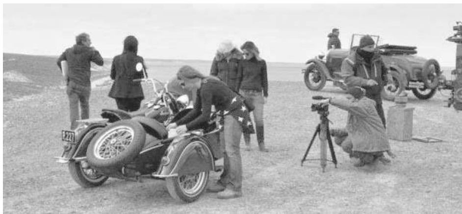
El rodaje en el majestuoso escenario natural.

El rodaje empezó esta semana y se lleva adelante en El Doradillo, en escenarios naturales y paisajes únicos monitoreados por Guardaparques. Se trata de una adaptación de la famosa novela francesa, ambientada en la década de 1920 en una ciudad ficticia del Brasil. La cadena Globo espera emitir esta producción durante 2016.