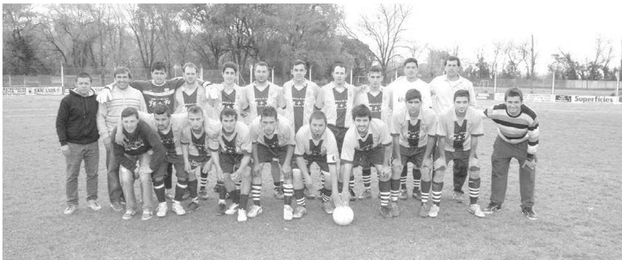
18 de Octubre.