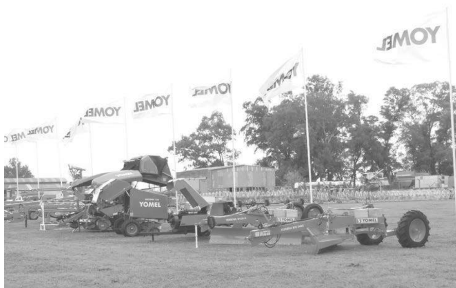
Clientes de una amplia zona del país y países vecinos participaron de la jornada.