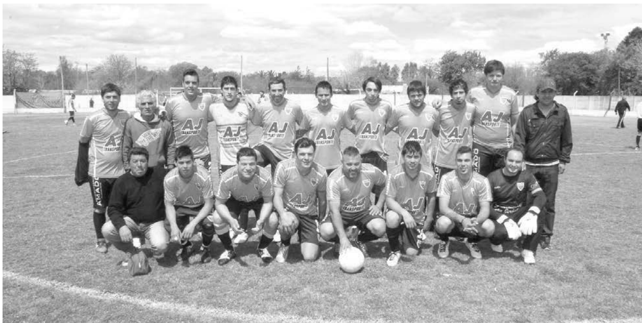
Defensores de Sarmiento.