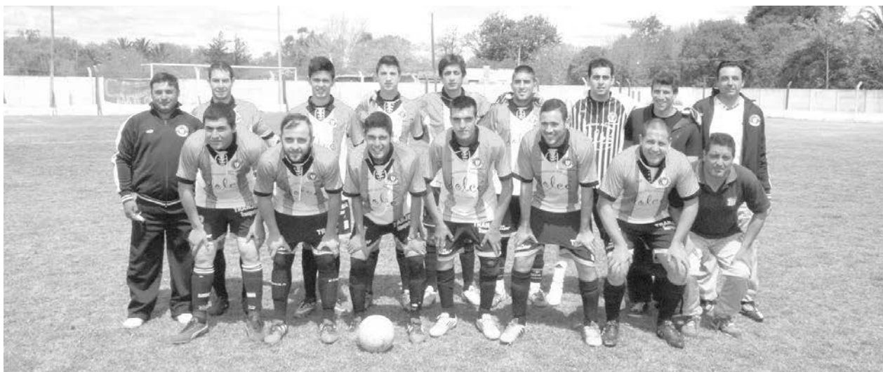
12 de Octubre.