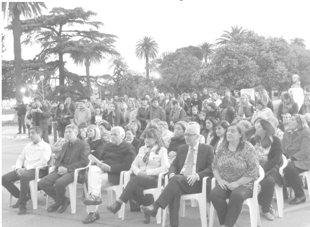
Autoridades educativas, políticas y Eclesiásticas y público, presentes en acto.