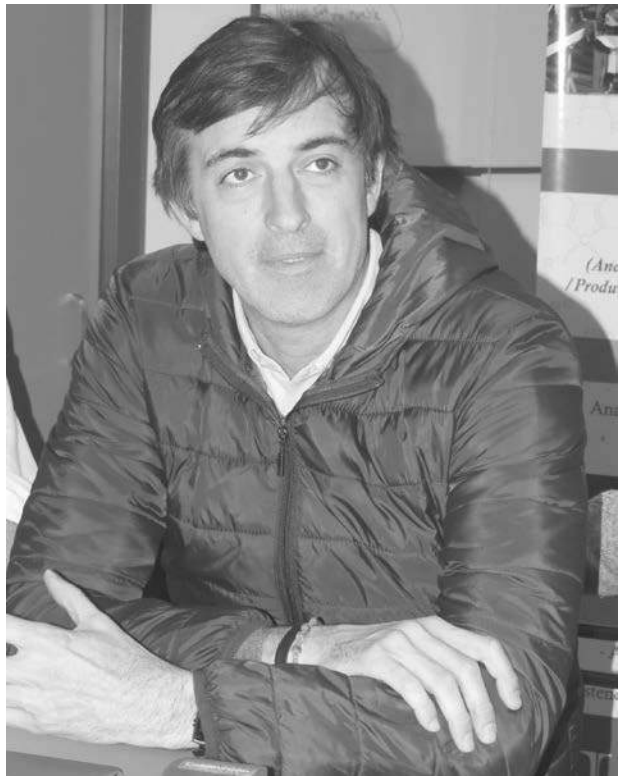
Esteban Bullrich en campaña en nuestra ciudad.

El ministro de Educación de la Ciudad Autónoma de Buenos Aires y propuesto por Mauricio Macri para ocupar la cartera educativa nacional en caso de ser electo Presidente de la Nación en las elecciones generales, sostuvo que el docente “debe ser la persona más importante de la sociedad, teniendo un rol protagónico”.