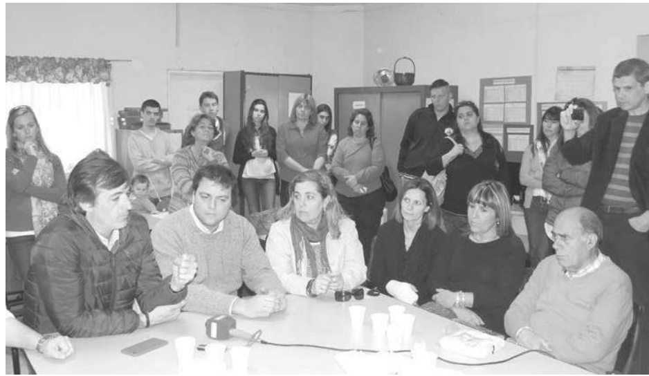
Directivos del ISETA reunidos con integrantes del Frente Cambiemos.

“Necesitamos de un sistema educativo del siglo XXI, cuestión que claramente no está sucediendo en el ámbi-