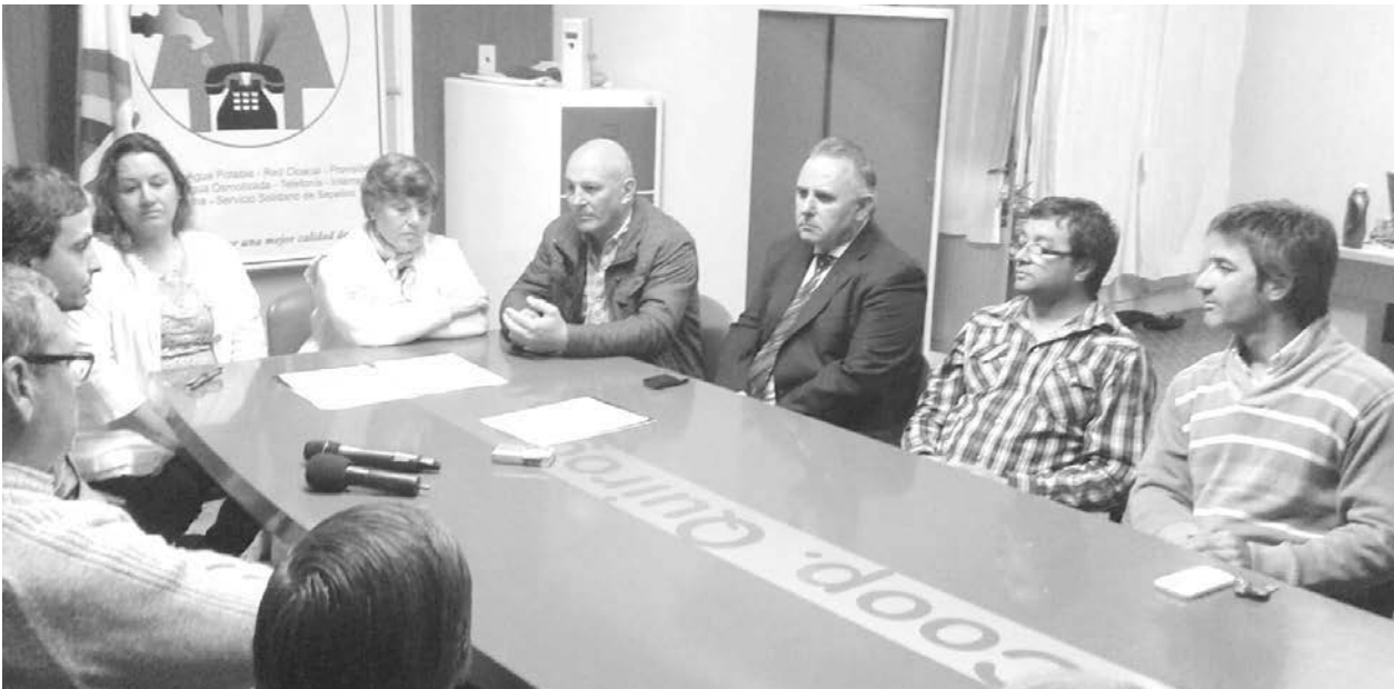
Integrantes del Consejo de Administración de la Cooperativa reunidos con los funcionarios provinciales.

dirigentes y funcionarios por el anuncio y puesta en marcha de las obras anunciadas, se desarrolló una importante reunión. Posteriormente, se trasladaron en modo de caravana a visitar todos los barrios que se beneficiarían con la ampliación de la red de agua y cloacas, pasando por el Barrio Las Ranas, Barrio Solidaridad II, y Barrio Avellaneda. En el barrio Solidaridad,