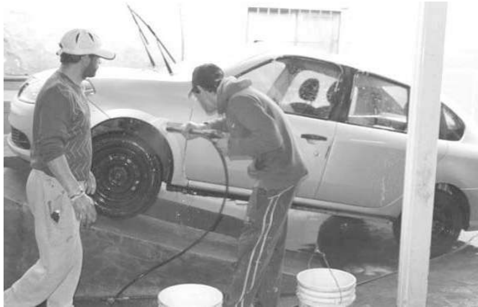
"Con esta oportunidad pudimos demostrar que nosotros somos aptos para tener nuestro propio espacio de trabajo, y que tenemos ganas de trabajar y vamos a seguir haciéndolo", describió el coordinador del lavadero.

Luego de 10 meses de la prohibición municipal para trabajar en las inmediaciones del Palacio de Mójica, "Los Trapitos" abrieron su propio lavadero. La recuperación de sus fuentes laborales llegó tras un proceso de organización impulsado por la Central de Trabajadores Argentinos (CTA), la agrupación "La insurgente" y con apoyo del municipio local.