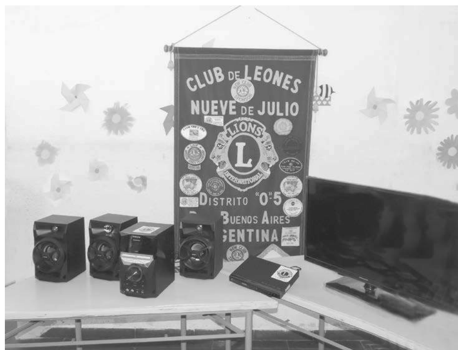
Vista de los elementos donados al establecimiento educativo.

cativo, que posee jornada completa y cuenta con una matrícula de 117 alumnos; agradeció el aporte de los Leones y destacó la importancia de estos elementos para reemplazar a los que actualmente se encontraban en uso, y que resultan totalmente obsoletos.