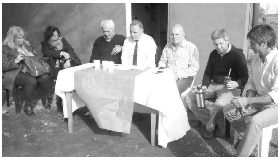
Pasaje de la firma de convenio realizada también en la localidad de Dudignac.