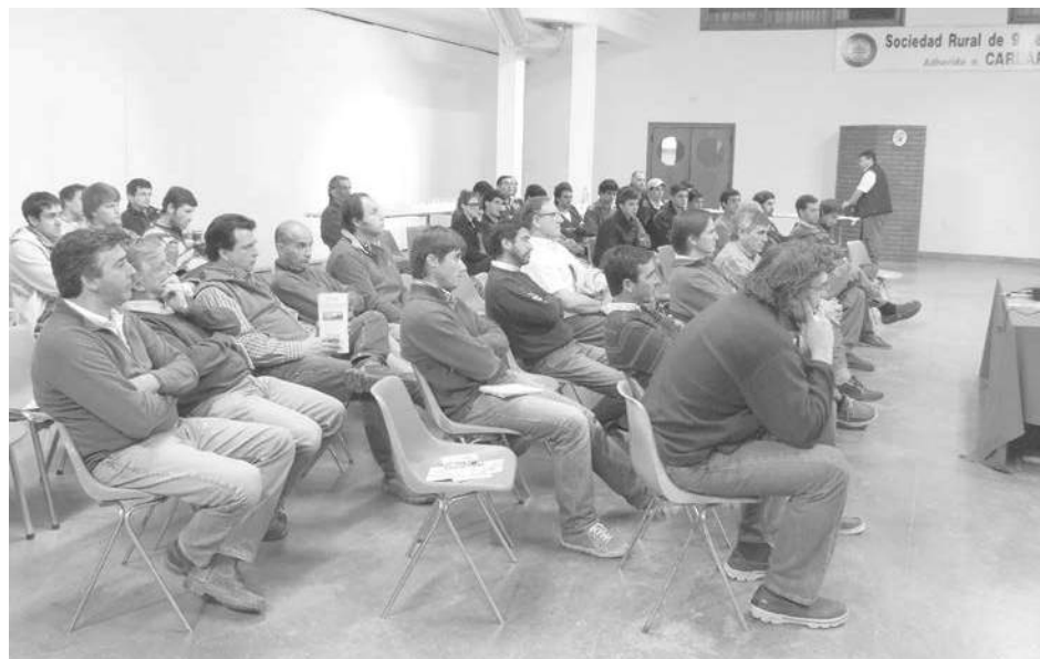
Productores presentes en la jornada de ganadería.