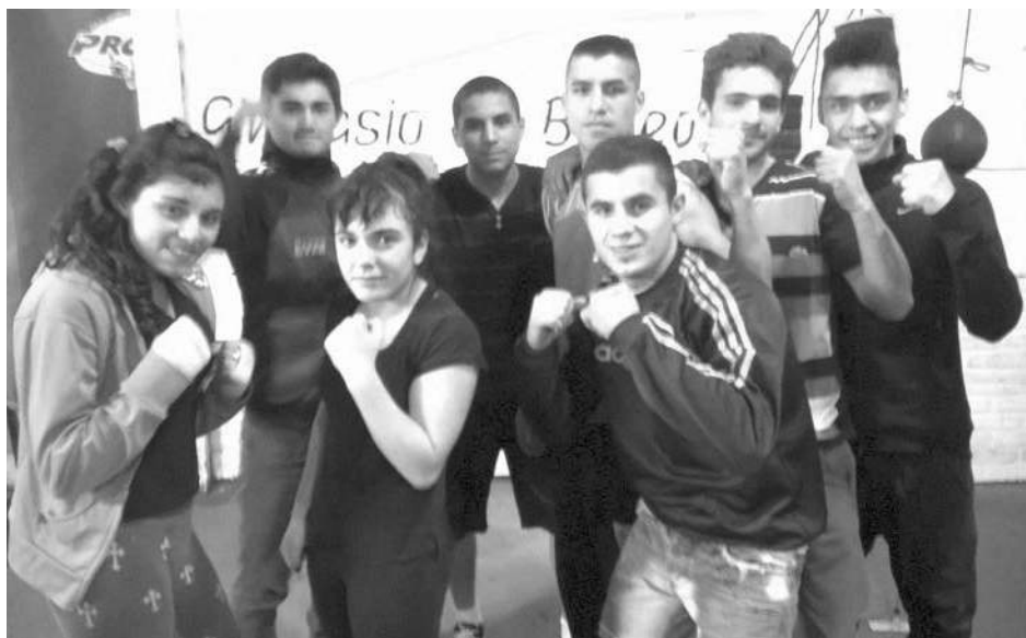
Tras el pesaje, los protagonistas de las peleas posan con los típicos puños "en guardia".

Como se anunciara oportunamente, esta noche se desarrollará el 3er. festival boxístico organizado por el "Clan Ferrario", en las instalaciones de CEC a partir de las 21.30 hs.