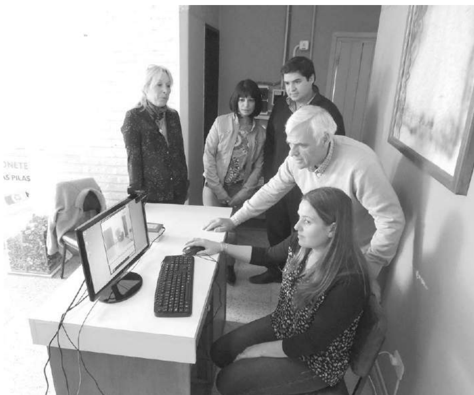
El Intendente junto a funcionarios y empleados municipales en Dudignac.

auspicio de la firma Ceres Agropecuaria. Respecto del expositor, destacó sus virtudes como orador, por su “claridad de conceptos”, y destacó la posibilidad de realizarle consultas tras la exposición.