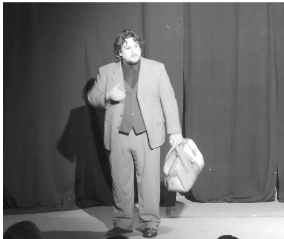
Dos pasajes de la exitosa obra de teatro presentada en el T.I.N.