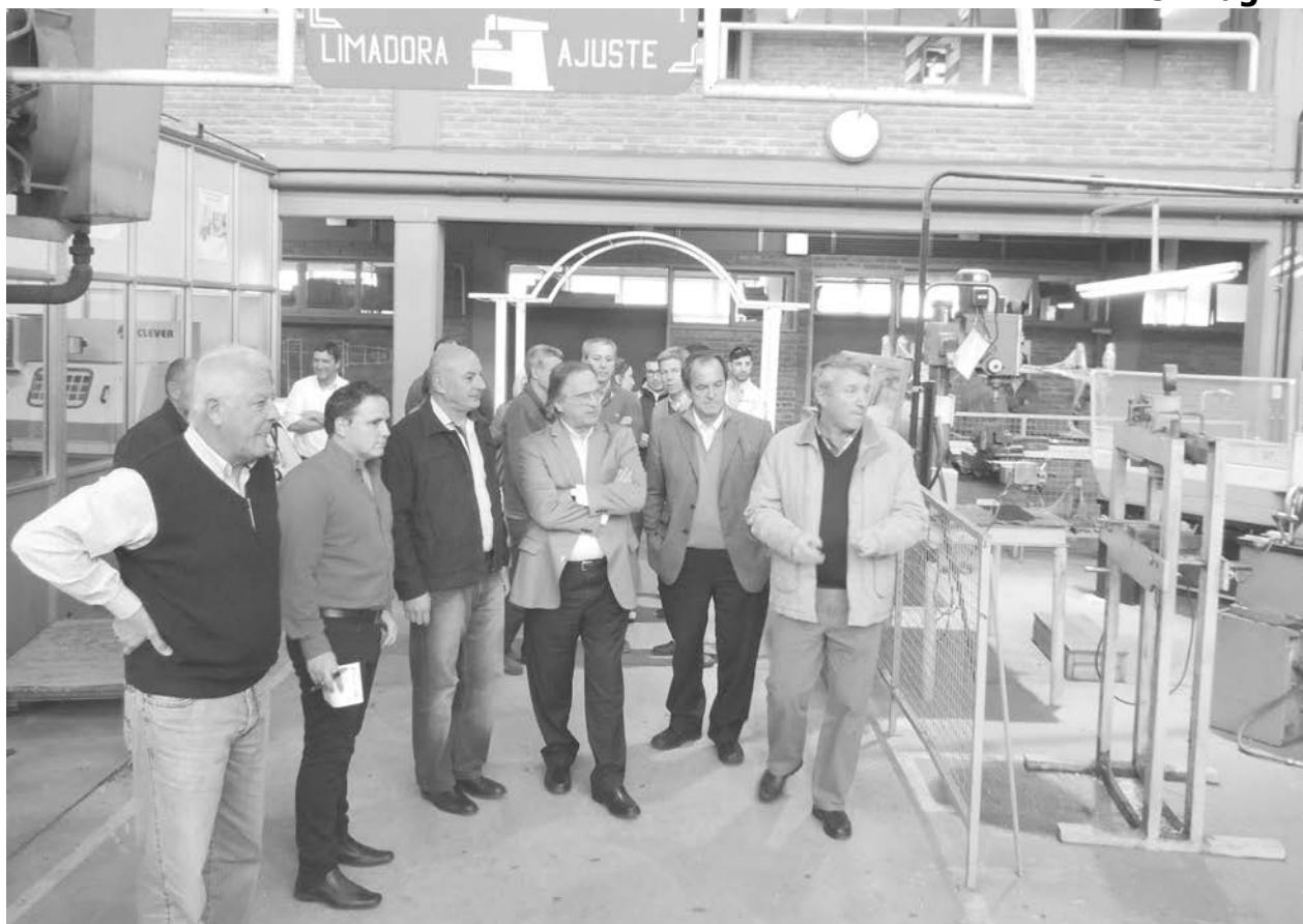
Gianella junto a Delgado y autoridades de la EET Nro. 2, recorren el establecimiento educativo.

EN CHARLA IMPULSADA POR EL CLUB Y BIBLIOTECA AGUSTIN ALVAREZ