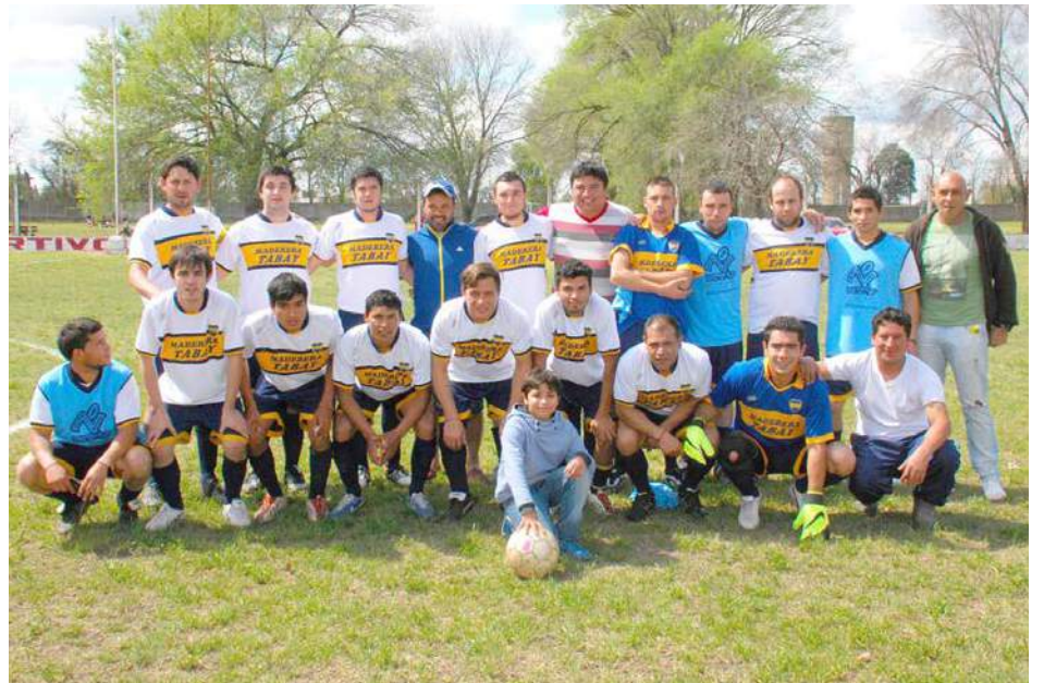
Defensores de La Boca.