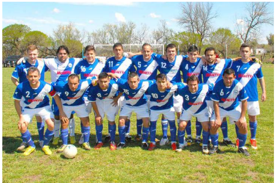
Compañía General Buenos Aires de Patricios.