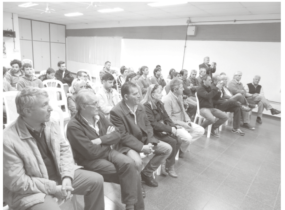
Empresarios, entidades, autoridades educativas y políticas presentes.

Asimismo, celebró la posibilidad de llevar adelante