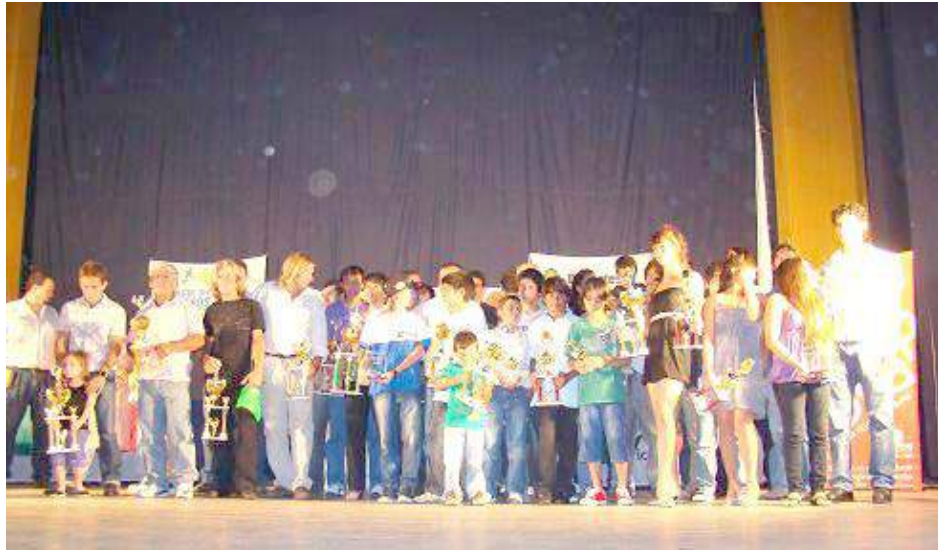
Vista de los ternados elegidos años anteriores.