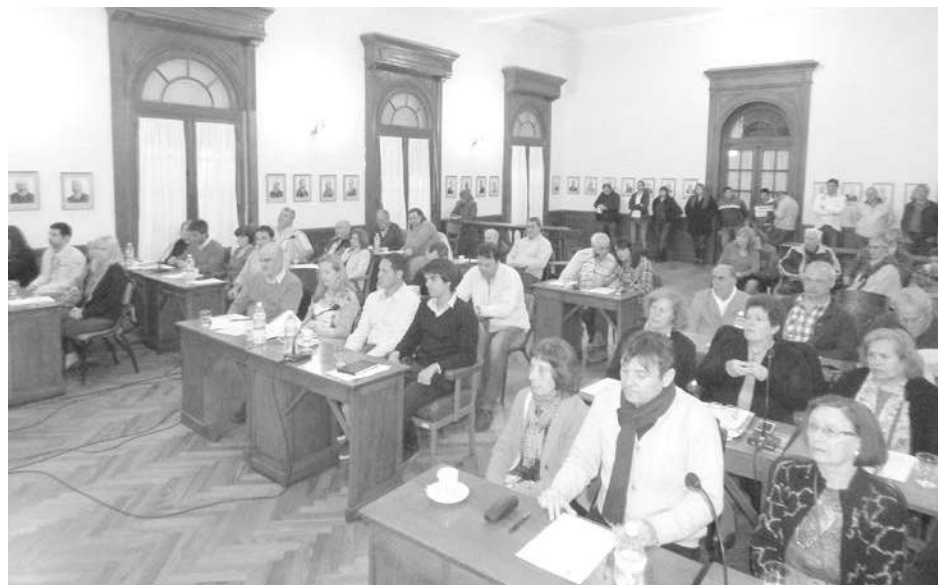
Vista de concejales y Mayores Contribuyentes en la última sesión. sobre la situación de la EET Nro. 1 "Otto Krause".