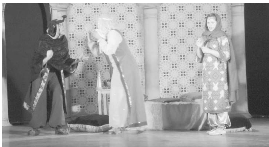
El espectáculo de primer nivel pasó una vez más.