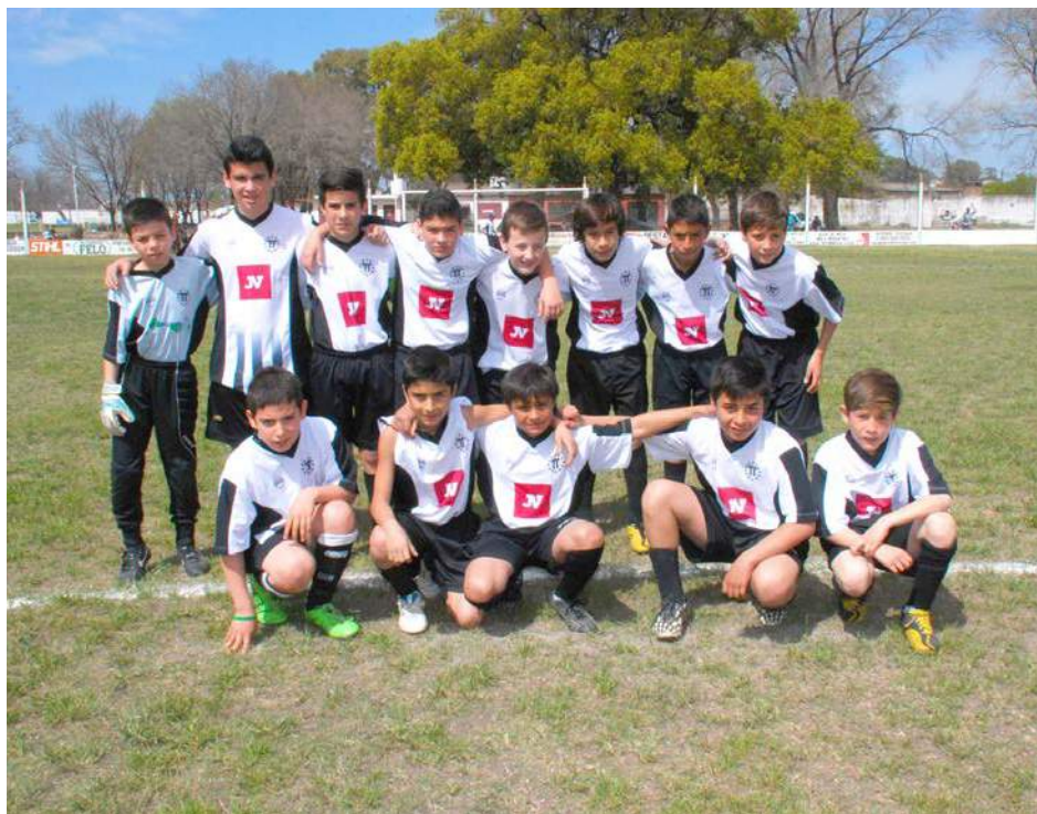
Novena División de Atlético French.