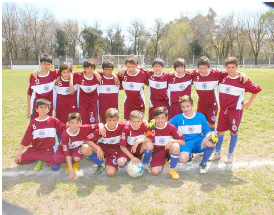
Novena División de Deportivo San Agustín.