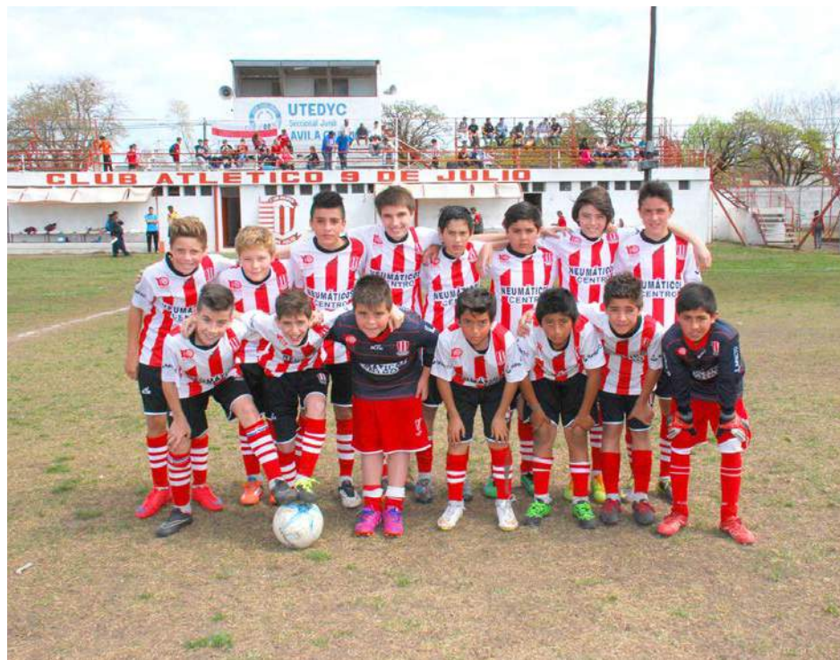
Novena División de Atlético 9 de Julio.