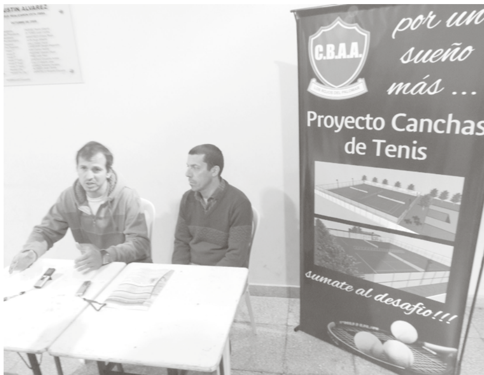
Se presentó el banner que identifica el importante proyecto deportivo.