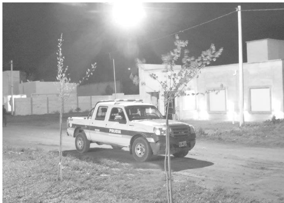
Personal policial trabajó instantes después en el lugar del hecho delictivo.