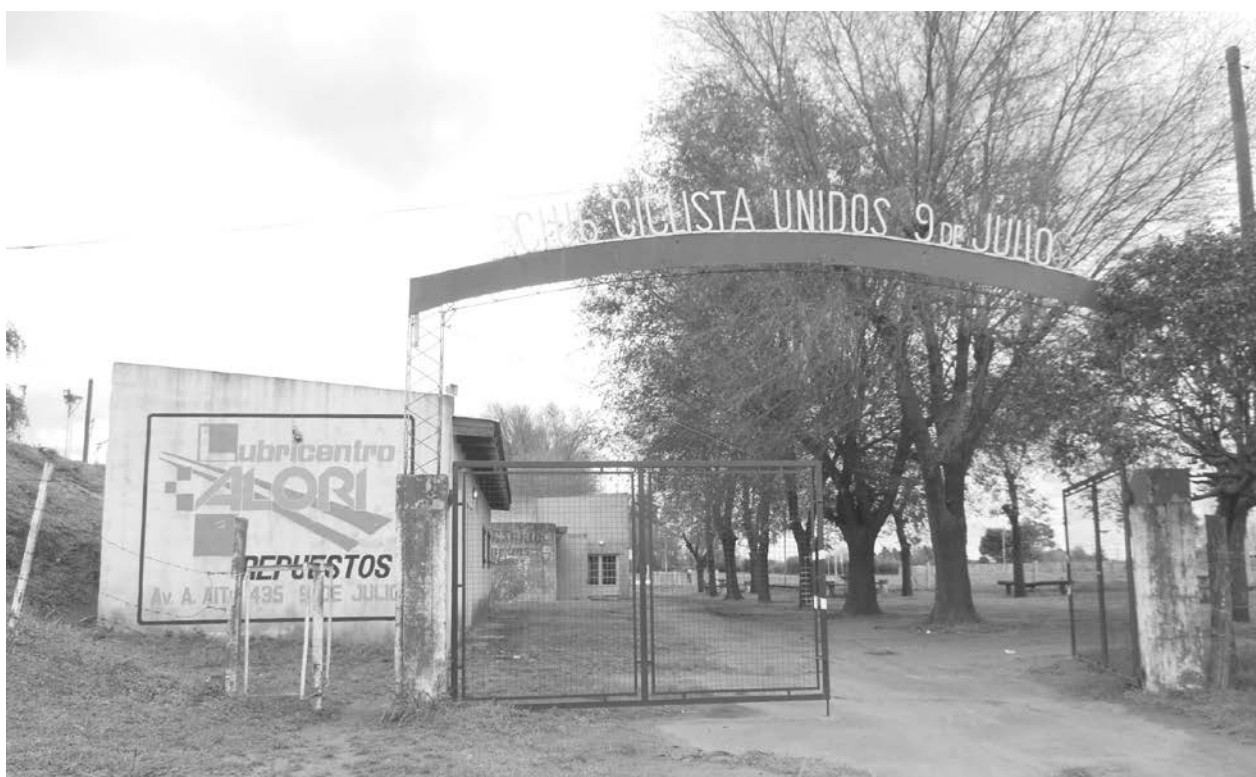
Nuevamente el Club Ciclistas Unidos es objeto de robo y destrozos en sus instalaciones.