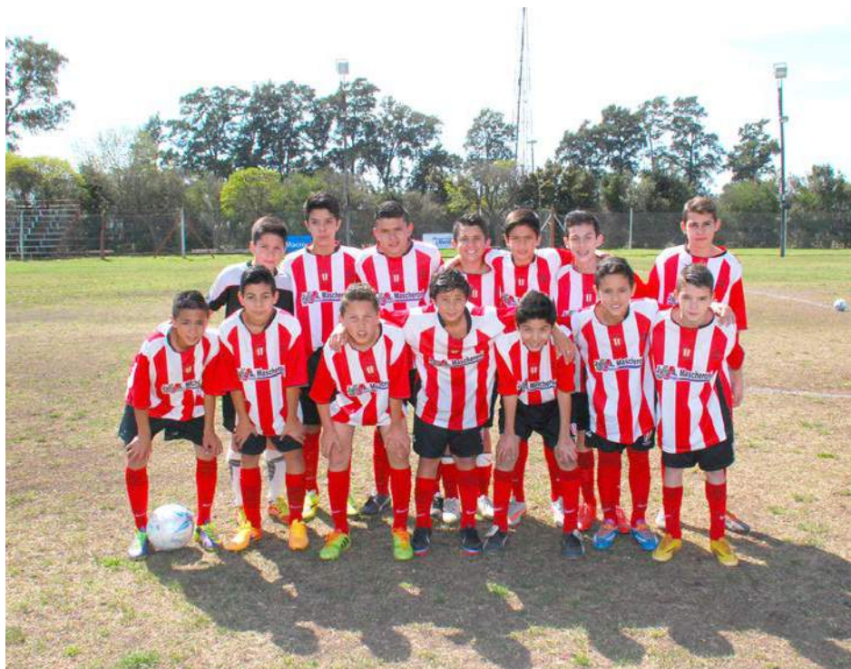
Octava División de Atlético 9 de Julio.