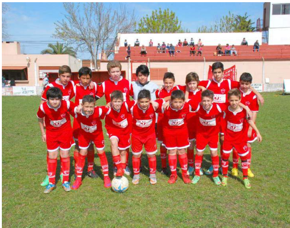
Novena División de Agustín Alvarez.