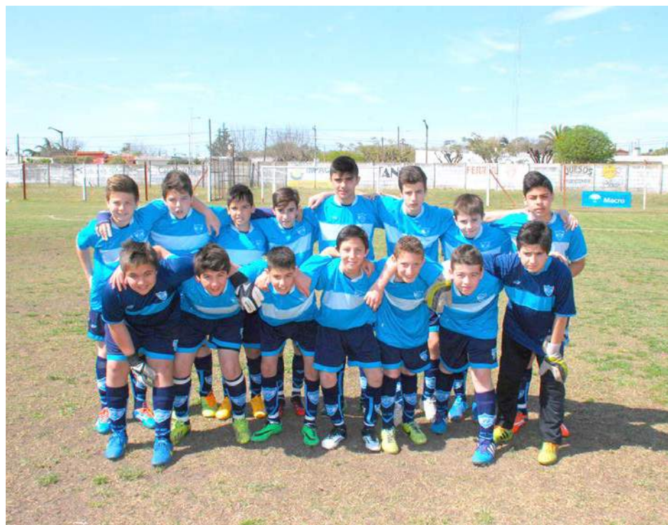
Octava División de Atlético San Martín.