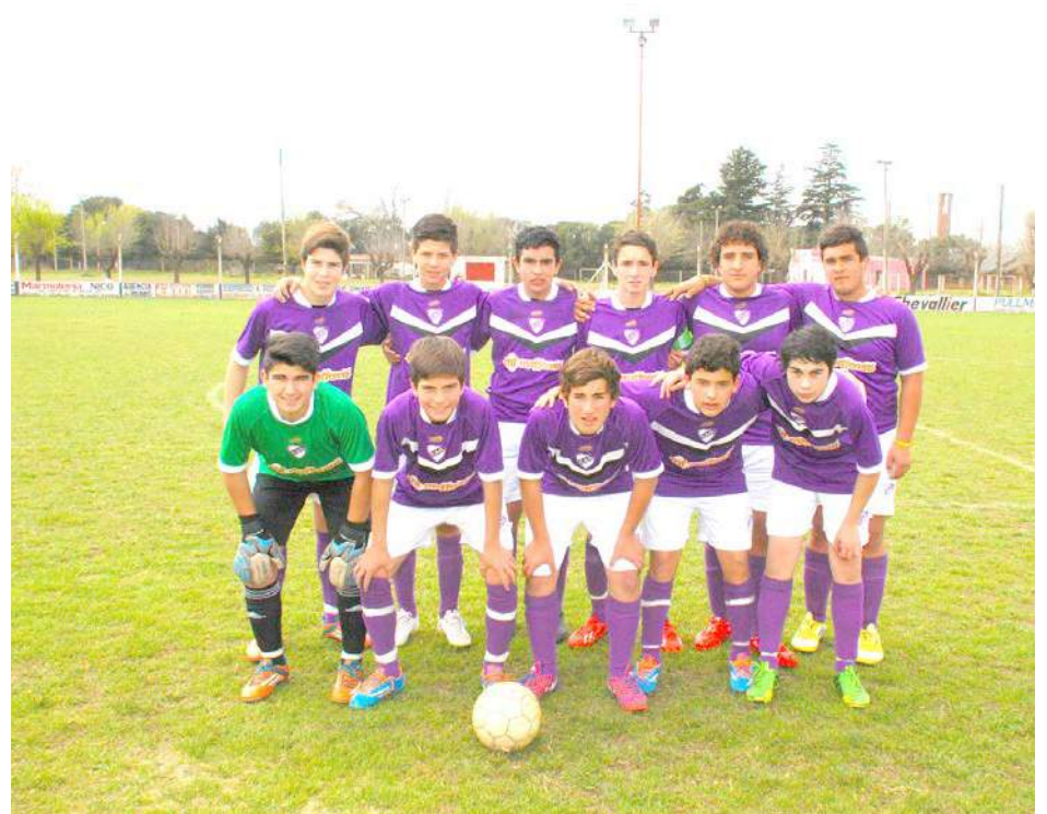
Sexta División de Quiroga.