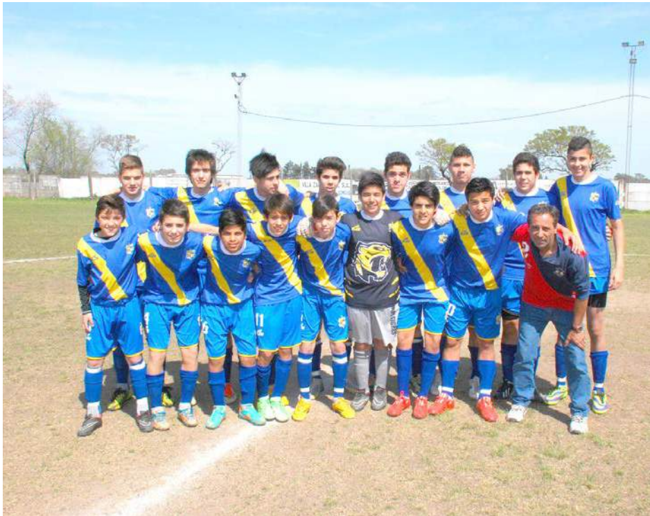
Sexta División de Once Tigres.