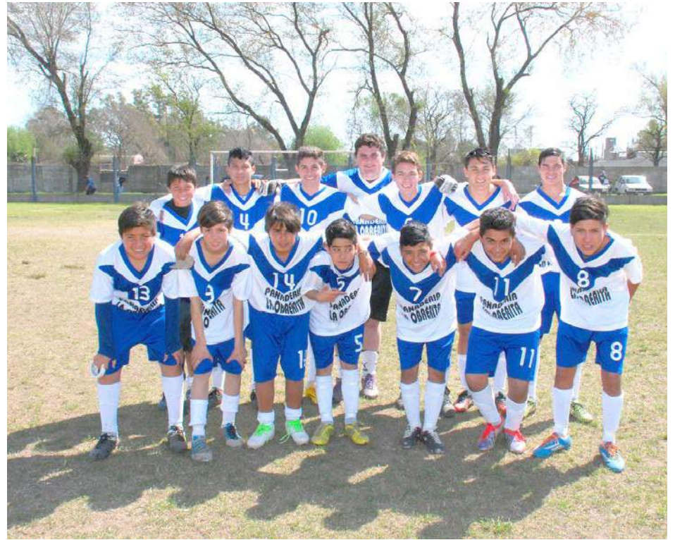
Sexta División de El Fortín.