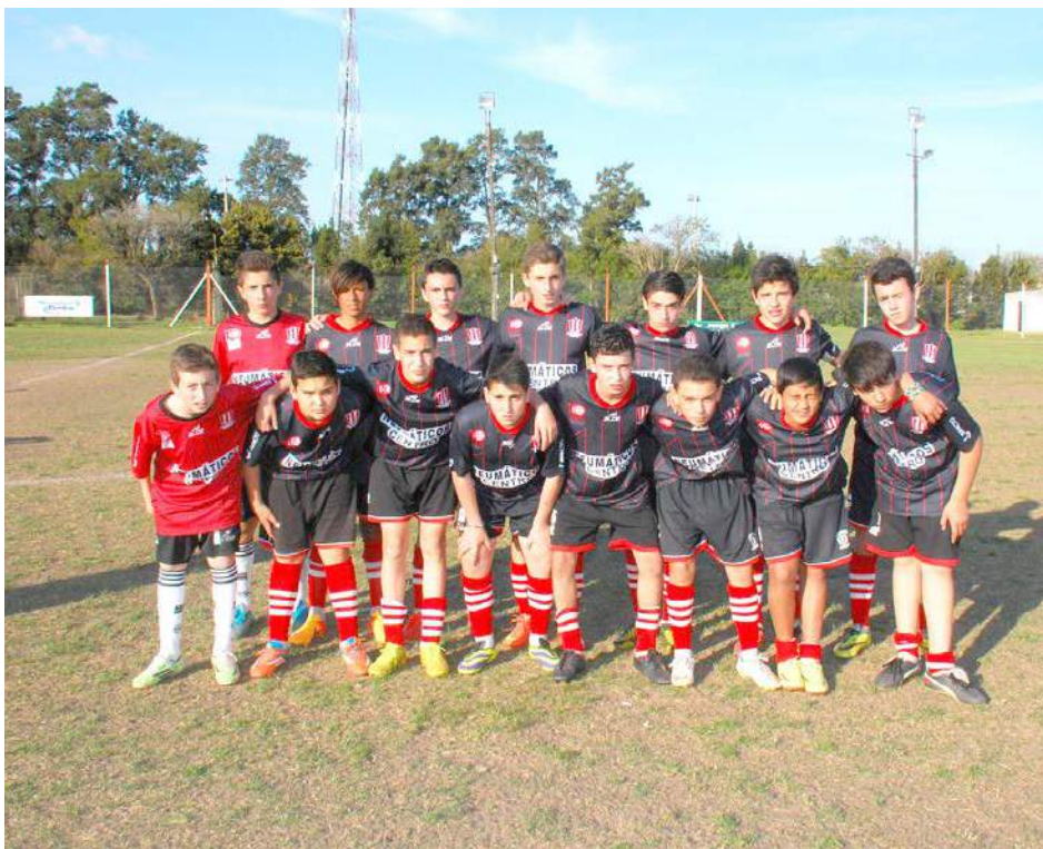
Séptima División de Atlético 9 de Julio.