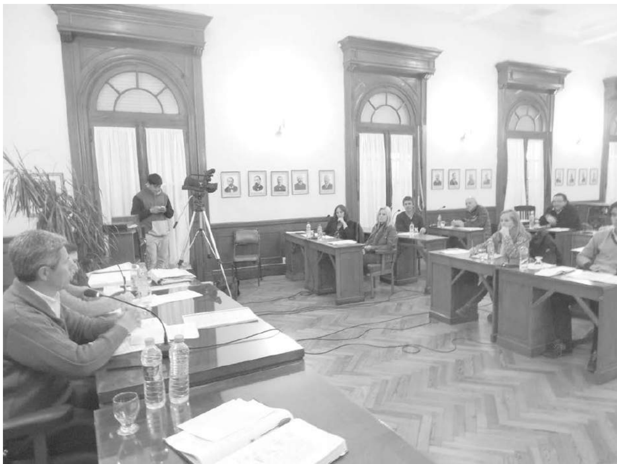
Tras la sesión preparatoria del día martes se realiza hoy la de Mayores Contribuyentes.