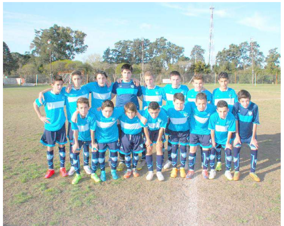
Séptima División de Atlético San Martín.