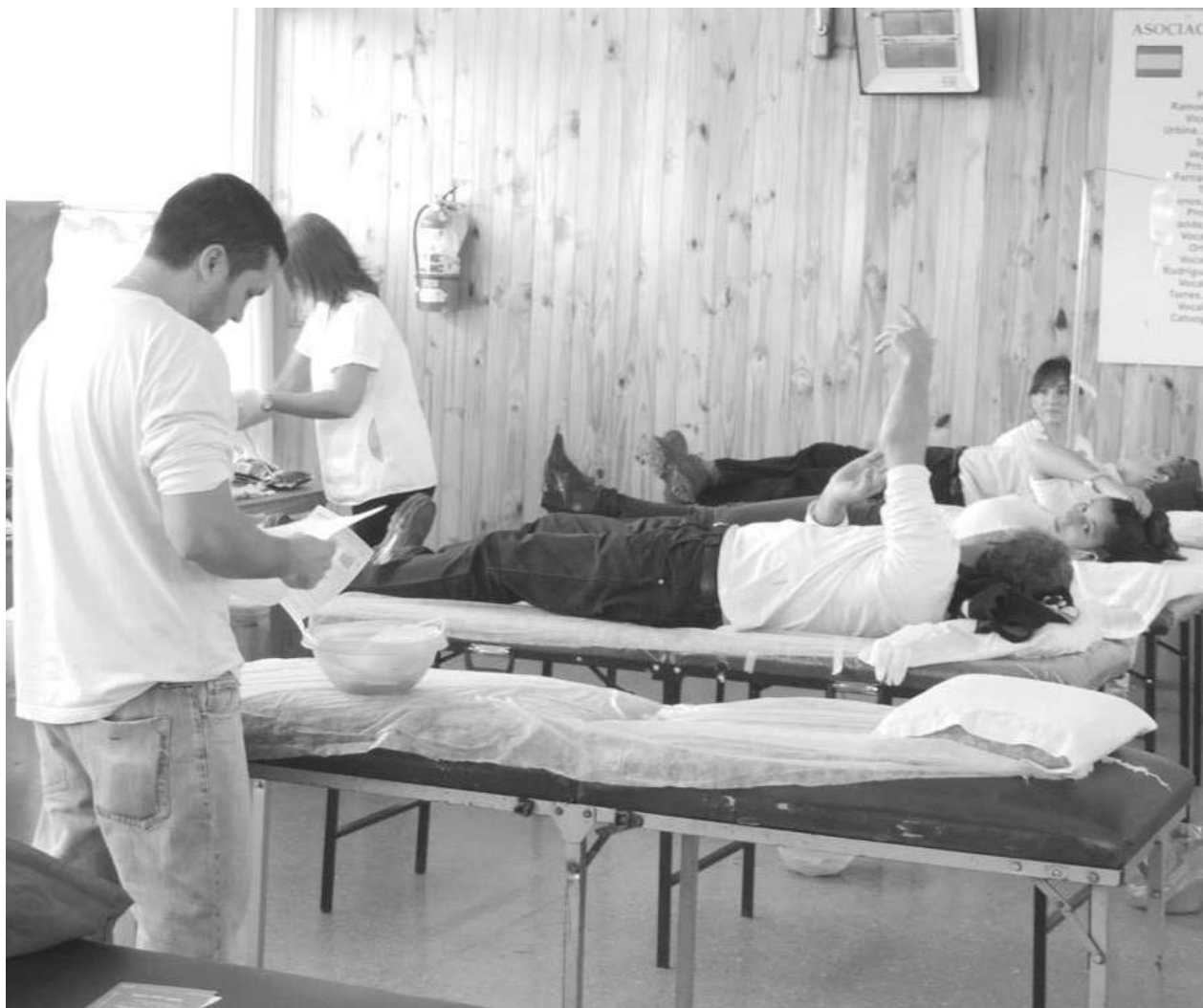
Pasaje de la colecta realizada ayer en las instalaciones de la Asociación Española.