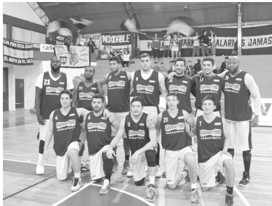
Plantel de Argentinos de Junín con sus figuras extranjeras.