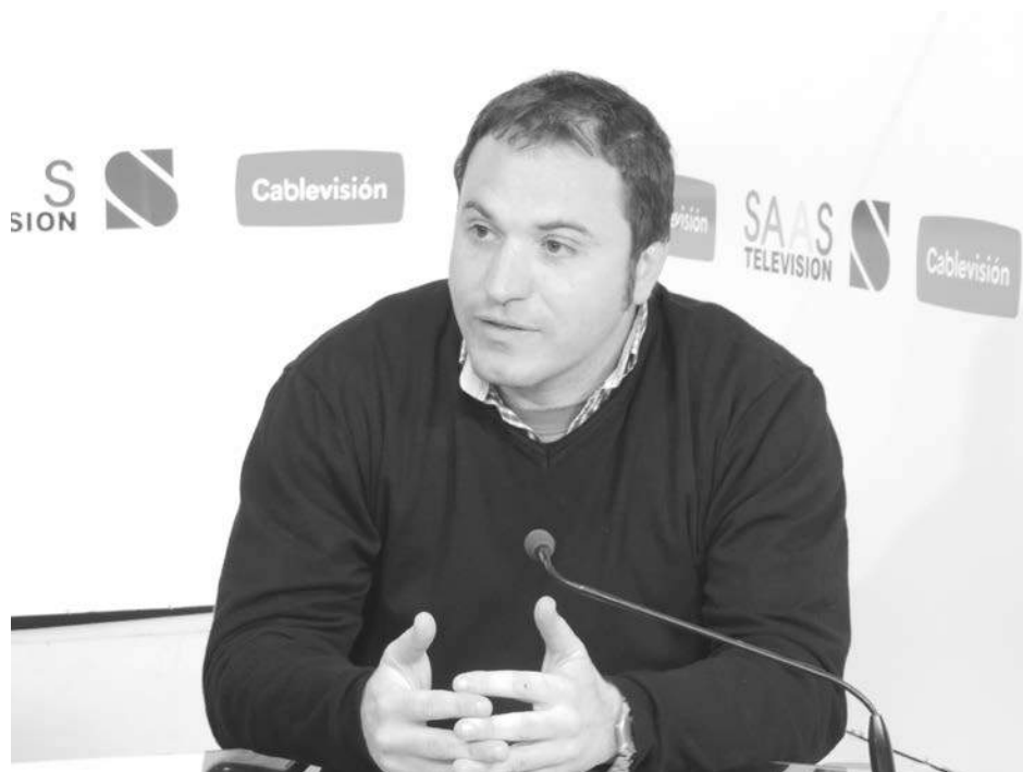
Banchemo analizó la denuncia contra Niembro y Macri.

En tanto, sostuvo que el FPV, “está muy conforme con todos los logros que