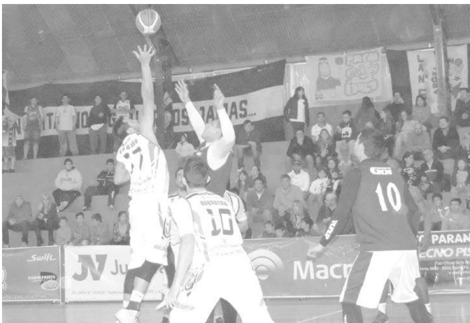
Una vez más se vió basquet de primer nivel en Atlético 9 de Julio.