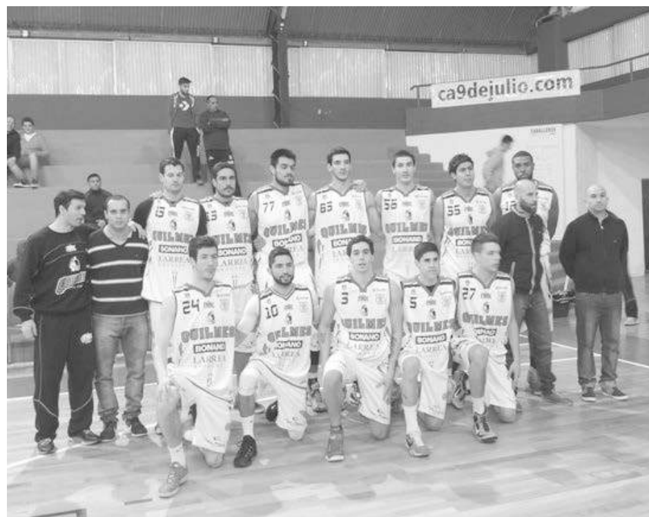
El conjunto marplatense se impuso al final por solamente un tanto, 84 a 83.