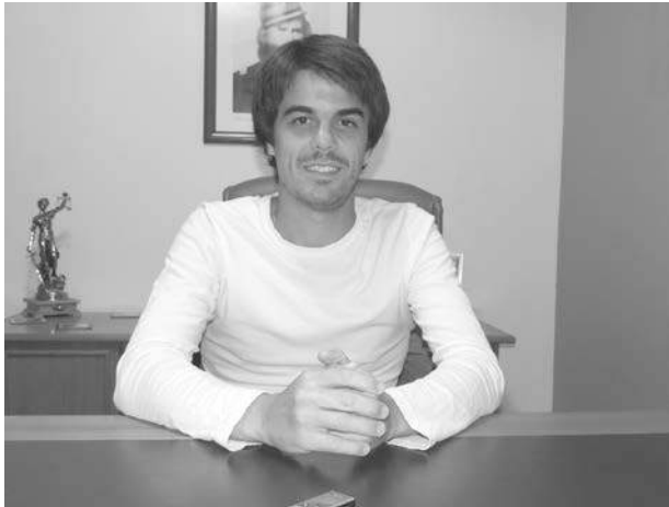
El edil salió en defensa del periodista cuestionado.

“Esta renuncia es una buena medida, ya que Niembro deja de ser ahora un candidato político, quien se pone a disposición de lo que de-