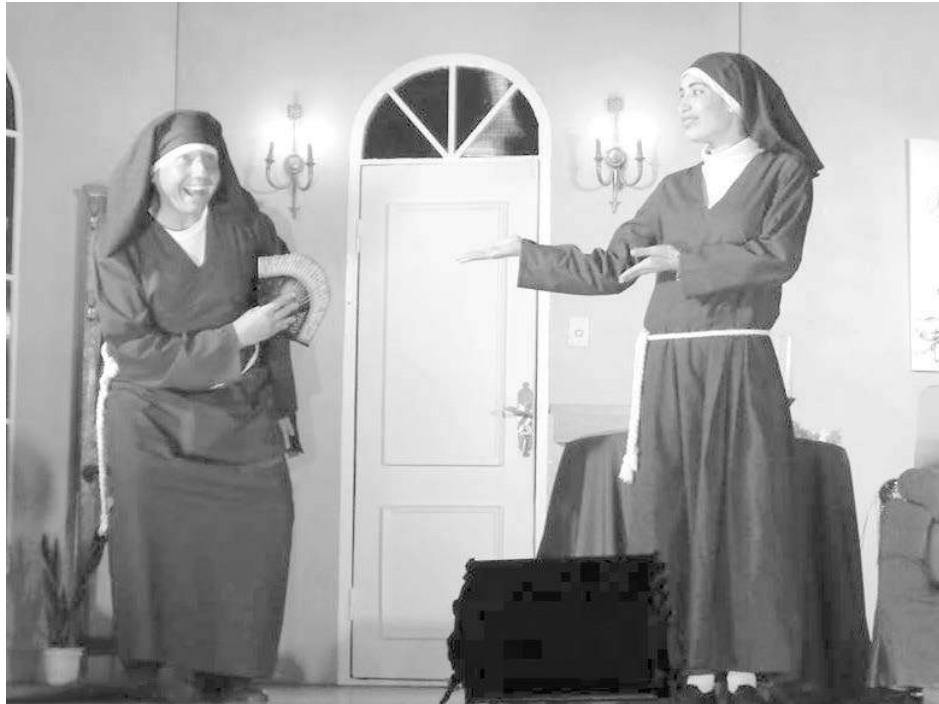
Finaliza hoy la reidera comedia "Vamos a contar mentiras".

En tanto, esta noche culmina su temporada "Agosto a Todo Teatro".