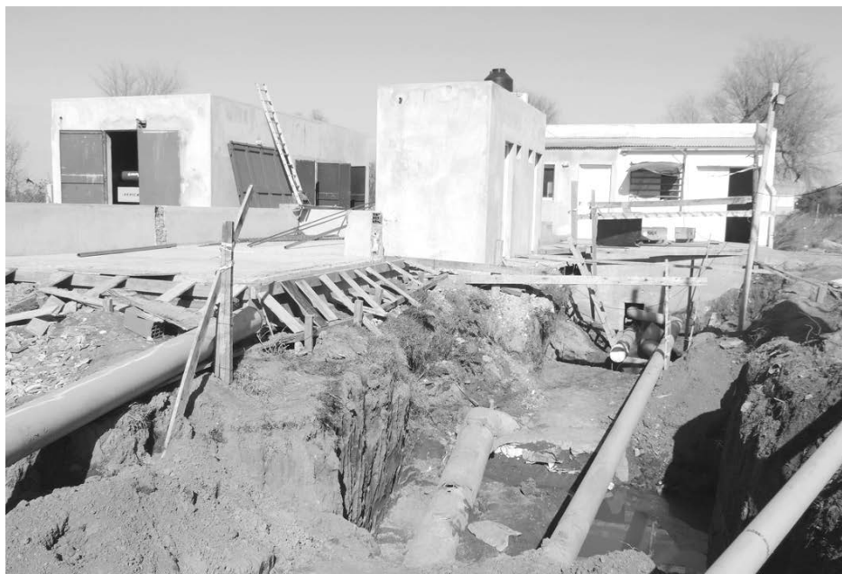
Vista de los trabajos de entubado que lleva adelante la empresa.

También destacó el rol de la Defensoría del Pueblo, "que permitió, ante la vulneración de los derechos del vecino; abrir las puertas de los ministerios necesarios para que la obra se ejecute".