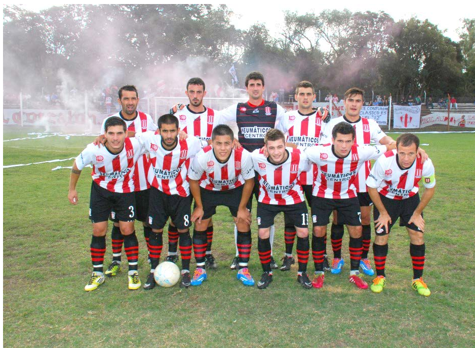
Atlético 9 de Julio.

Se destaca el clásico entre Libertad y Atl. 9 de Julio.