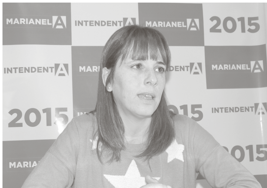
La edil fue muy crítica con el Intendente y el concejal.

"No hubo grandes sorpresas en las PASO", señaló la concejal de GEN, marcando que "si bien se esperaba una fuerte polarización entre Cambiemos y el FPV al poseer internas, mientras que otros sectores como el nuestro no tenían internas; se dio un importante caudal