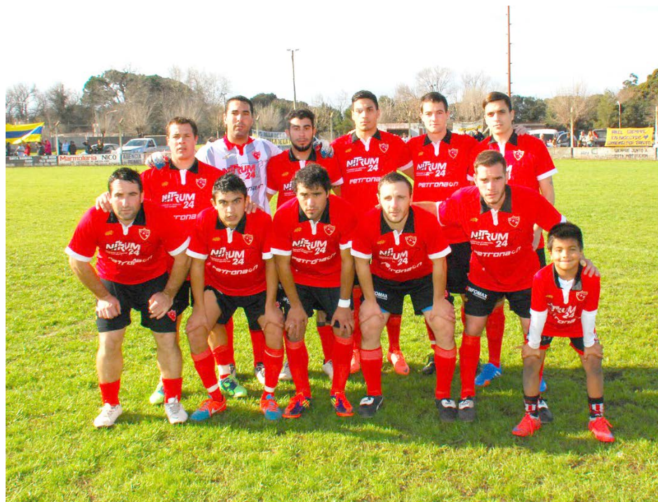
Equipo de Naón.

La tercera fecha del Ascenso 2015 se jugará repartida. Tres partidos irán el sábado y uno el día domingo, siempre en el horario de las 15,30 hs. El día sábado, en la localidad de El Provincial, 18 de Octubre recibirá a Defensores de la Boca; mientras que en su pueblo, Atl. Patricios hará lo propio ante Atl. Naón; en tanto que 12 de Octubre recibirá a Defensores de Sarmiento. Finalmente, luego de una goleada ante Atlético Patricios, el domingo, El Fortín recibirá a Compañía Gral. Buenos Aires.