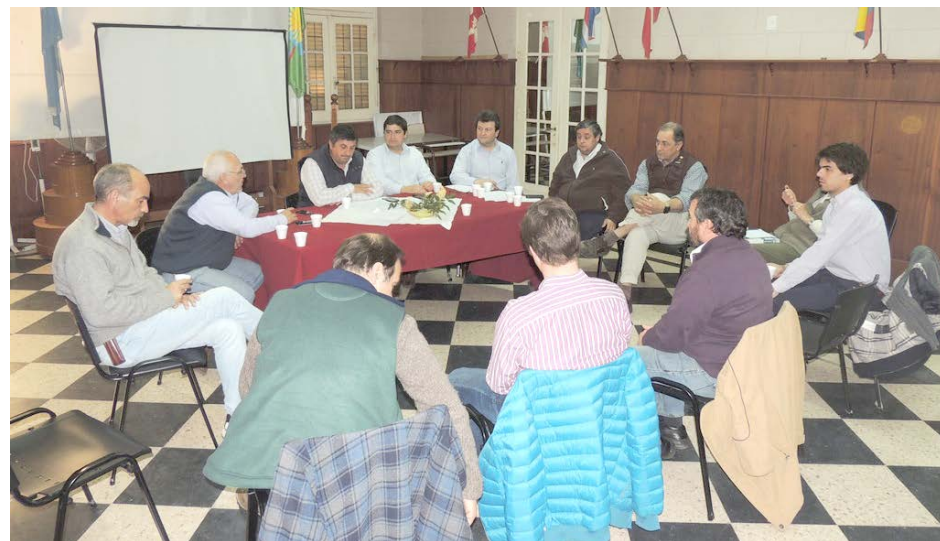
Nueva reunión de la mesa agropecuaria realizada ayer.