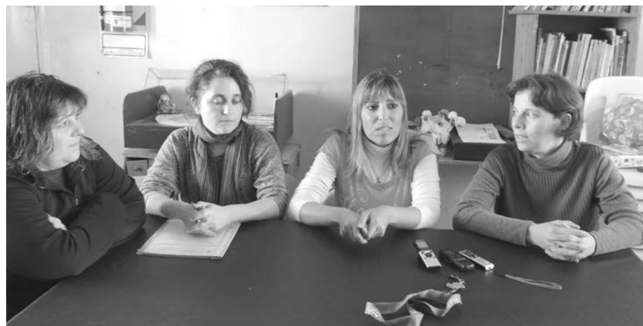
En conferencia de prensa se dieron detalles del importante proyecto que se realiza con los chicos.

"Queremos rescatar los juegos tradicionales y sacar un poco a los chicos de las pantallas a través de estas experiencias, que después de haberse iniciado en las veredas, trasladamos ahora a las escuelas y sus patios", relató la artista plástica.