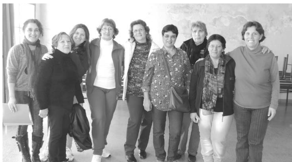
Integrantes de El Hogar junto al grupo de yoga.