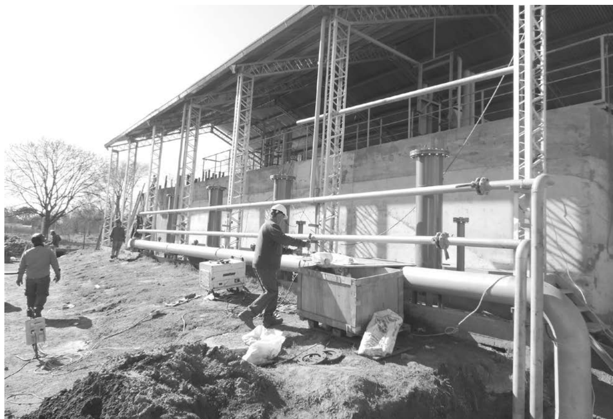
Buen ritmo de obra lleva la planta tan esperada por la comunidad.