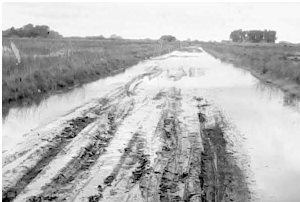
Uno de los accesos a Patricios totalmente anegado por el agua.

LA CAUSA SE HABÍA INICIADO EN EL AÑO 2014