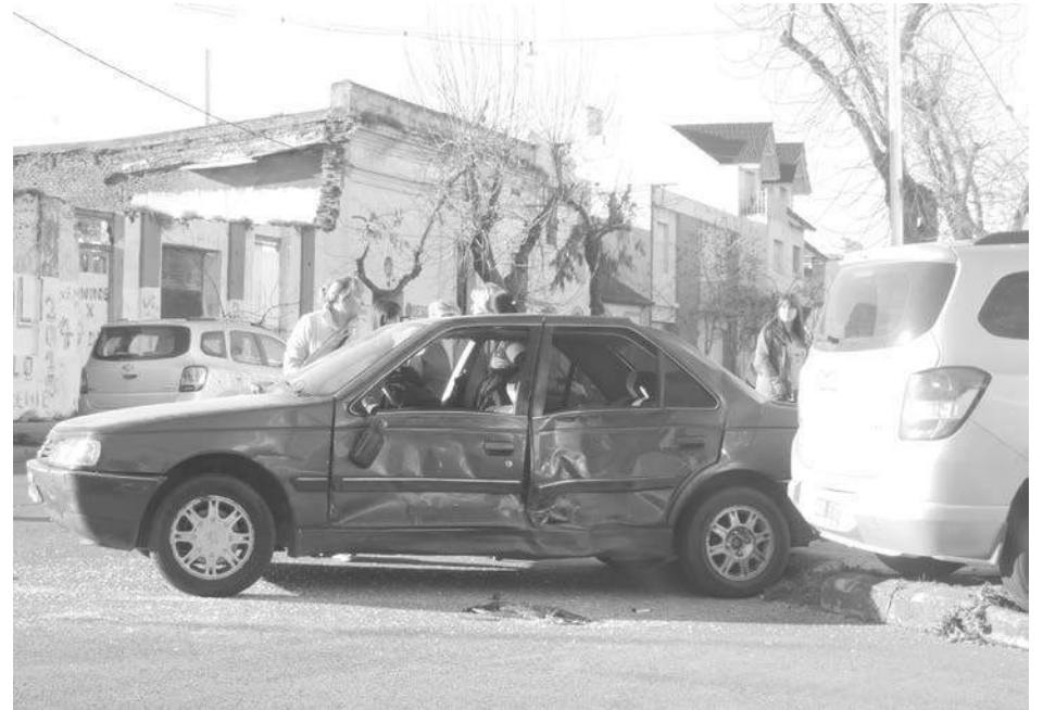
El Peugeot 405 muestra las huellas del fuerte impacto en su lateral izquierdo.

para festejar justamente el "Día del Amigo". Al intentar atravesar la calle Libertad fue embestida por la camioneta Spin, quedando los dos rodados sobre la vereda del ex Supermercado San Cayetano.