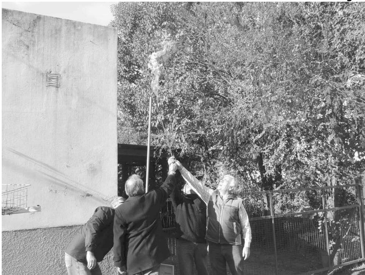
Simbólicamente se realizó el encendido de la llama en el sector habilitado.