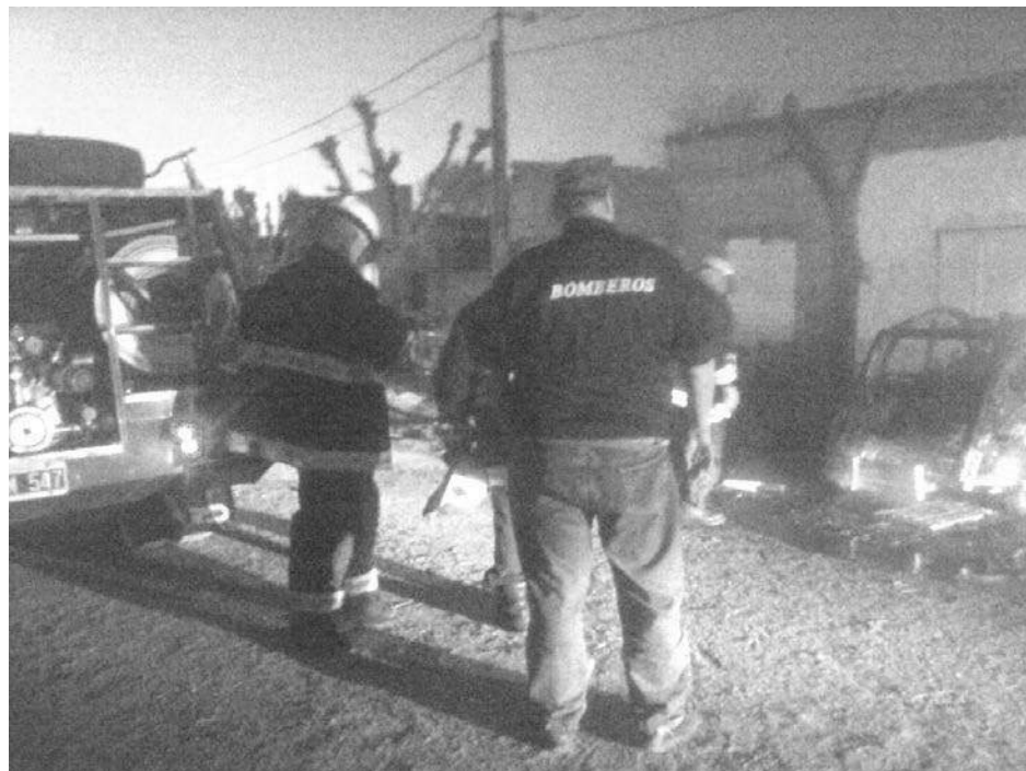
Una dotación de Bomberos Voluntarios sofocó el incendio de la unidad en la que se observan los daños producidos.

En la tarde de ayer, aproximadamente a las 18:30 hs., fueron convocados los Bomberos Voluntarios de nuestra ciudad para sofocar el incendio declarado en un automóvil marca Citroën 3 CV, que se encontraba estacionado en calle French 685, frente al edificio del CIC (Centro Integrador Comunitario) "Martín Callegaro).