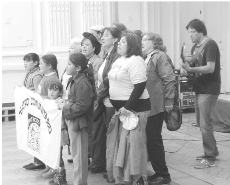
El grupo de Teatro Comunitario Patricio Unido de Pie.