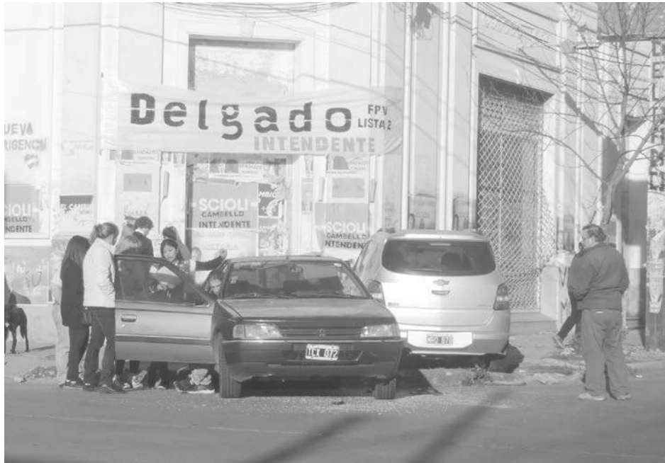
Los dos vehículos quedaron detenidos sobre la vereda.

Poco después de las 16 hs. dos vehículos colisionaron en el centro de nuestra ciudad. No hubo heridos de gravedad.