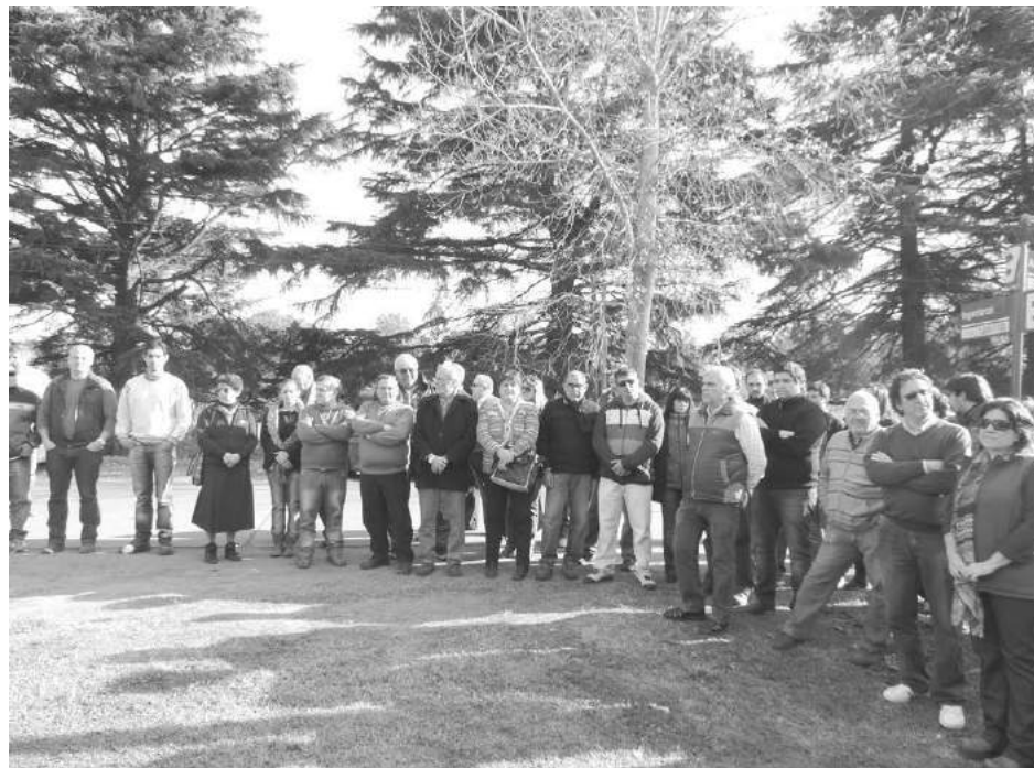
Autoridades municipales y de la CEyS, y vecinos que asistieron al acto.

ca y de Servicios Mariano Moreno y abarcan el sector comprendido por las calles Alte. Brown, Juan José Paso, Guido Spano y Ruta Nacional N°5, sobre un total de 5.800 metros, y fueron ejecutadas en un plazo de aproximadamente tres meses. En la esquina de Alte. Brown y José Ingenie-