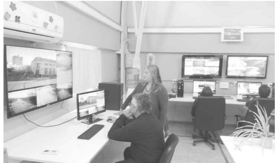
Sala de monitoreo que funciona en la cúpula del municipio.