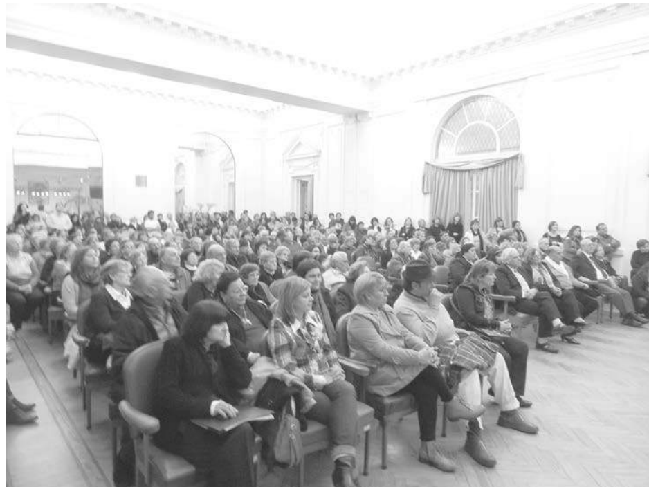
Asistentes al cierre de los festejos en el Salón Blanco municipal.