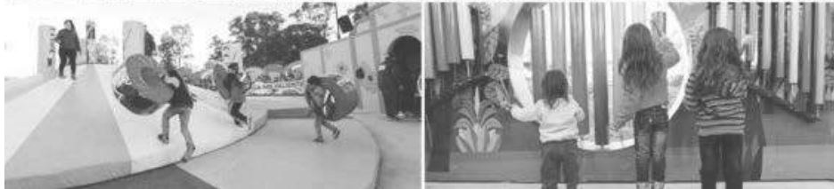
Los niños colmaron la feria de ciencia y tecnología durante el primer fin de semana de vacaciones de invierno en la Ciudad.

Dinosaurios, siempre cautivadores del asombro de los pibes. El ARSAT-1, un espacio interactivo dedicado al primer satélite de telecomunicaciones que la Argentina puso en órbita. Toboganes gigantes y simuladores de montañas rusas que hacen fluir la adrenalina. Todo esto más el Asombroso Show de Zamba en la Plaza de las Bandera de Tecnópolis reunieron a cientos de miles de personas que ayer, y durante todo el fin de semana, visitaron el parque batiendo un nuevo récord de visitas: 251 mil asistentes, desde el jueves hasta ayer.