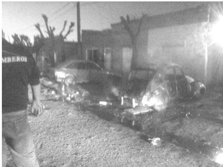
El Citroën 3 CV totalmente destruido por las llamas.