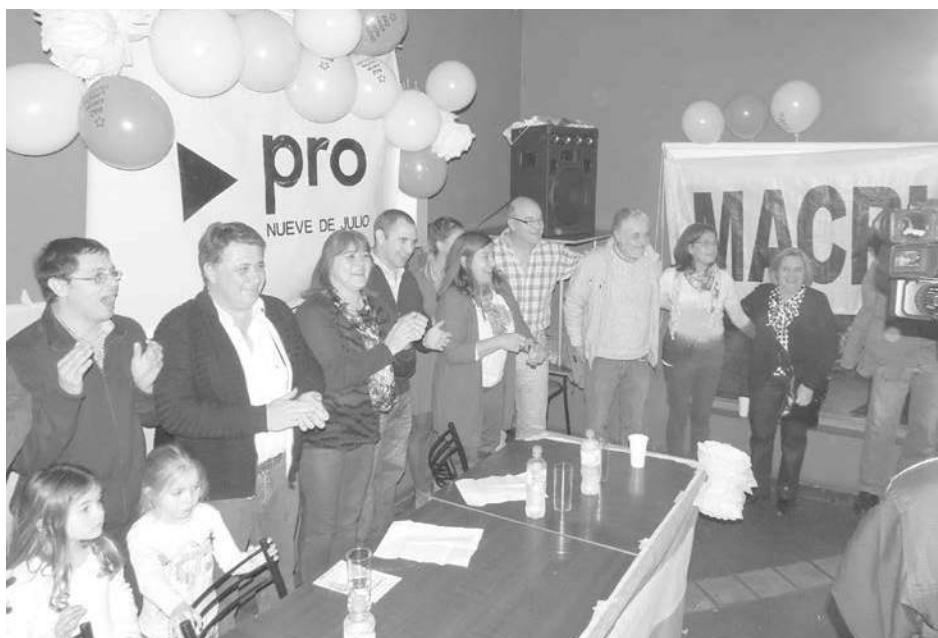
Los precandidatos se presentaron en la noche del jueves.

un buen equipo de trabajo, el que sin dudas hemos conseguido". "Han pasado años de esfuerzo, trabajo y preparación para cumplir el objetivo de lograr un cambio en la manera de hacer política. Hemos tenido en el Concejo Deliberante aciertos y errores, pero lo más importante