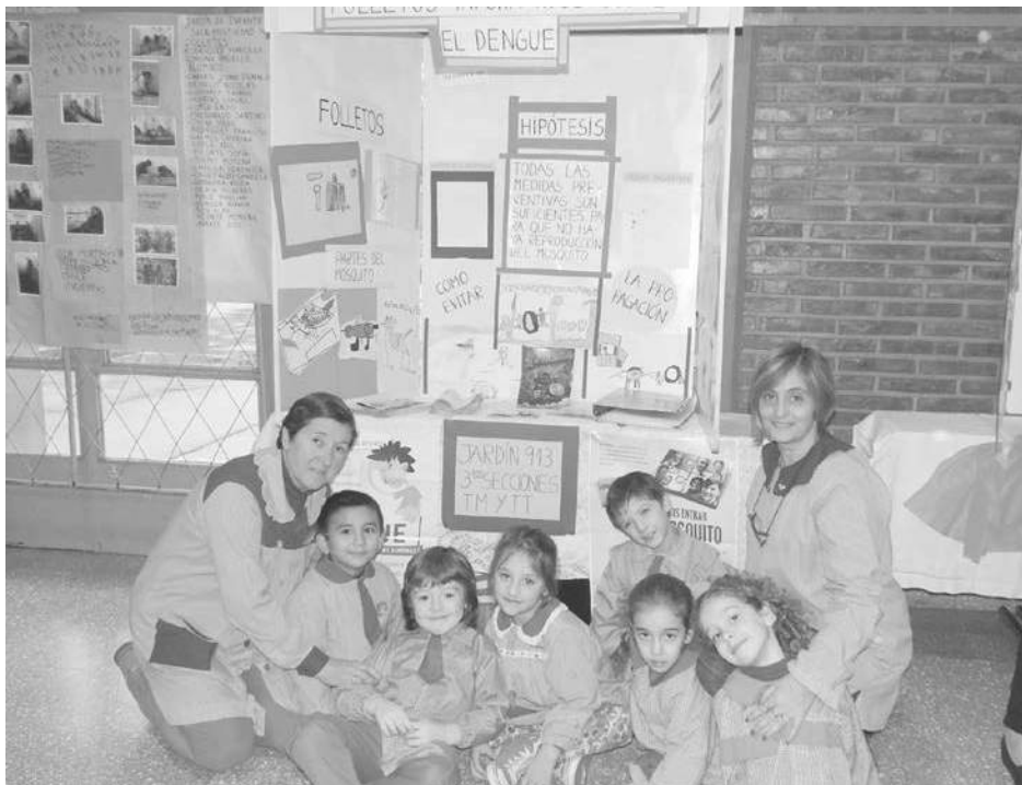
Alumnos de la Sala de 5 del Jardín 913 presentaron un stand sobre el dengue.

"Estos son espacios de encuentro, reflexión e in-