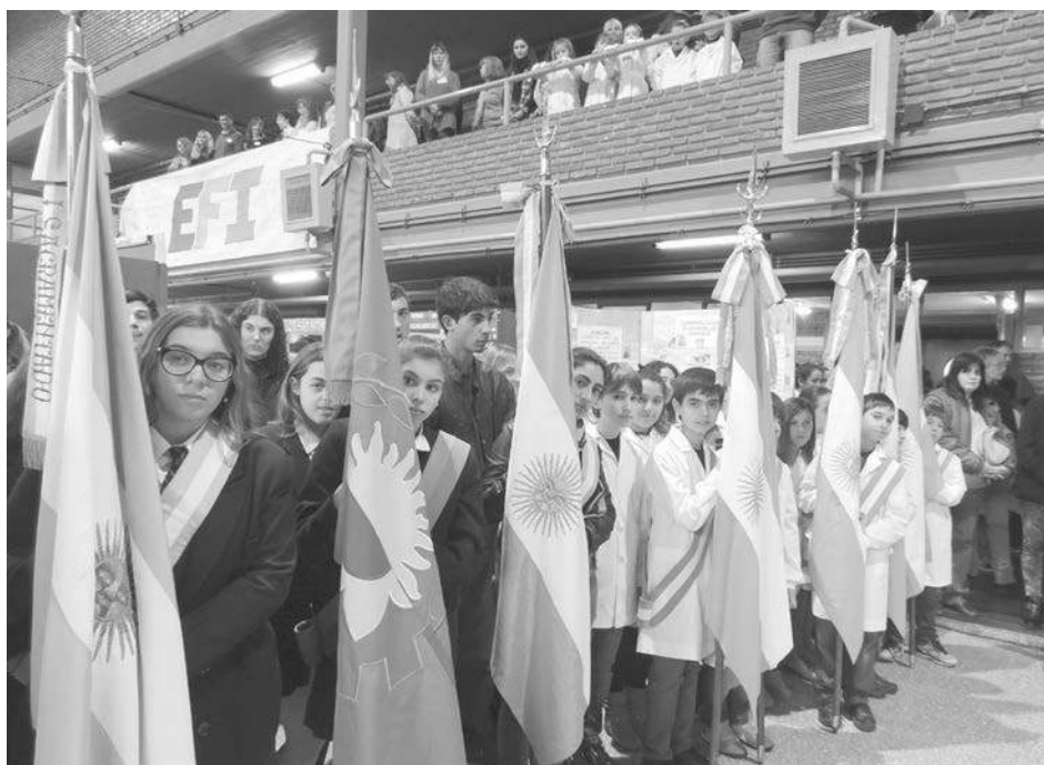
Alumnos de distintos establecimientos educativos con sus banderas de ceremonias.