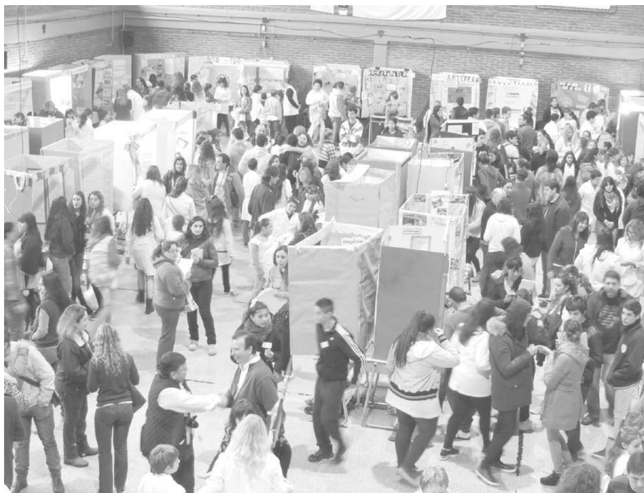
Vista de la 6ta. Feria de Ciencias realizada en la jornada de ayer en el SUM de la E.E.T. Nro. 2.