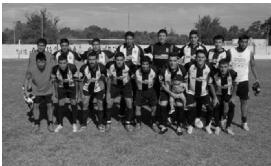
Atl. La Niña.