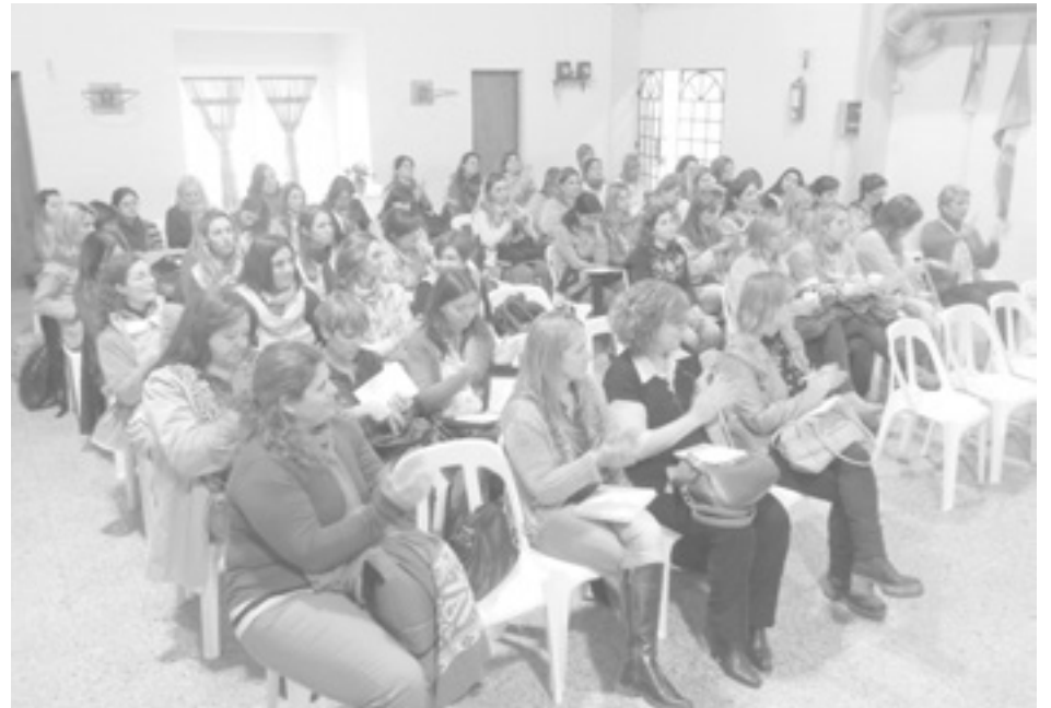
Docentes de una amplia región participaron de la capacitación en nuestra ciudad.