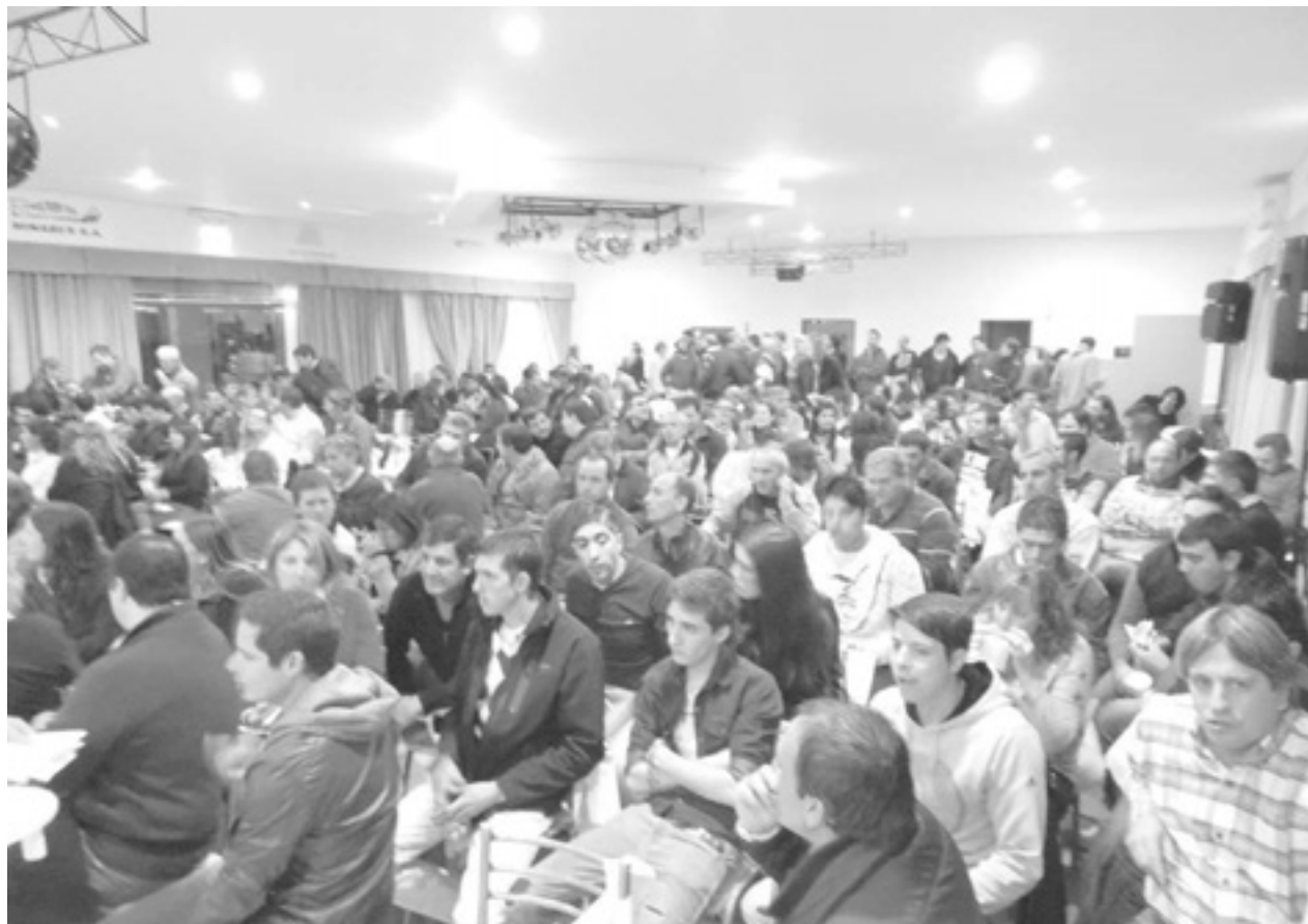
Una importante concurrencia de público acompañó al reconocido deportista.