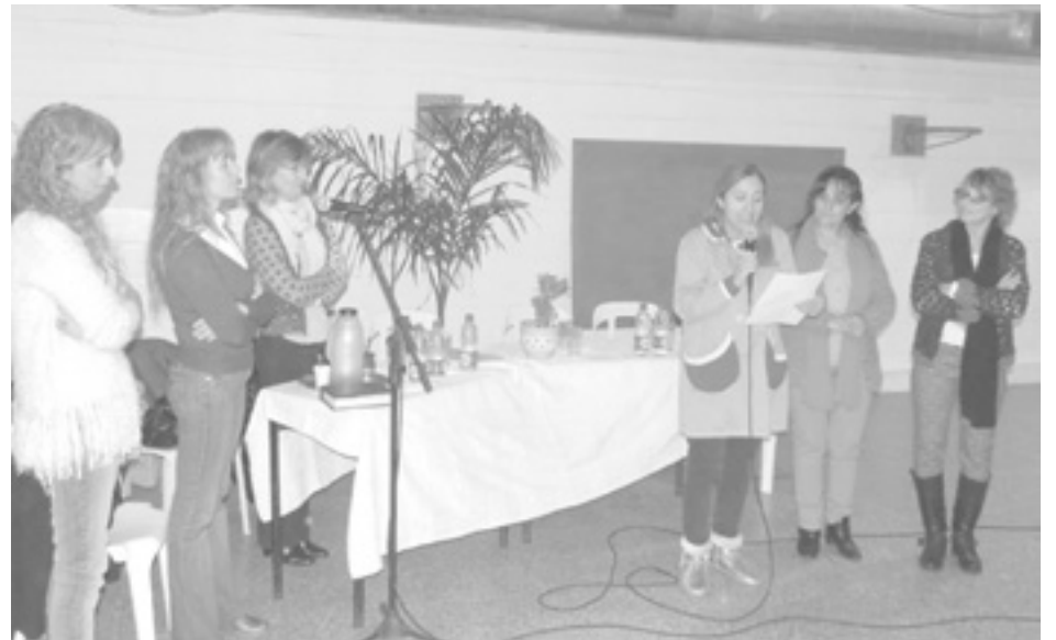
Autoridades educativas provinciales y locales dan la bienvenida en el Jardín Nro. 913.