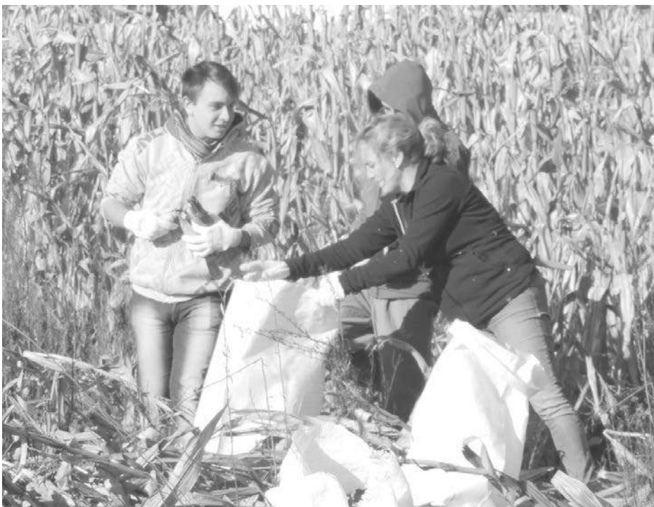
Padres, alumnos y docentes realizan la tradicional cosecha manual.

institución. Es de destacar que la Chocleada nació hace 10 años en la provincia de Córdoba y tiene por objetivo aportar para el combatir del hambre, crear responsabilidad social y generar ayuda económica a instituciones.