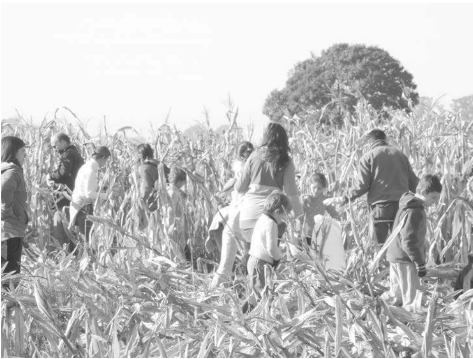
En el predio de La Madrugada se realizó el sábado la chocleada.