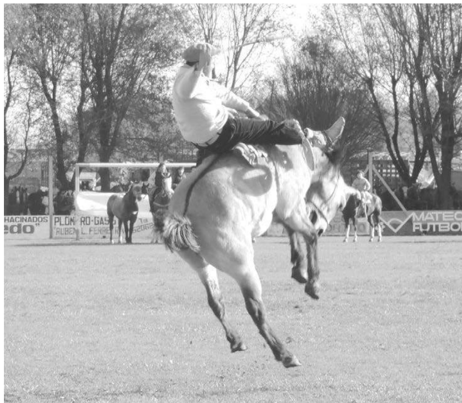
Jinete y animal en el aire, todo un espectáculo campestre.