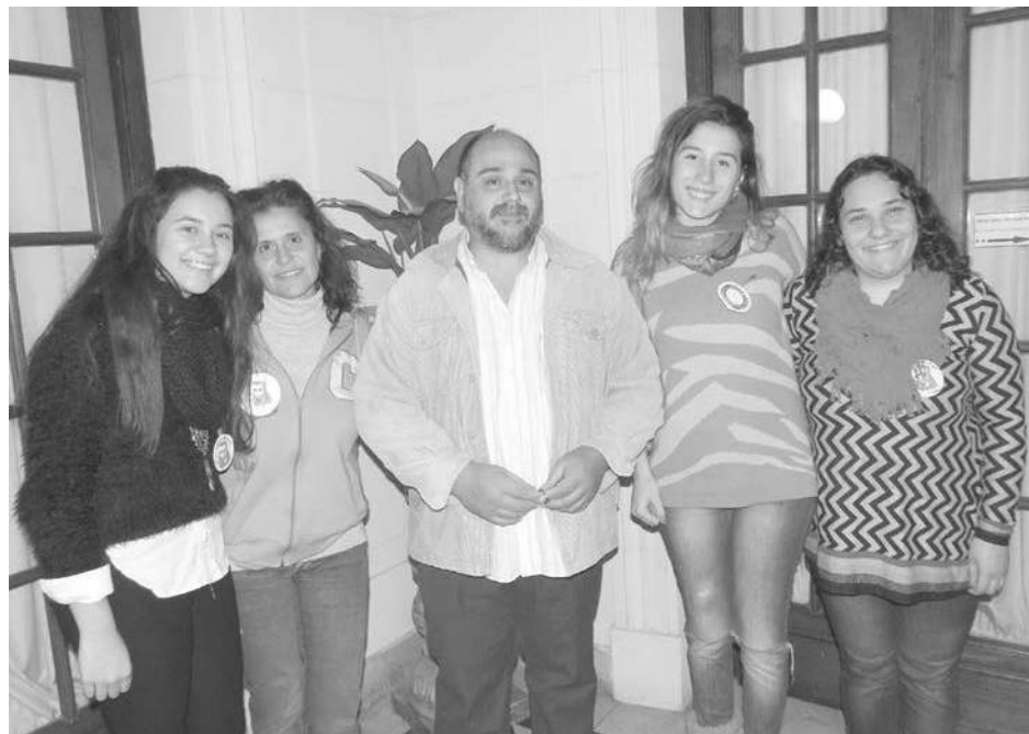
El proyecto presentado en el HCD por alumnos y docentes fue aprobado por unanimidad.