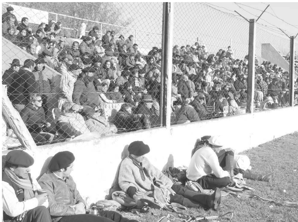
A pesar de la fría jornada del domingo, el público se hizo presente en San Martín.