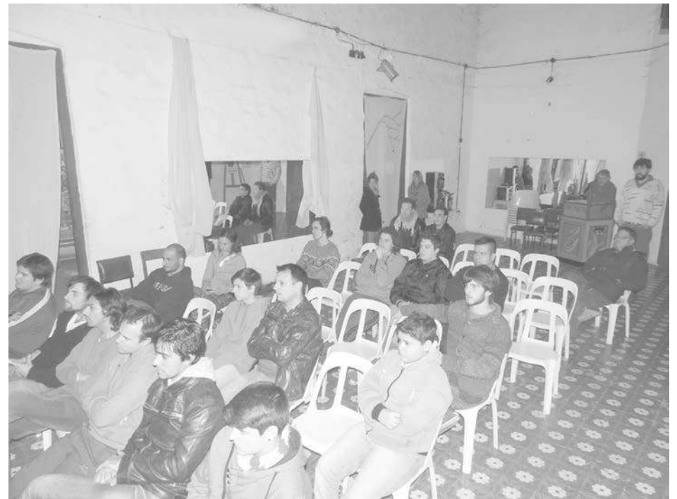
Asistentes a la clínica de batería realizada el pasado sábado.

La Asociación de Tejo de la ciudad de 9 de Julio se hace partícipe de la realización y divulgación de acciones que conciernen al buen trato de los adultos mayores considerando que el mismo es responsabilidad de toda la sociedad. Como institución que promueve el respeto, la igualdad y la consideración de las personas de todas las edades, contribuyendo a un entorno que favorece la movilidad, la seguridad y el confort, es importante destacar que los pequeños gestos producen grandes cambios si buscamos el buen trato para todos.