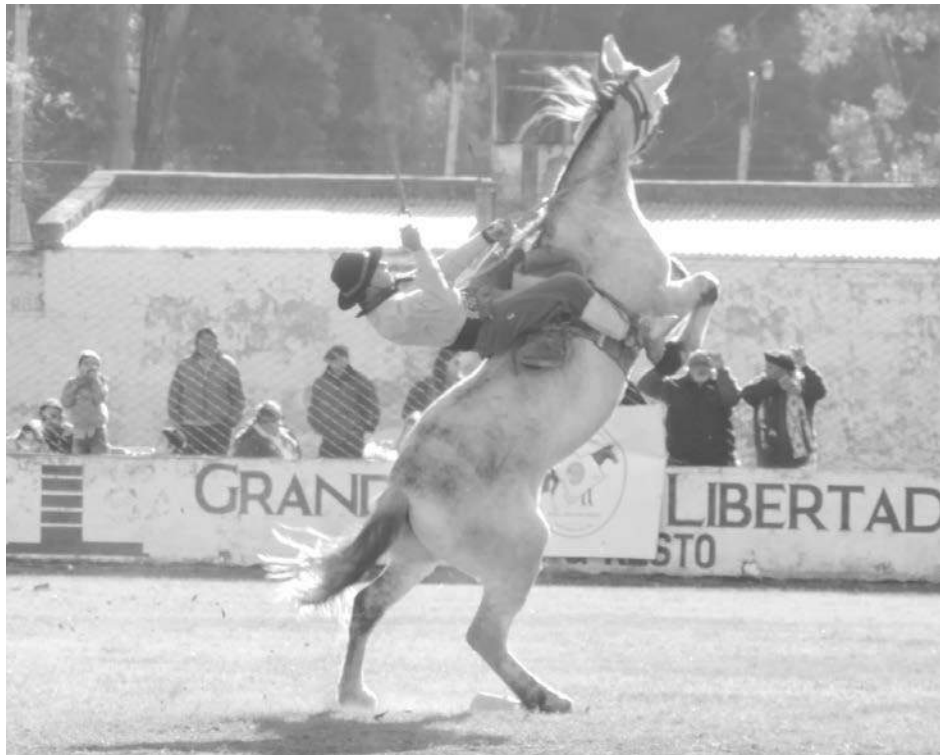
Impactante imagen del caballo totalmente parado sobre sus patas traseras.