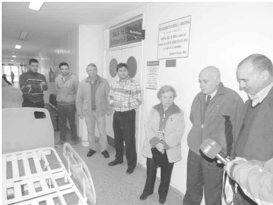
Autoridades del Hospital, del Club de Leones y EET Nro. 2 en el acto de entrega.

Fue entregada al centro de salud una cama ortopédica motorizada construida por alumnos del establecimiento.