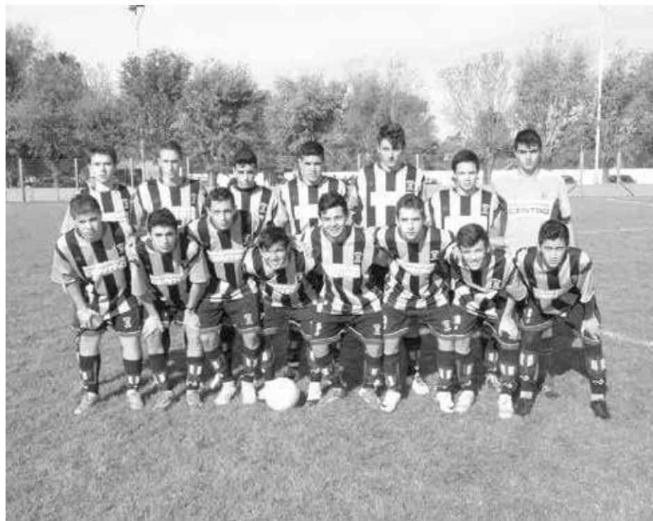
Quinta División de Atlético 9 de Julio.