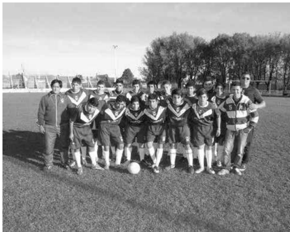
Quinta División de El Fortín.