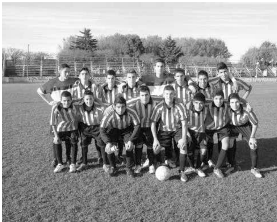
Quinta División de Dudignac.