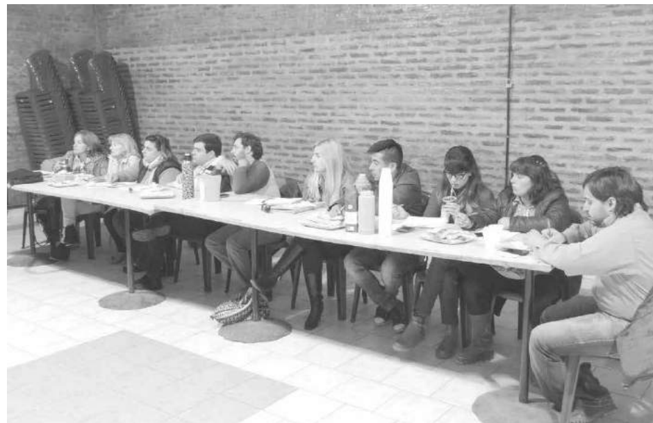
Docentes de la región presentes en nuestra ciudad.

La entidad marcó su alejamiento del paro de ayer y resumió sus acciones en el área de Promoción Social.