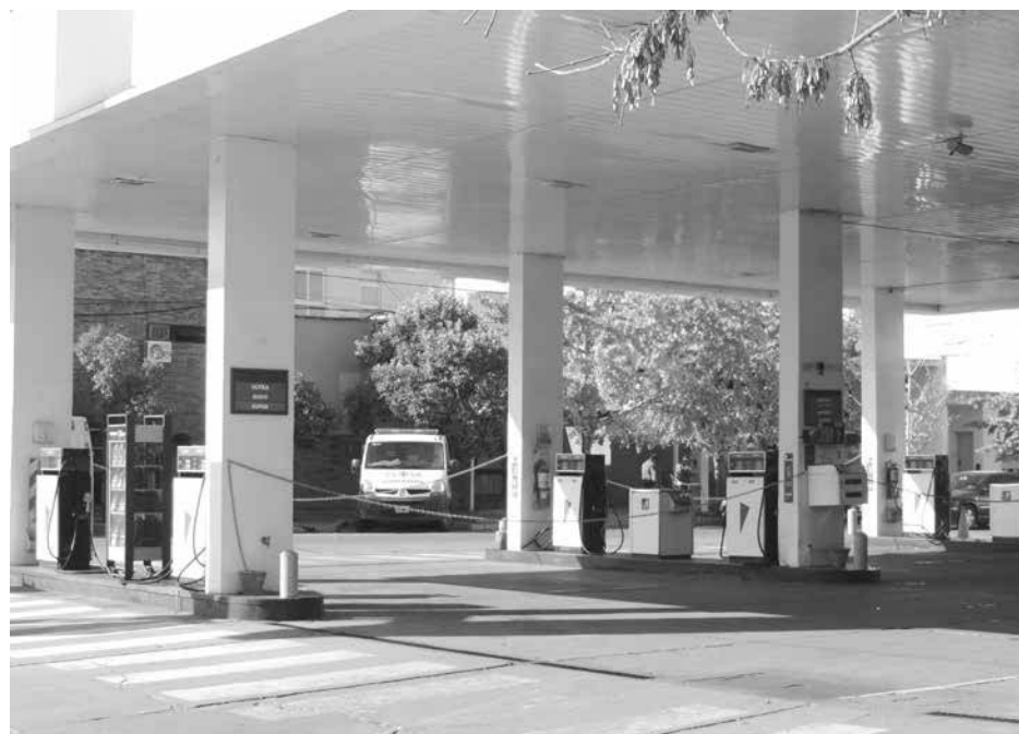
Las estaciones de servicio permanecieron sin despacho de combustible hasta la media tarde del lunes.