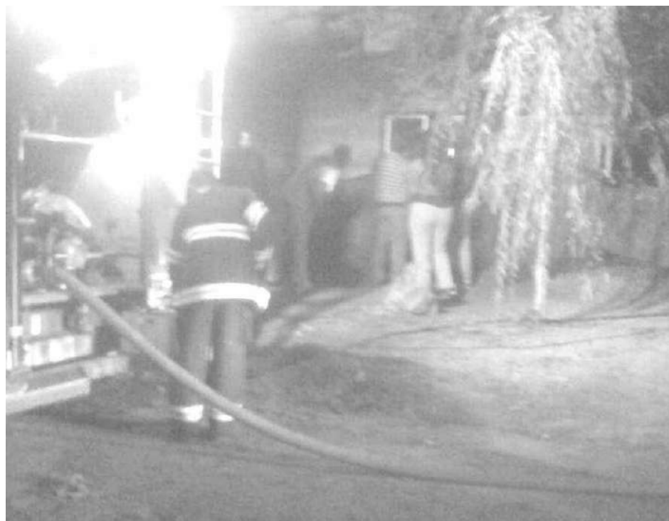
Dos dotaciones de Bomberos trabajaron para sofocar el fuego.

El hecho se relaciona con un caso de violencia de género.