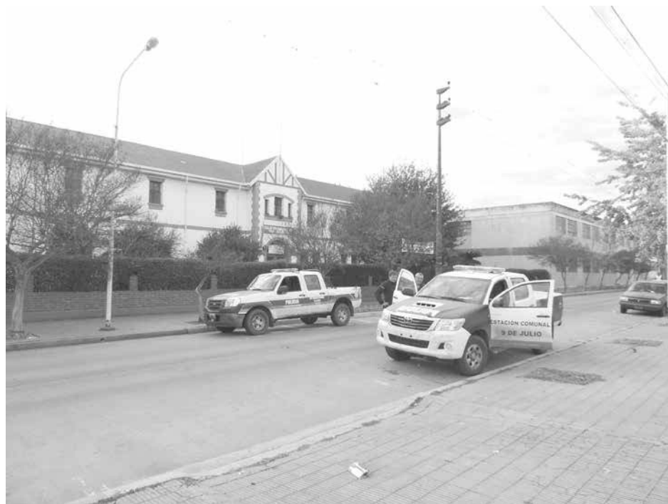
Personal de policía apostado frente al establecimiento educativo.

Poco antes de las 08,00 hs. de la víspera, en el teléfono de la Secretaría del Colegio Marianista San Agustín se recibió un llamado telefónico advirtiendo que dentro del edificio ubicado en calle Edi-