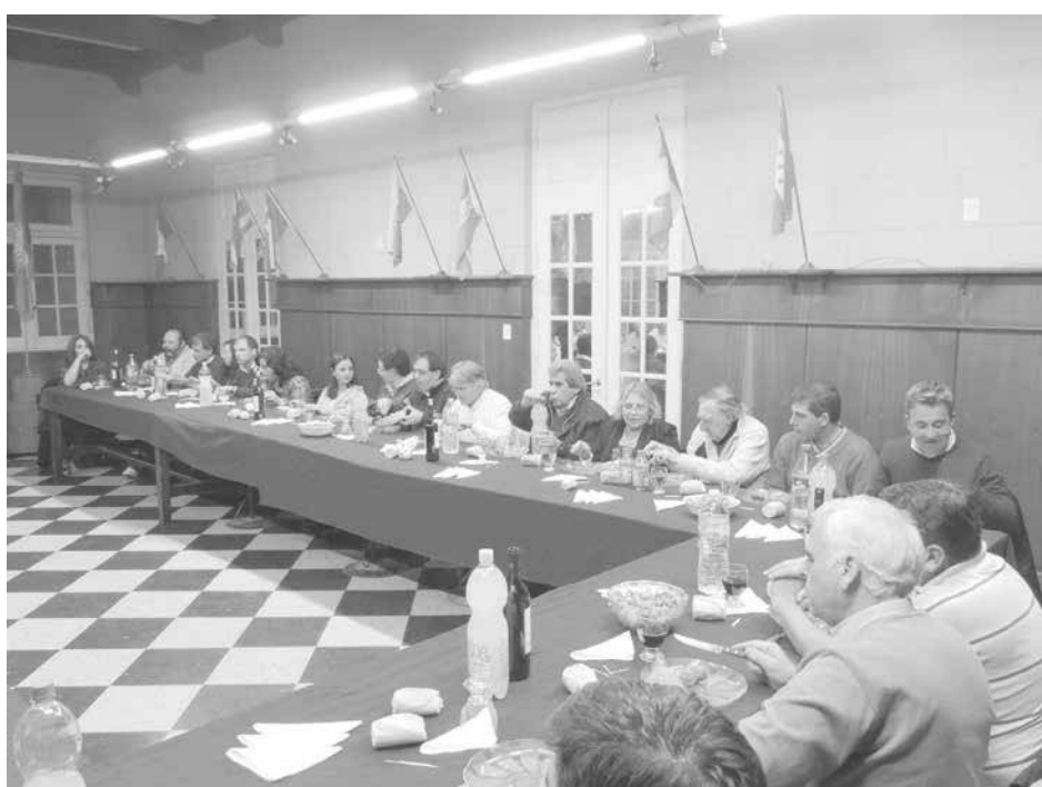
Responsables y periodistas de distintos medios participaron del encuentro.