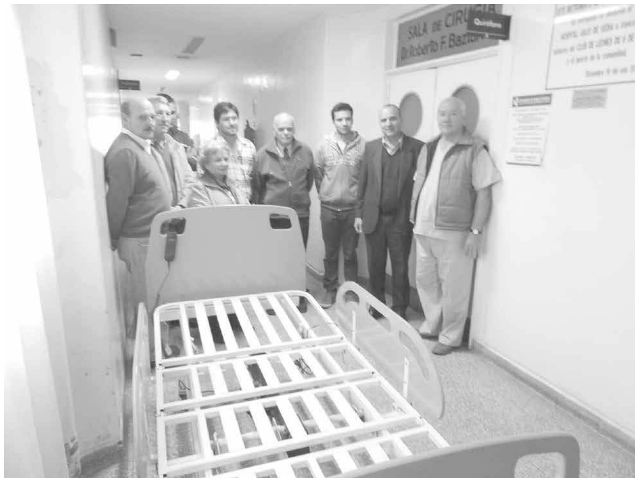
La cama ortopédica donada junto a las autoridades.

Fue entregada al centro de salud una cama ortopédica motorizada construida por alumnos del establecimiento. Inf. en Pág. 4.