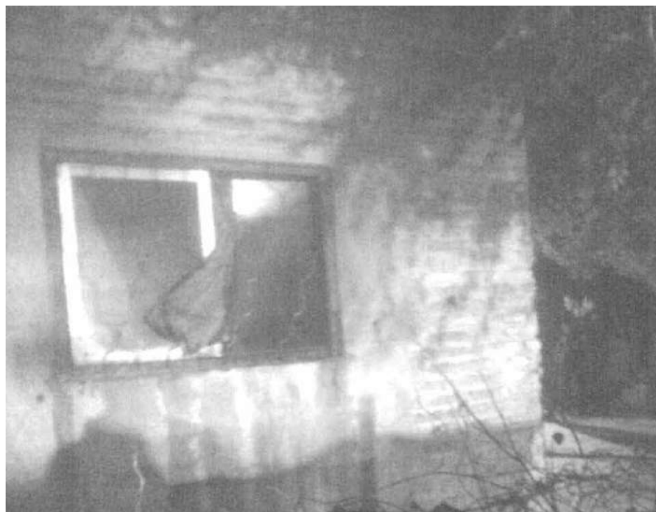
Lateral de la vivienda incendiada intencionalmente en la noche de ayer.

Siendo aproximadamente las 02,00 hs. de la víspera, los Bomberos Voluntarios de 9 de Julio fueron requeridos desde un domicilio de calle Schweitzer 850, en Ciudad Nueva, lo que determinó una intensa tarea