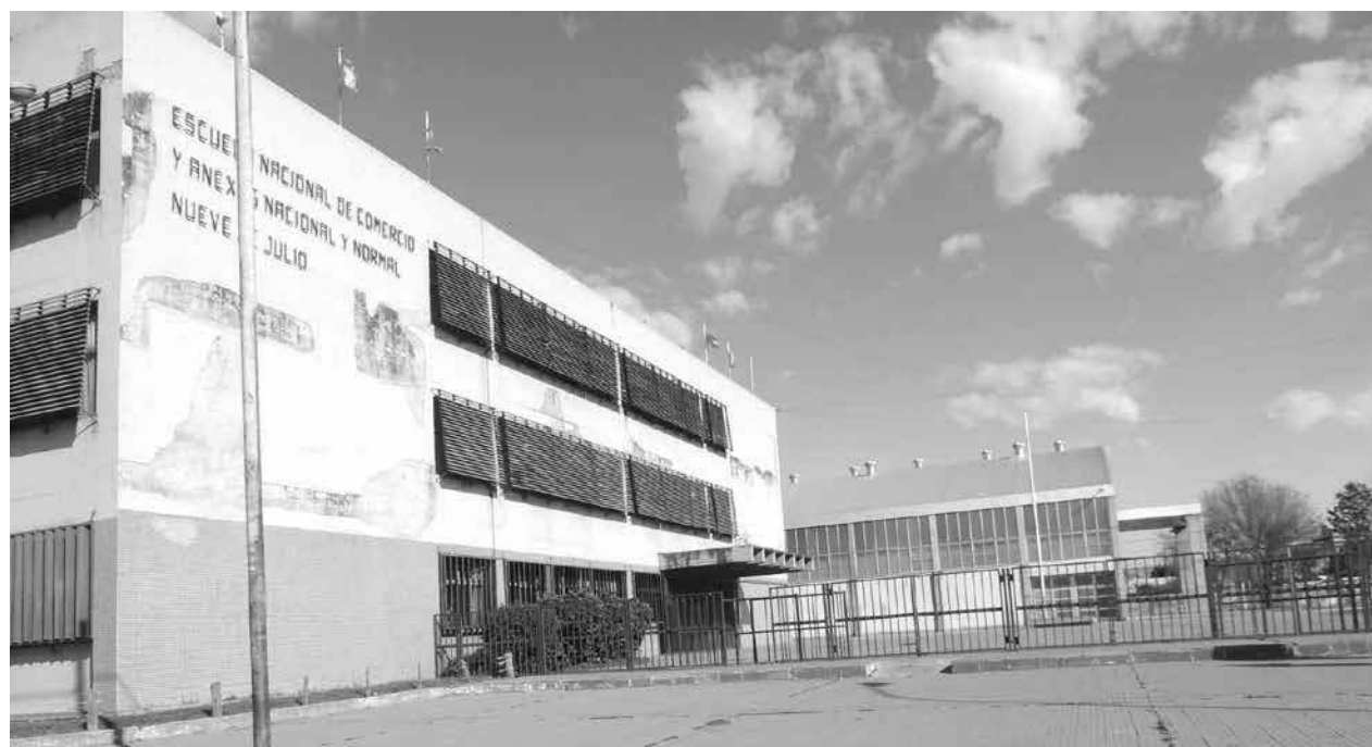
Los establecimientos educativos estatales no dictaron clases.