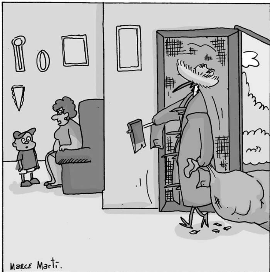
-Ahí volvió tu padre. Fue al corral a buscar gallinas para la cena.