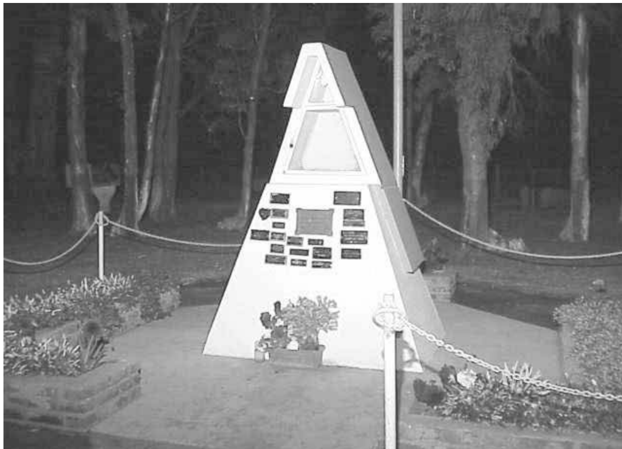
La comunidad pide que devuelvan o se recupere la imagen de la Virgen de Luján.

En la jornada del domingo, los vecinos de la localidad de Dudignac amanecieron con la ingrata e insólita noticia de la desaparición de la imagen de Nuestra Señora de Luján erigida en el acceso a la localidad, que había entronizado años atrás en esta comunidad la