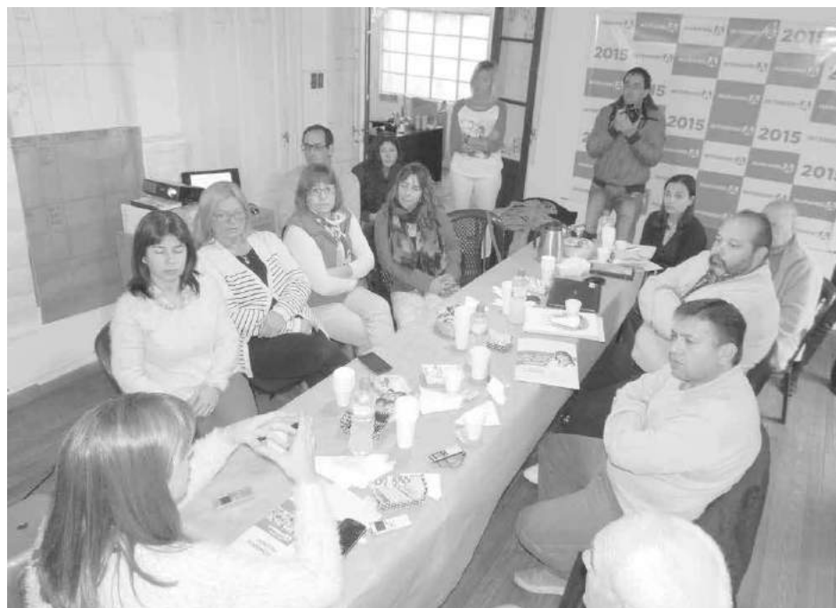
Los medios de prensa participaron el sábado de un desayuno cordial.

la propuesta de GEN se basa en siete ejes sobre los cuales basará su gobierno en caso de acceder a la Intendencia, los que son los siguientes: