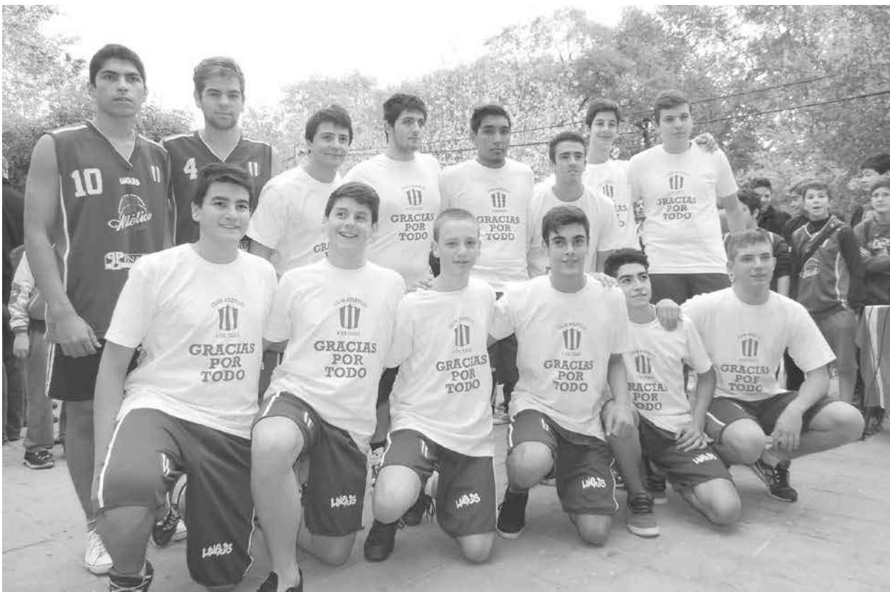
Jóvenes jugadores del club muestran la leyenda en sus remeras "Gracias por todo".

a directivos y socios albirrojos y puso de manifiesto que el trabajo realizado es un ejemplo a seguir en todos los sectores de la comunidad.