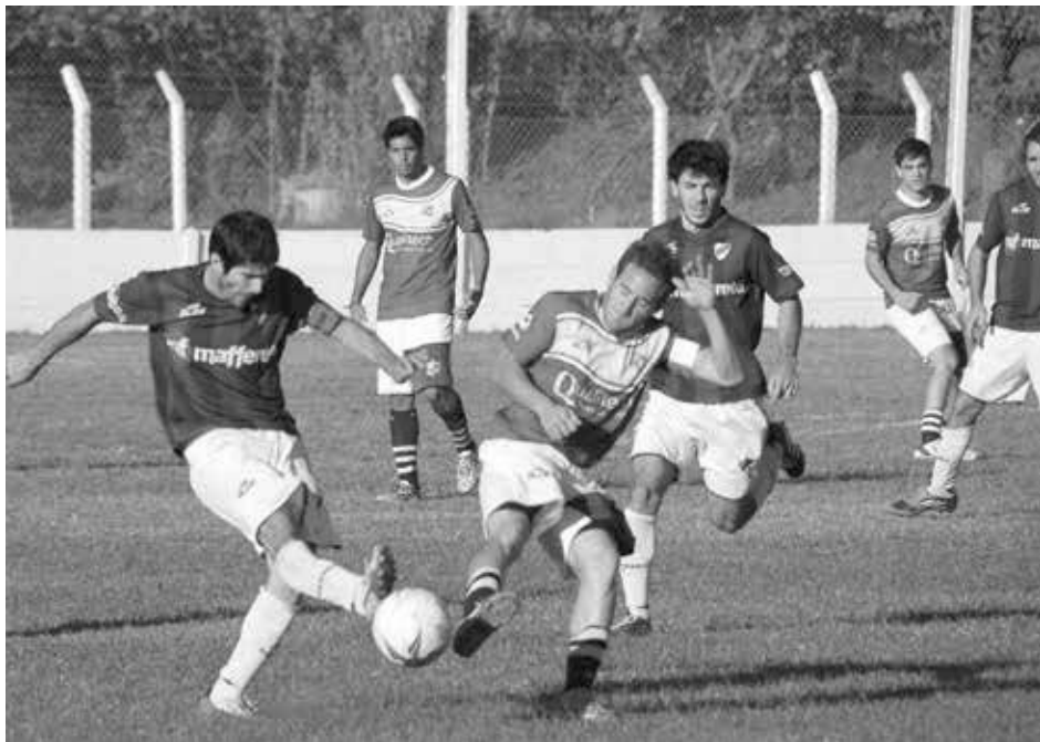
Atlético Quiroga le propinó una goleada (5-1) a los Tigres.

Liquidó como un mero trámite su choque contra La Niña y ganó por 3 a 0 - San Martín y San Agustín apenas sumaron un empate ante French y Dudignac, respectivamente - Quiroga quiere salir del fondo y goleó a Once Tigres por 5 a 1 - El Rojo derrotó a Libertad.