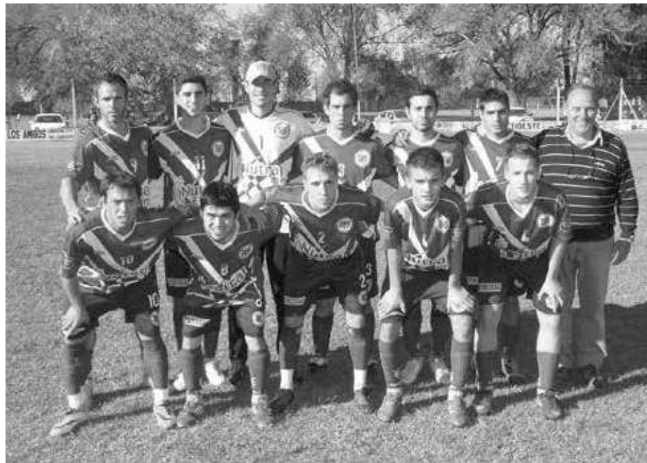
Deportivo San Agustín.

Una nueva jornada de fútbol se vivió en la tarde de ayer en nuestra ciudad, correspondiente a la segunda fecha de las revanchas del torneo "Adrián Mássico", donde Atlético 9 de Julio sigue estirando diferencias y ahora vuelve a quedar a 6 de su más inmediato perseguidor.