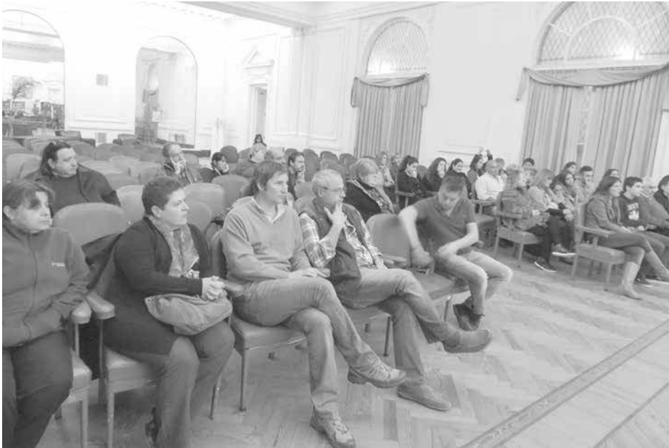
Asistentes a la jornada del pasado sábado.

porque a mi padre, a mi familia y a mí en general, nos tocó vivir en carne propia estas atrocidades". "Cuesta creer que hoy haya quienes todavía reivindicquen a la dictadura militar y permanezca agazapada afirmando que con los militares estábamos mejor", lamentó, valorizando la posibilidad de recorrer el país con esta muestra, "con la convicción de que la memoria no es un espacio estanco del pasado, sino que es algo constante que nos ayuda a caminar y asentirnos firmes para caminar hacia adelante".