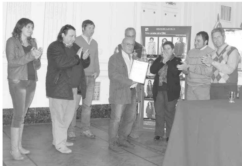
Concejales de distintas bancadas hacen entrega del decreto al ilustre visitante.