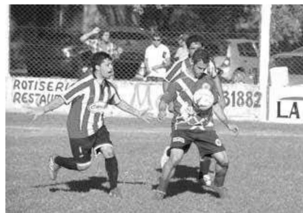
Dudignac y el Granate sellaron un empate en 0.

LA NIÑA 0 - ATL. 9 DE JULIO 3 Goles: Pastor, Maccagnani -penal- y Figueroa (A9J).