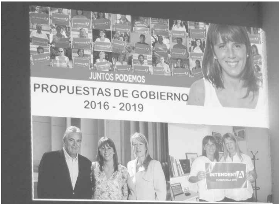
Imágenes de la presentación de propuestas del GEN.