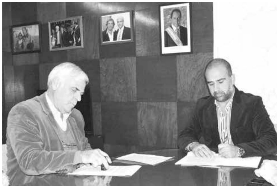
conjuntas con los equipos de Derechos del Niño, local de Promoción y Protección y provincial.