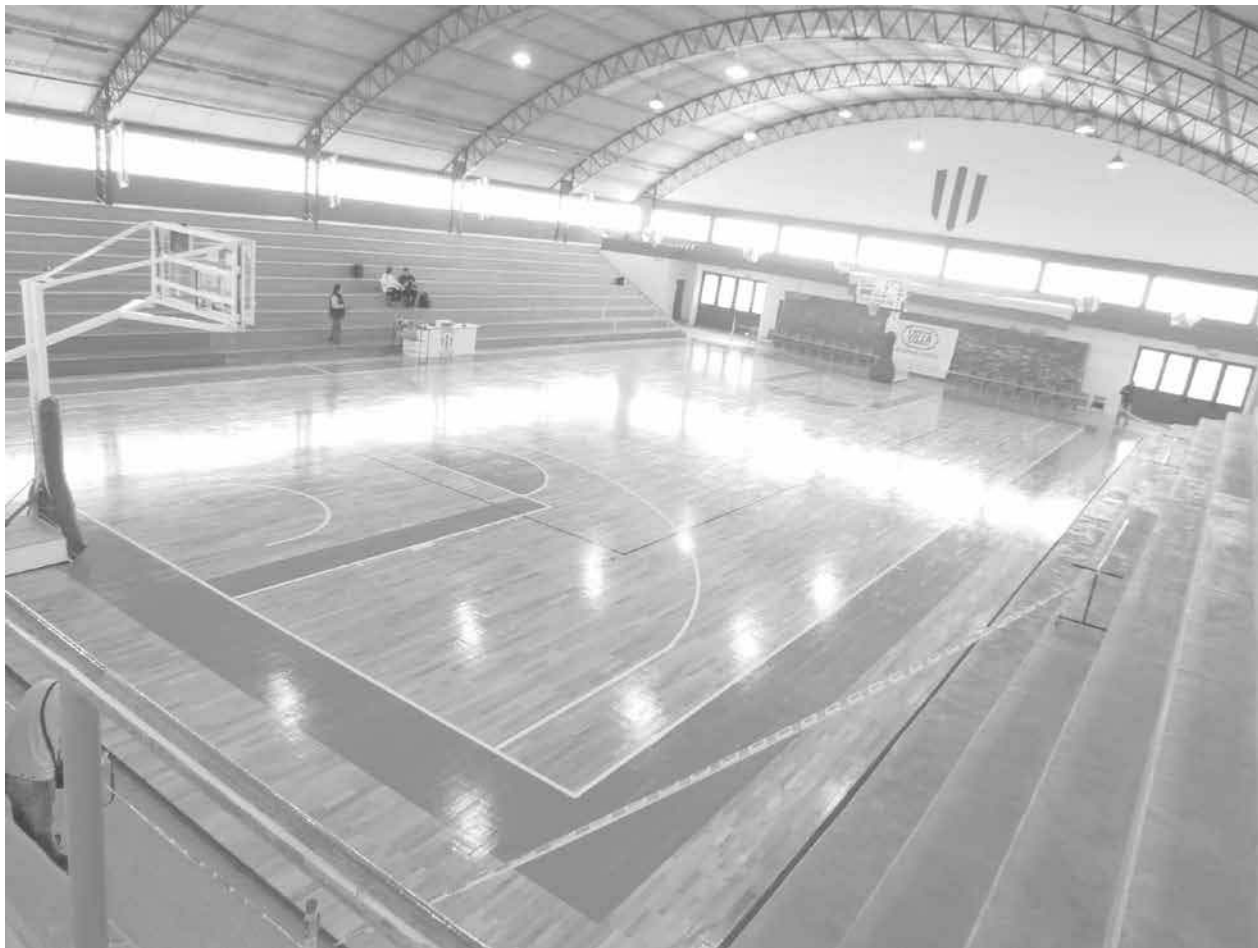
Imponente imagen del estadio "Ernesto Buncora" con su flamante piso flotante.