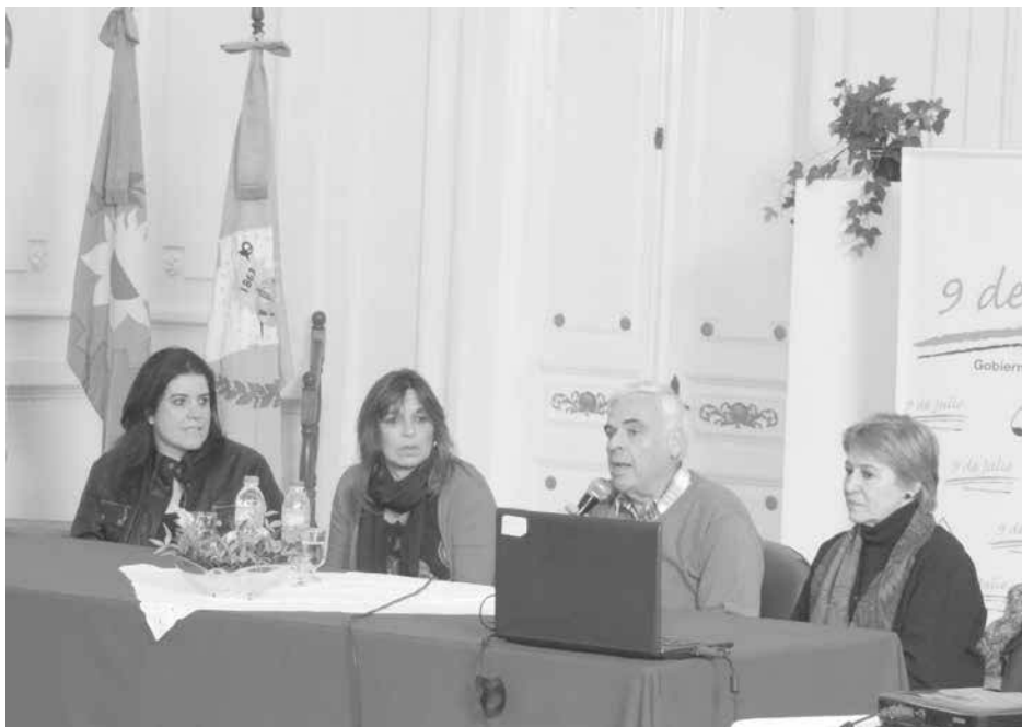
El Intendente realizó la apertura de la jornada de ayer.

9 de Julio, dio apertura a una importante capacitación para profesionales de la