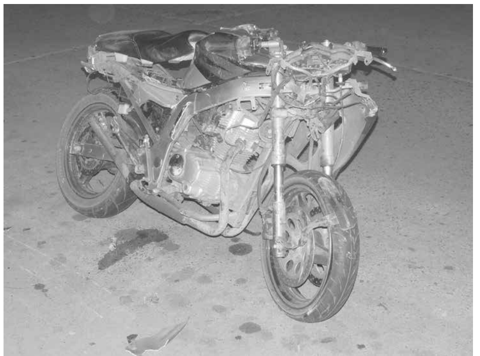
Moto de alta cilindrada que conducía el joven fallecido.