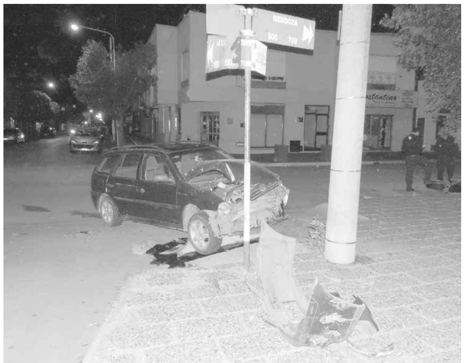
Unidad VW Gol Country protagonista del fatal accidente.