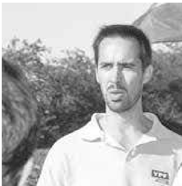
Ing. Nicolás Romano de Guazzaroni Greco S.A.

red de ensayos de fertilización que permitió generar un modelo explicativo del rendimiento de trigo con un coeficiente de determinación (R) de 0.48. En el mismo se utilizaron como variables independientes la humedad a la siembra, el N orgánico del suelo, el contenido de N mi-