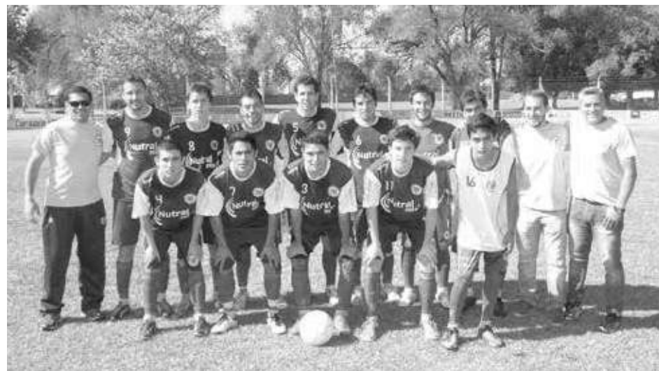
Deportivo San Agustín.

Horario de invierno SOLO POR LA TARDE de 16 a 18 hs.