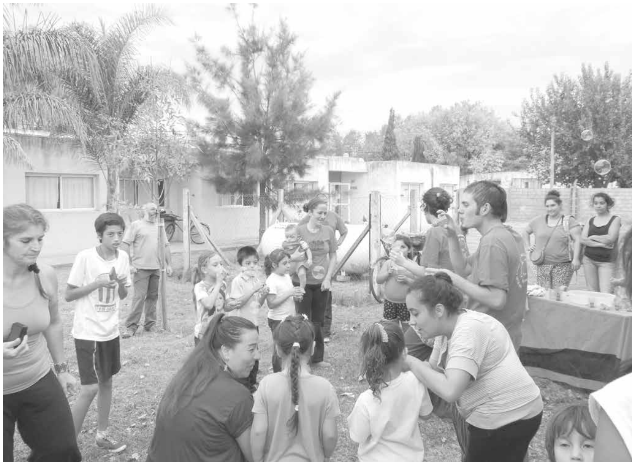
Los Cruzavías pusieron en marcha su propuesta cultural de arte.

Comprende a niños desde 4 hasta 12 y funciona en el Centro Integrador Comunitario de Ciudad Nueva. Inf. en Pág. 4.