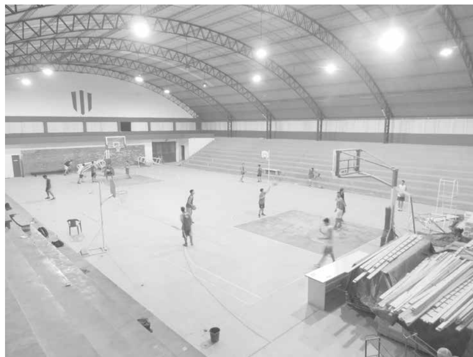
El gimnasio espera el anhelado sueño de varios dirigentes albirrojos.