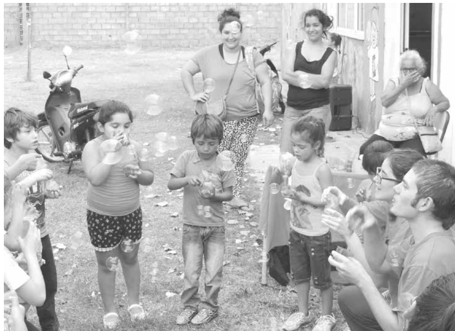
Los chicos disfrutaron de la primera jornada de la escuela.