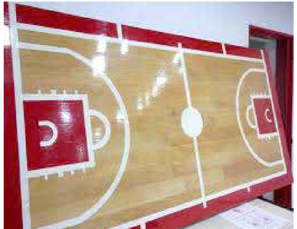
Atlético 9 de Julio presentó la maqueta de lo que será el piso de la cancha de basquet.

gimnasio: se está pintando en su totalidad, salvo las tribunas, que se dejan para el final; le está dando otro aspecto; y se está reparando toda la estructura, luego de haberse cambiado todas las ventanas, se han puesto membranas en todas las losas, se acondicionaron las canaletas y se van a sellar todas las clavaduras de las chapas, para garantizar humedad cero, como exige la fábrica para evitar inconvenientes, a cuyo efecto de han cortado los mosaicos, a 15 cms. de la tribuna, para hacer canaletas por si algún día ingresara agua de alguna parte. Además, pensando en traer espectáculos importantes, se van a mejorar los vestuarios en forma integral y se realizarán trabajos de albañilería en las demás dependencias; es decir, que se espera contar con un gimnasio a nuevo, a cuyo efecto se siguen vendiendo metros cuadrados de piso, habiendo obtenido una magnífica respuesta de la comunidad pero cuanto más se recaude mayores serán las obras que se podrán desarrollar.