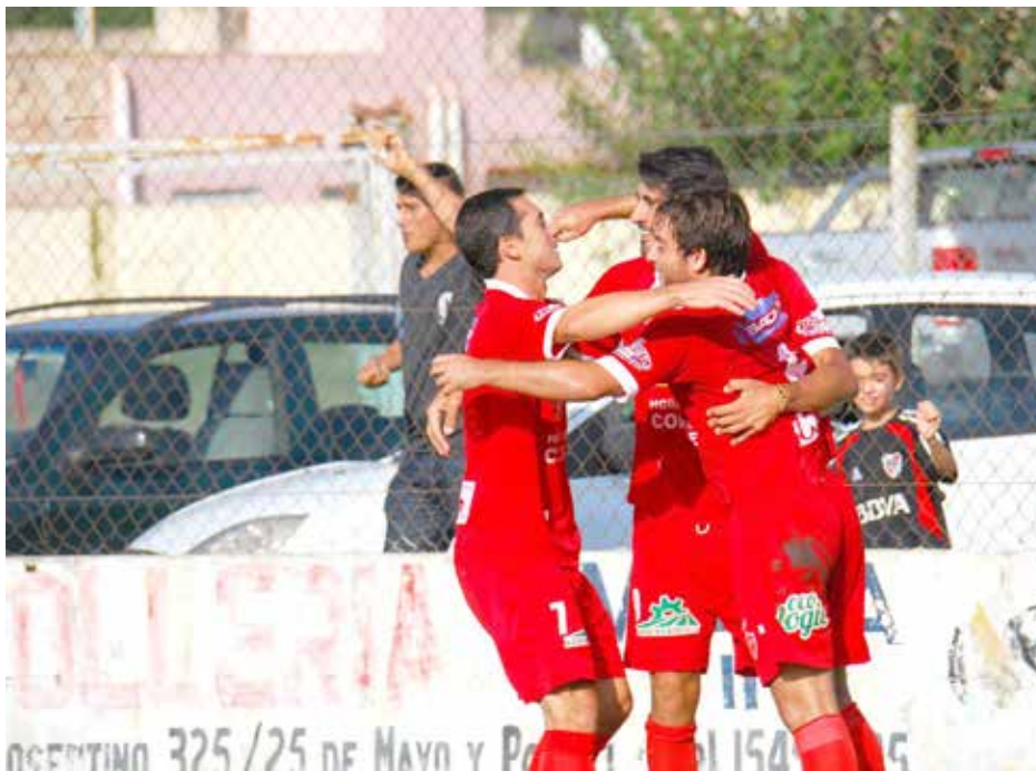
Festejos rojos tras una de las conquistas de la goleada.