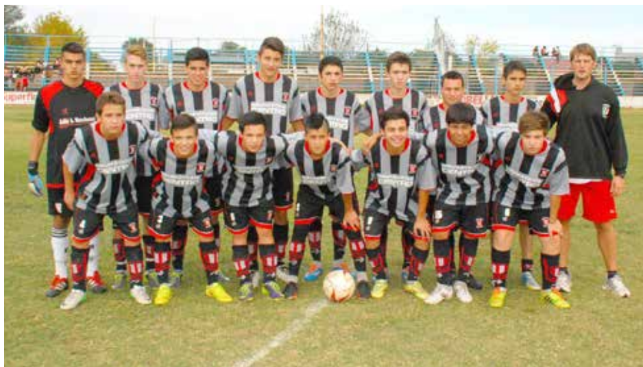
Quinta División de Atlético 9 de Julio.