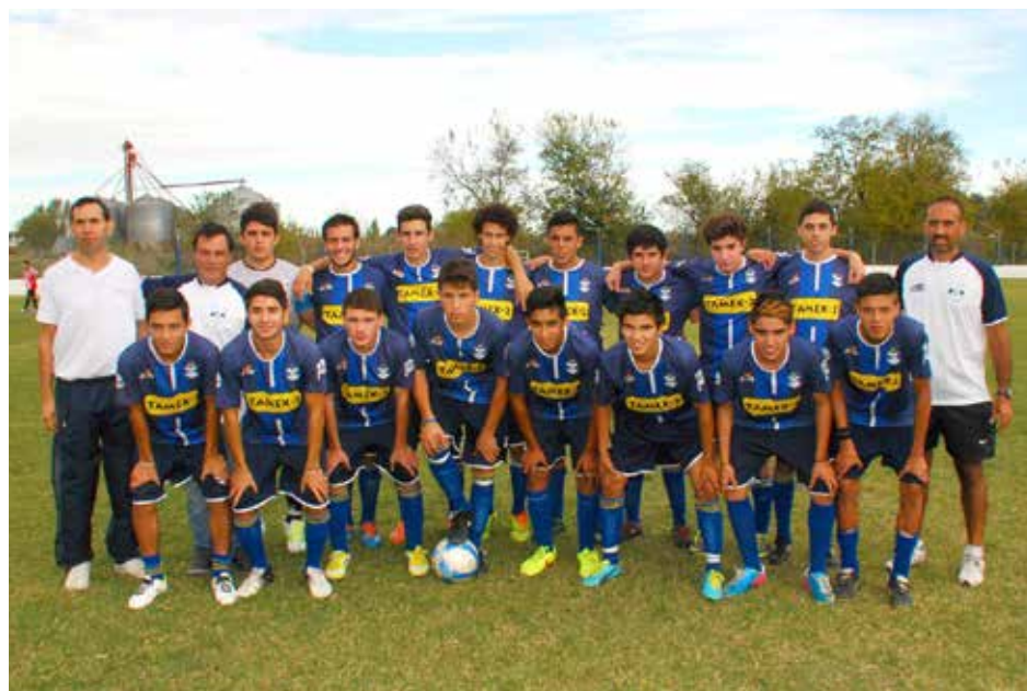
Quinta División de FC Libertad.