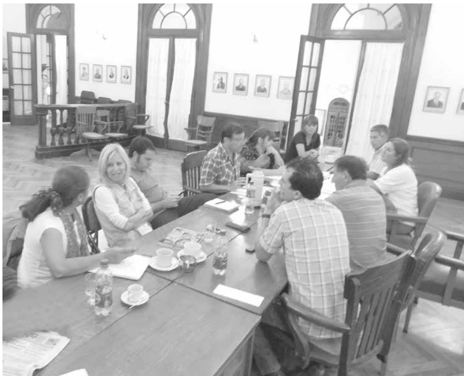
Sin presencia de funcionarios municipales, se desarrolló la jornada.