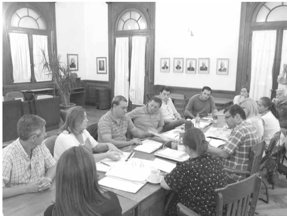
Concejales, vecinos y ONG en plena reunión de la Comisión de Seguimiento de Obras.