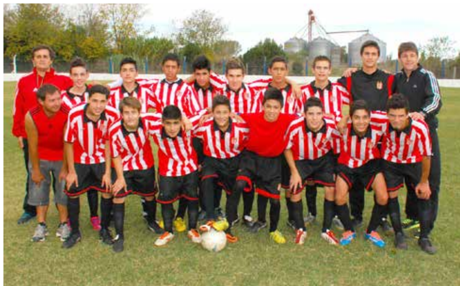
Quinta División de Atlético Dudignac.