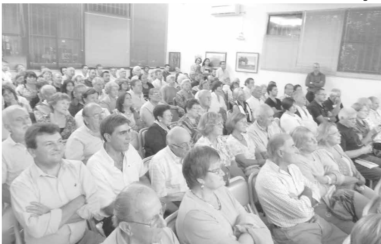
Familiares, amigos y vecinos, acompañaron la presentación del libro.