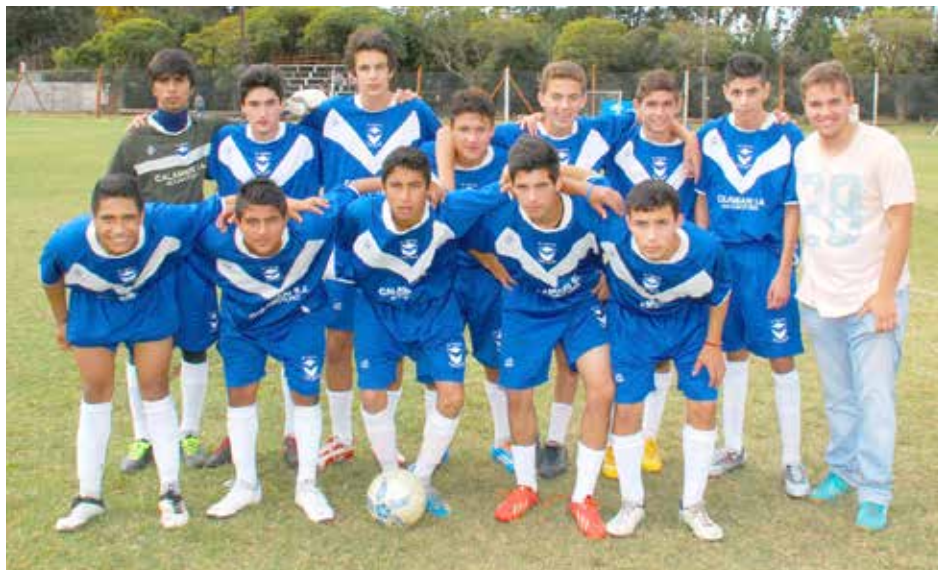
Quinta División de El Fortín.