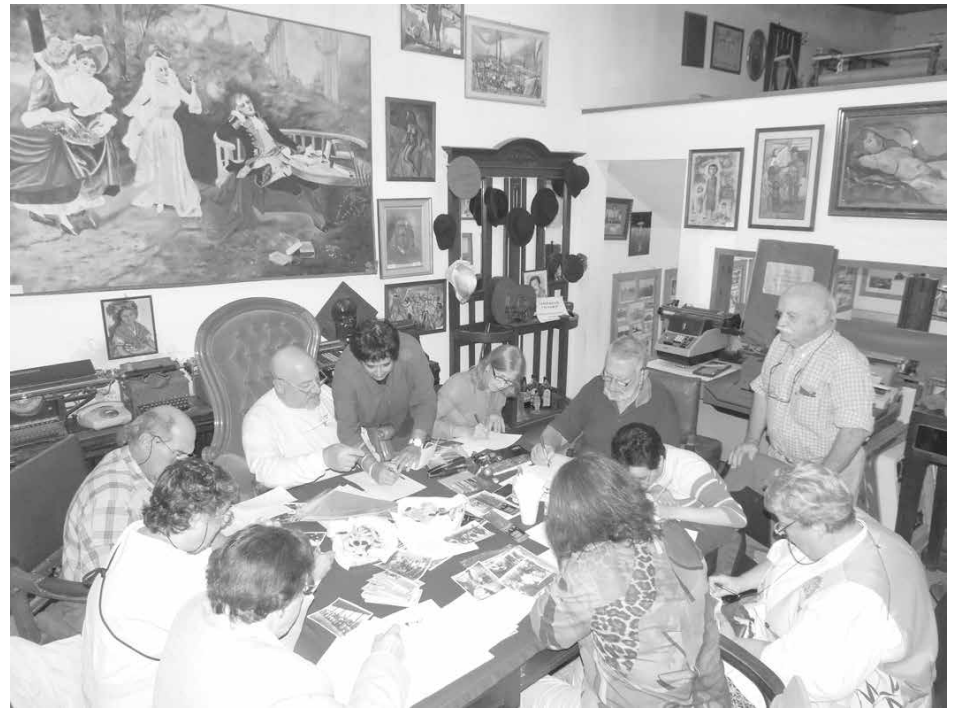
Asistentes al Café Literario desarrollado el pasado sábado.