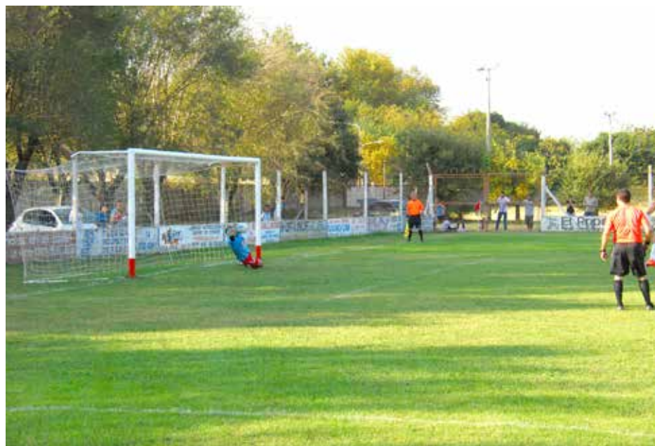
El penal pone la igualdad de Quiroga ante Agustín Alvarez en el primer tiempo.