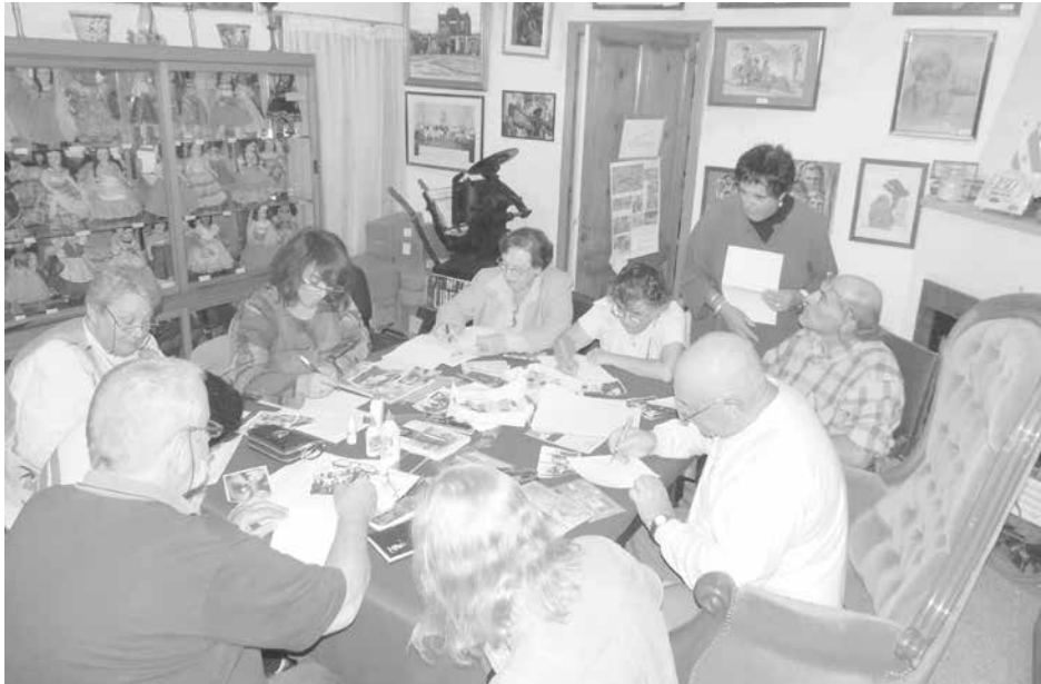
La sede del Museo y Archivo Histórico de nuestra ciudad es el lugar elegido por los artistas locales.