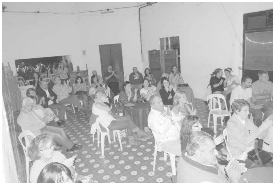
El público deleitó el show musical.