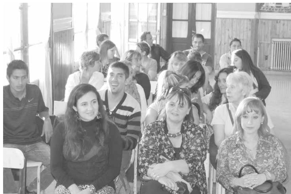
Autoridades educativas presentes en el acto protocolar.