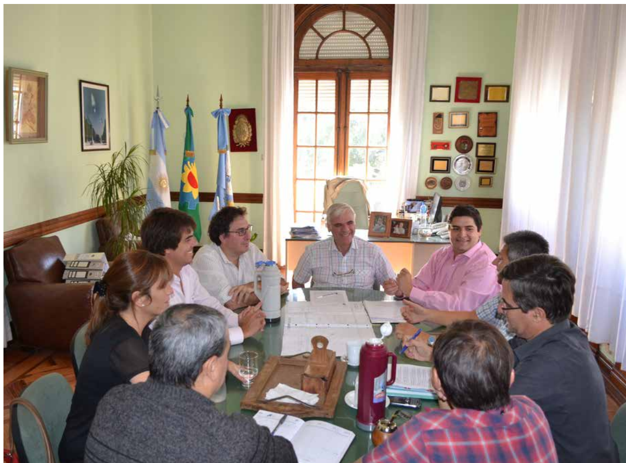
Reunión realizada ayer en el despacho oficial.

El Intendente solicitó al HCD un urgente tratamiento del Proyecto de Ordenanza para entregar su concesión al Auto Moto Club Nuevejuliense (ex 9 de Julio Automóvil Club). Inf. en Pág. 2.