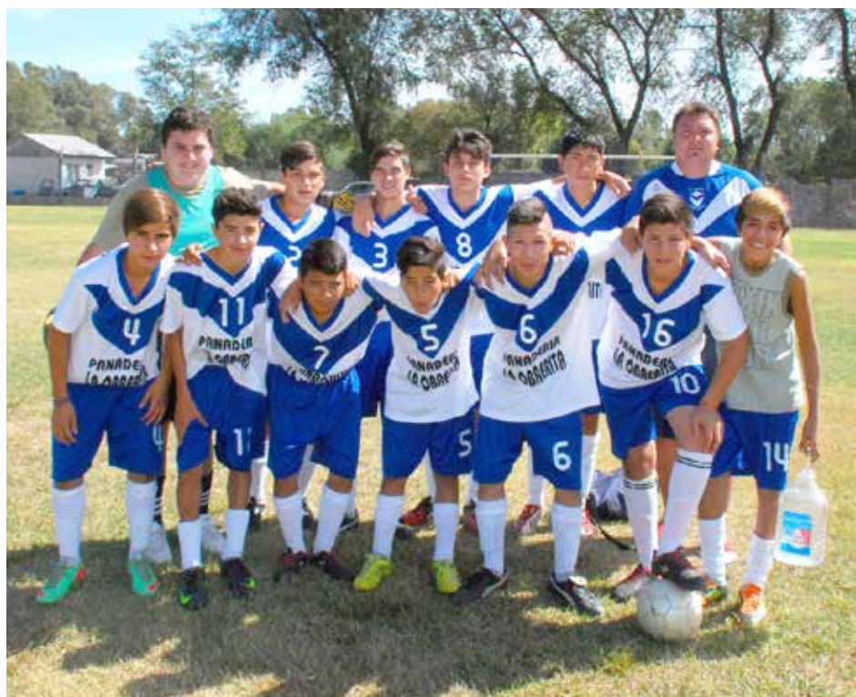
Sexta División de C. y B. El Fortín.