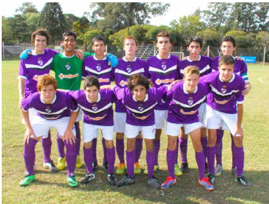
Quinta División de Atlético Quiroga.