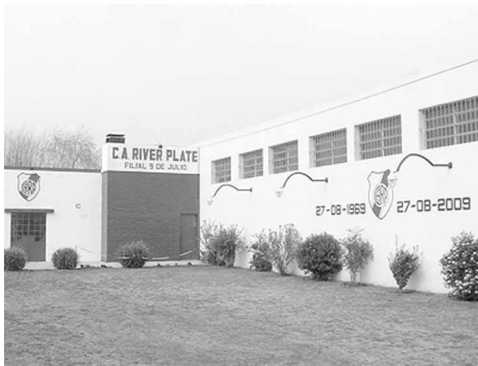
Vista de la Filial local de River Plate "Jorge Solari".

"La Comisión Directiva anterior ha trabajado muy bien, las instalaciones se encuentran en excelente estado, pero siempre hay más por hacer y para ello queremos sumar gente nueva y joven, y reactivar distintas acciones como las que se realizaban años atrás con el festejo del Día del Niño, por ejemplo", indicó, invitando nuevamente a socios y simpatizantes a acercarse y comunicarse con los integrantes de la nueva Comisión Directiva o al teléfono 46-8014