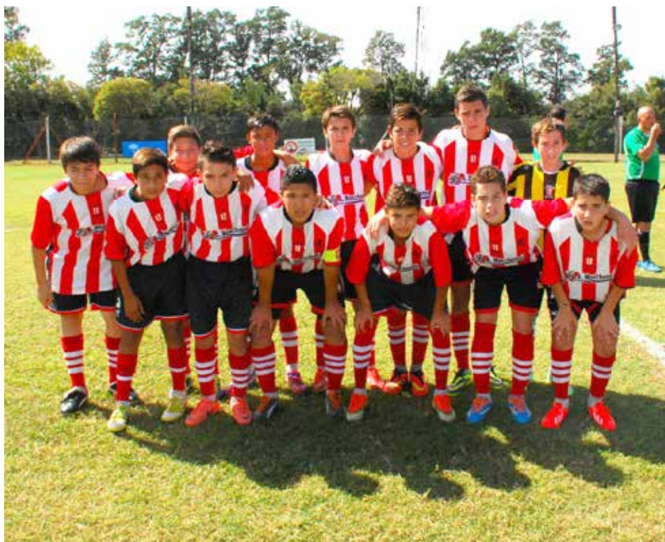
Sexta División de Atlético 9 de Julio.