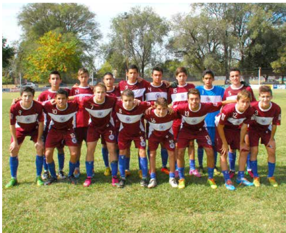
Quinta División de Deportivo San Agustín.