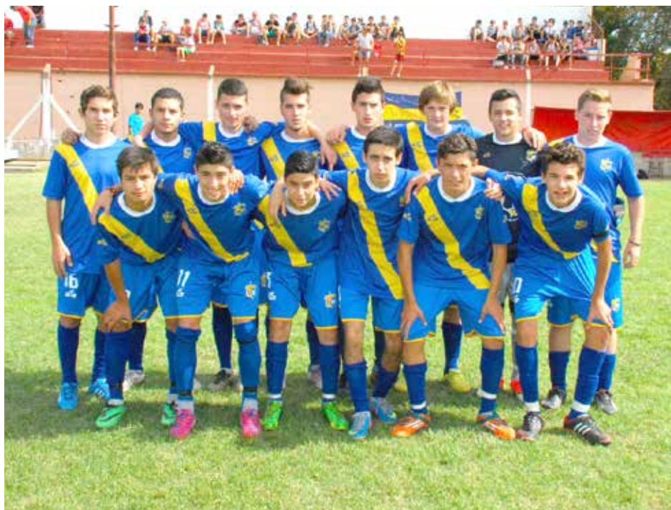
Quinta División de Once Tigres.