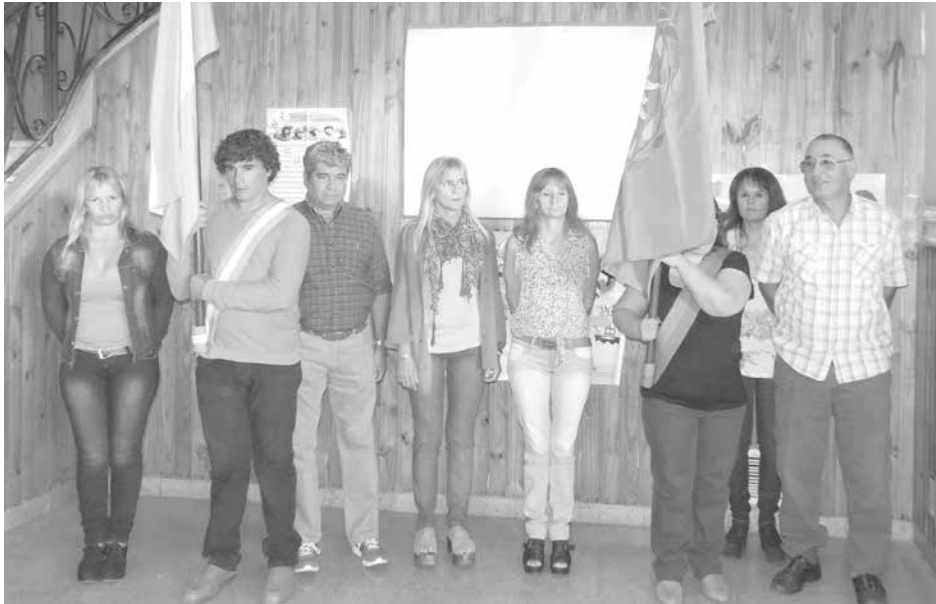
Alumnos y docentes del Plan Fines presentes con banderas Nacional y de la provincia.

Como "Tiempo" lo anticipara en su anterior edición, en la tarde del pasado miércoles, en sede de la Escuela Primaria N° 3, de Av. Vedia casi Alsina, se desarrolló la apertura del ciclo lectivo del Plan Finalización de Estudios Primarios y Secundarios (FINES), que permite que jóvenes y adultos puedan culminar sus estudios. El acto fue encabezado por la Inspectora Jefe Distrital,