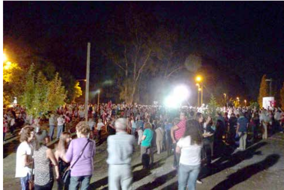
El Vía Crucis fue habilitado el pasado Viernes Santo.