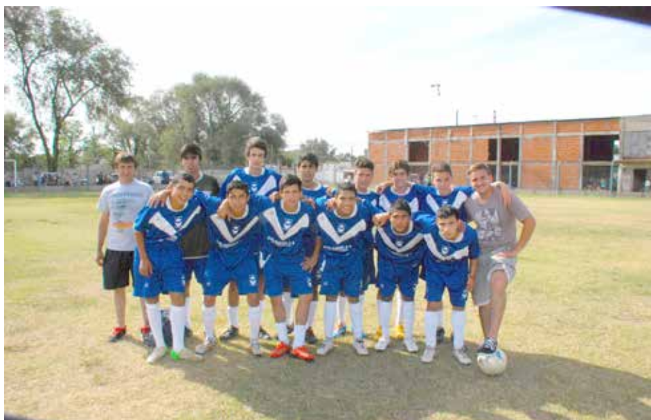
Quinta División de El Fortín.