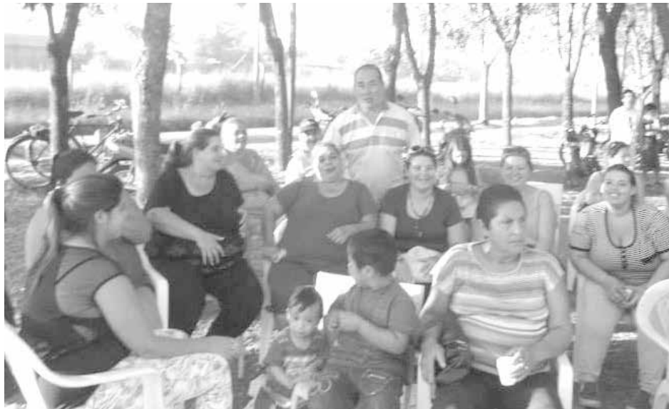
Integrantes de "Mirá que Vamos", de la Mesa de Gestión del CIC y vecinos, coordinaron el evento.

Con la participación de distintos sectores, se compartieron actividades recreativas y reflexivas.