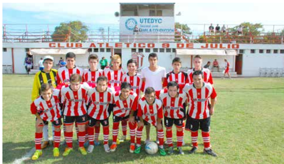
Quinta División de Atlético 9 de Julio.