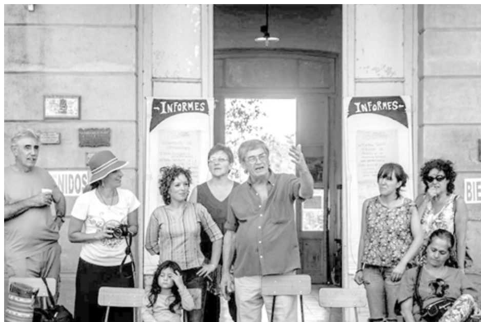
La Estación de Trenes fue el lugar elegido para las dos jornadas realizadas en la localidad.