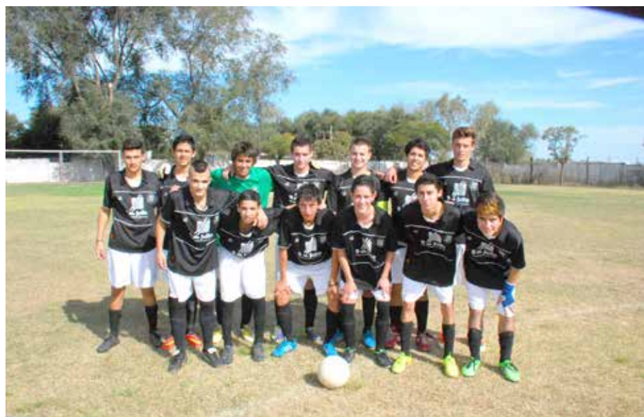
Quinta División de AtléticoFrench.