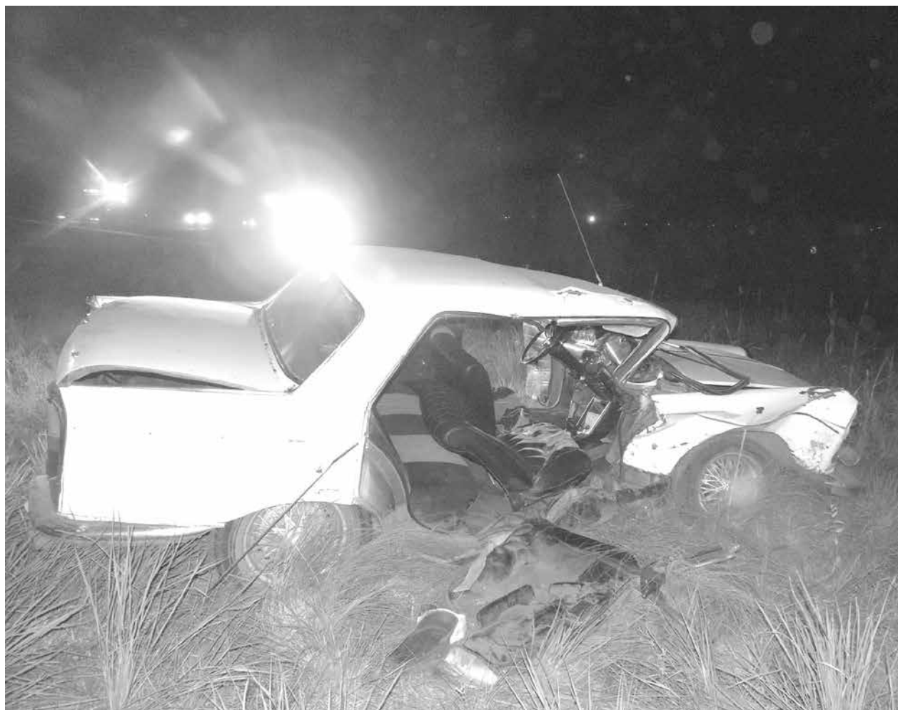
La imagen muestra el estado del Peugeot 404 luego del violento choque.

Un automóvil que viajaba por Ruta 65 embistió en su lateral a otro que cruzaba la carretera – Afortunadamente y pese a que el conductor del segundo vehículo debió ser retirado por Bomberos entre los hierros retorcidos, no se registraron víctimas. Inf. en Pág. 2.