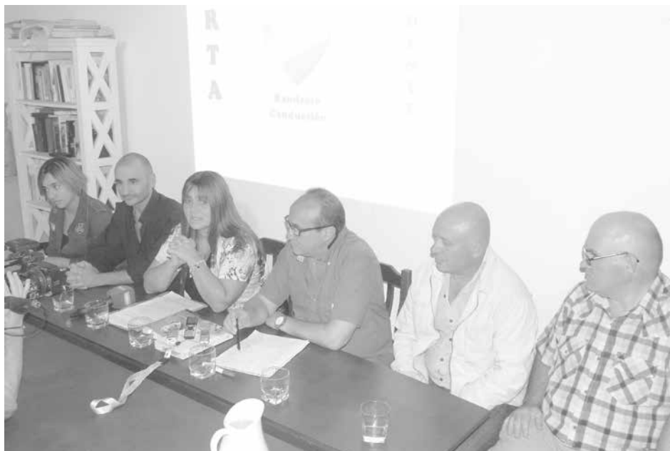
En conferencia de prensa se presentó el espacio "Nueve dirigencia".

un plan para reconvertir el villerío de Ciudad Nueva en unidades productivas como sucede en Israel, con espacios verdes, escuelas y cultura de trabajo", delineó al referirse a algunas de las propuestas que baraja para su plataforma.