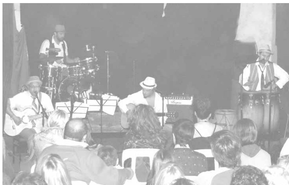
A todo ritmo se presentó nuevamente Reservado en "La Esquina".