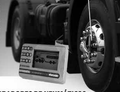
CALIBRADORES DE NEUMÁTICOS INTERNO Y EXTERNO