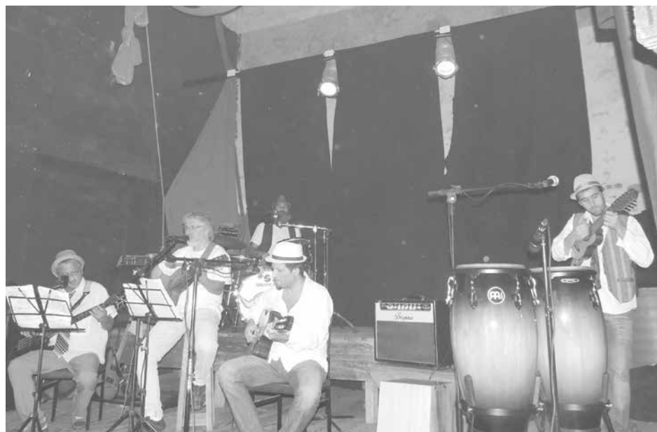
21 y domingo 22 de marzo El recital recorrió las distintas canciones de Reservado, en formato acústico ante un nutrido auditorio.

La banda local Reservado Gran Campeón, que se encuentra terminando de grabar en los estudios "Orión" de Capital Federal un nuevo registro discográfico, desarrolló sendas nuevas presentaciones en "La Esquina, Arte & Cultura", los días sábado