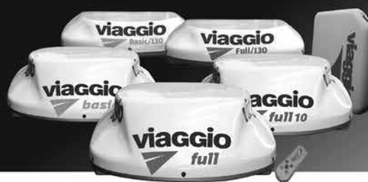
LÍNEA COMPLETA DE CLIMATIZADORES: FULL / BASIC / EXTRACHATOS / AGRO

Para que pueda adquirir nuestro productos en cualquier punto del país, seguimos sumando integrantes a nuestra amplia red de representantes. Calidad y servicio con garantía VIAGGIO.