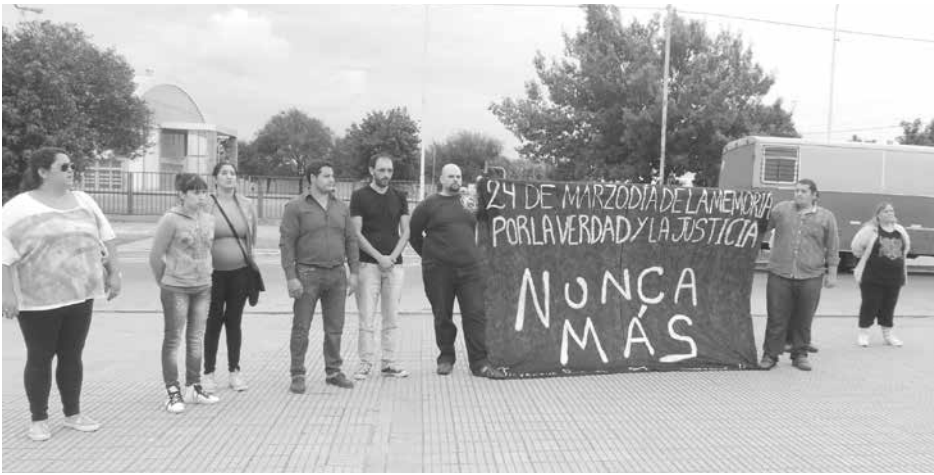
Jóvenes integrantes de la UCR con el cartel de "Nunca Más".