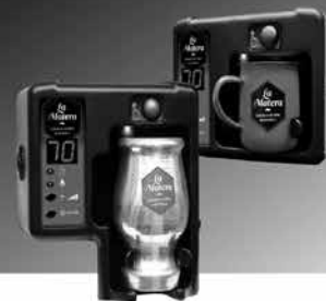
LA MATERA EN SUS DOS TAMAÑOS