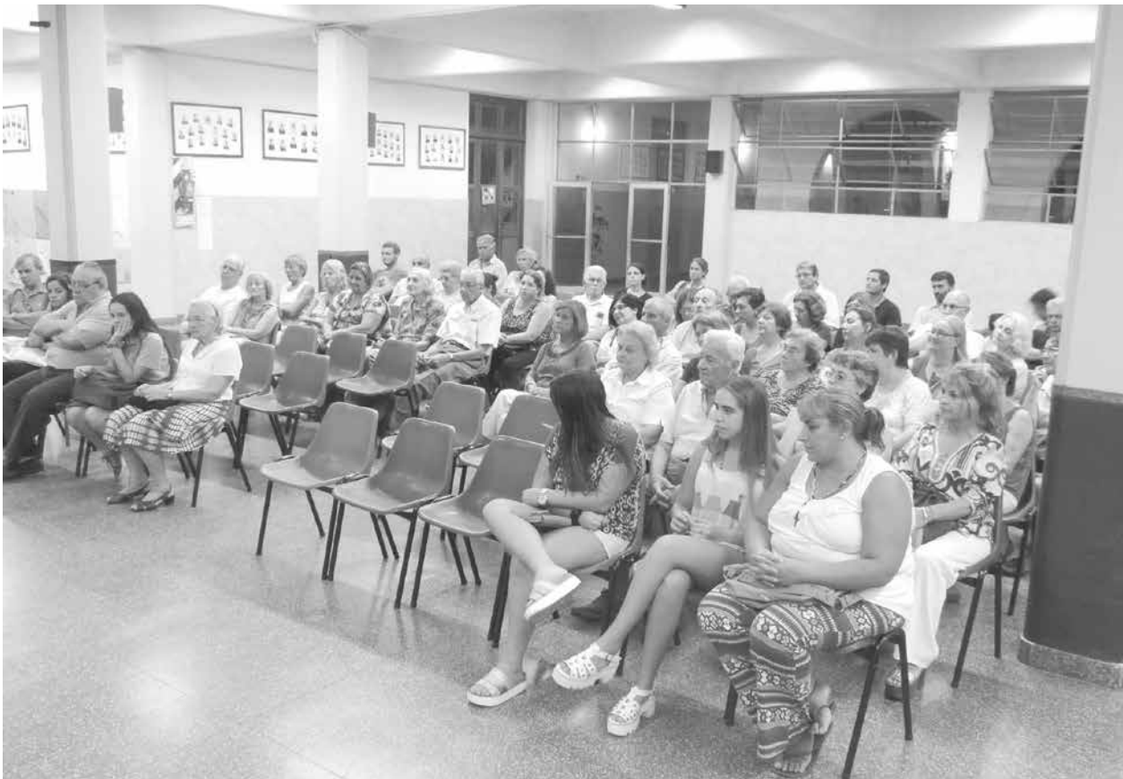
Asistentes a la presentación del libro “El Señor entró a mi casa”.