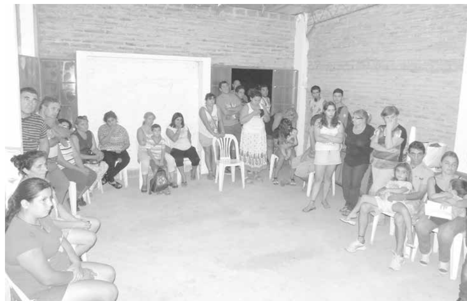
Simpatizantes de la “V azulada” acompañaron el sencillo acto.