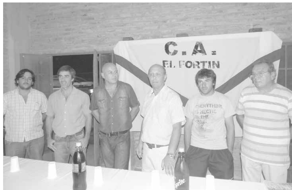
El Fortín recibió el importante aporte económico para participar de un torneo en Santa Rosa, provincia de La Pampa.

Los chicos de la categoría 2003 viajarán a Santa Rosa, para participar del torneo anual organizado por el Club Mac Allister.