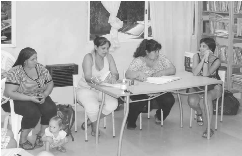
Integrantes de la Mesa de Gestión cuestionaron el accionar del municipio.

"Talo viene trabajando en el CIC desde hace 15 años, cuando el Centro funcionaba en el anterior edificio; aunque en estos momentos,