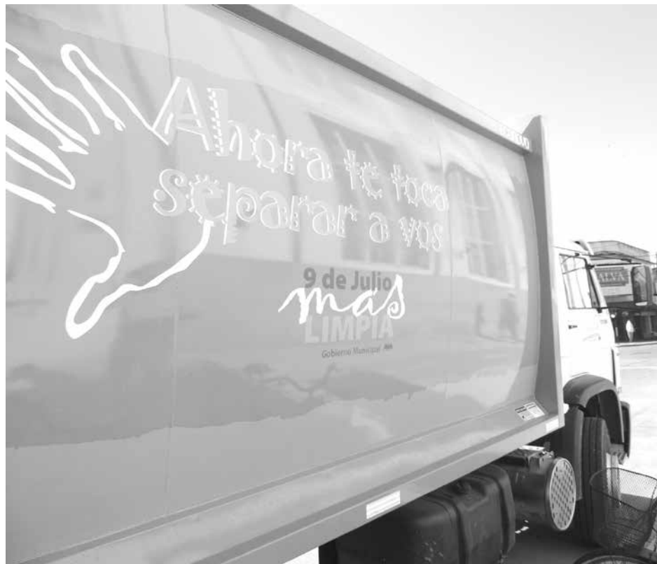
Vista de la nueva unidad que incorporó el municipio.

Asimismo, apuntó que desde la Dirección de Gestión Ambiental se está realizando una intensa campaña de información en las escuelas del distrito, para concientizar a los niños pequeños sobre la importancia de la