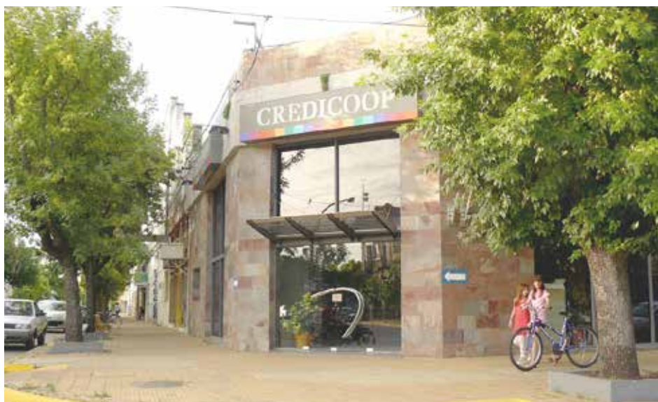
Frente de la entidad bancaria de 9 de Julio.

La entidad bancaria acompaña el desarrollo del cooperativismo de crédito en la Argentina