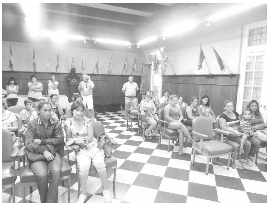
Beneficiarios de la entrega de material educativo.