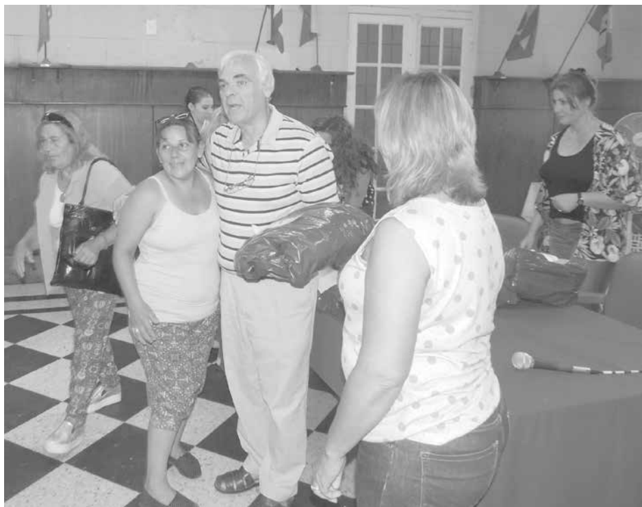
El Intendente hace entrega de uno de los kits.

La misma continuará en distintos puntos de la ciudad y localidades del distrito.