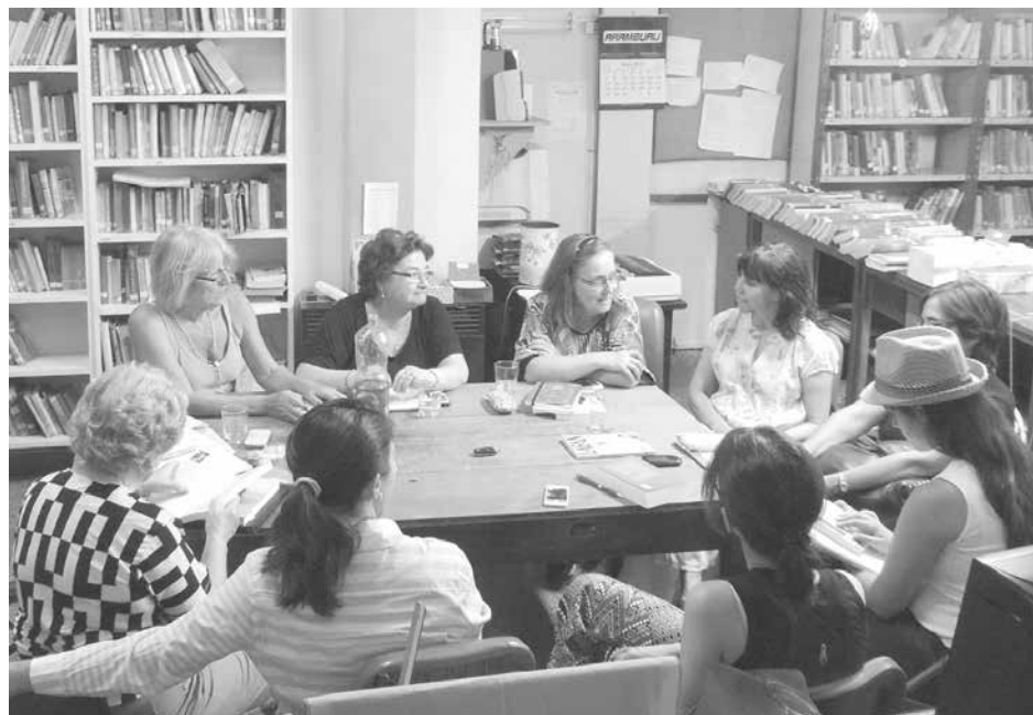
Importante propuesta cultural lleva adelante la Biblioteca.