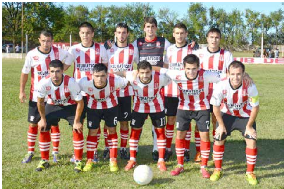
Atlético 9 de Julio.

Una gran victoria fue la lograda ayer por Dudignac, tras dos derrotas en las fechas iniciales. El albirojo dio cuenta de Agustín Alvarez por 3 a 1, en un cotejo de incidencias cambiantes y