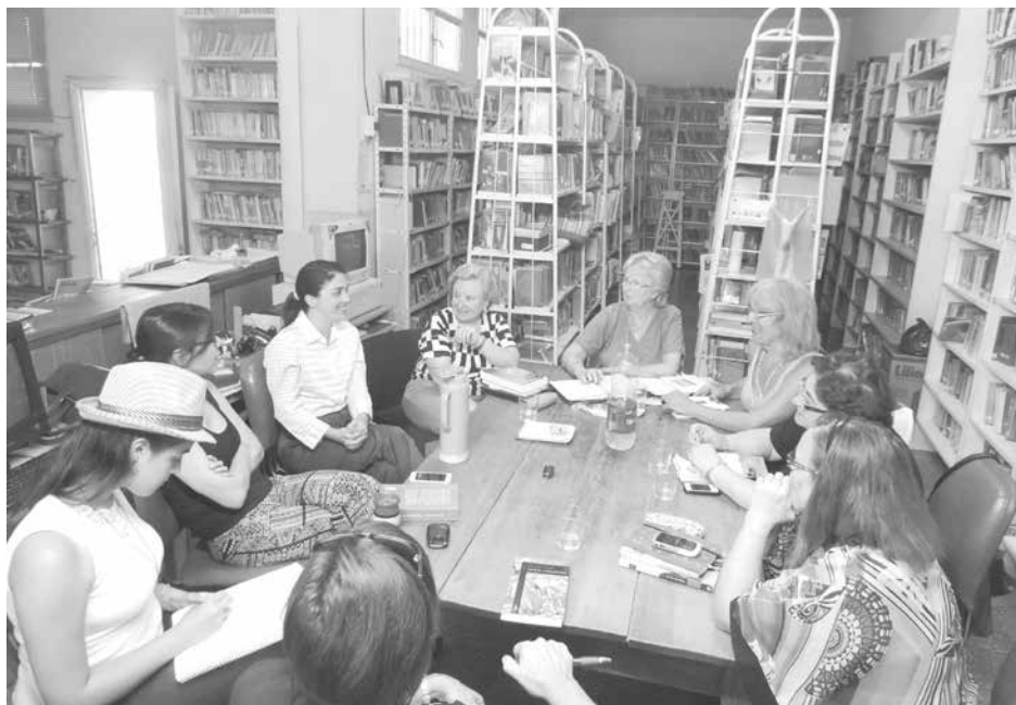
Grupo que participó de la jornada del sábado a la tarde.