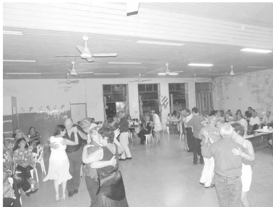
El salón de fiestas de El Hogar a todo ritmo de 2x4.