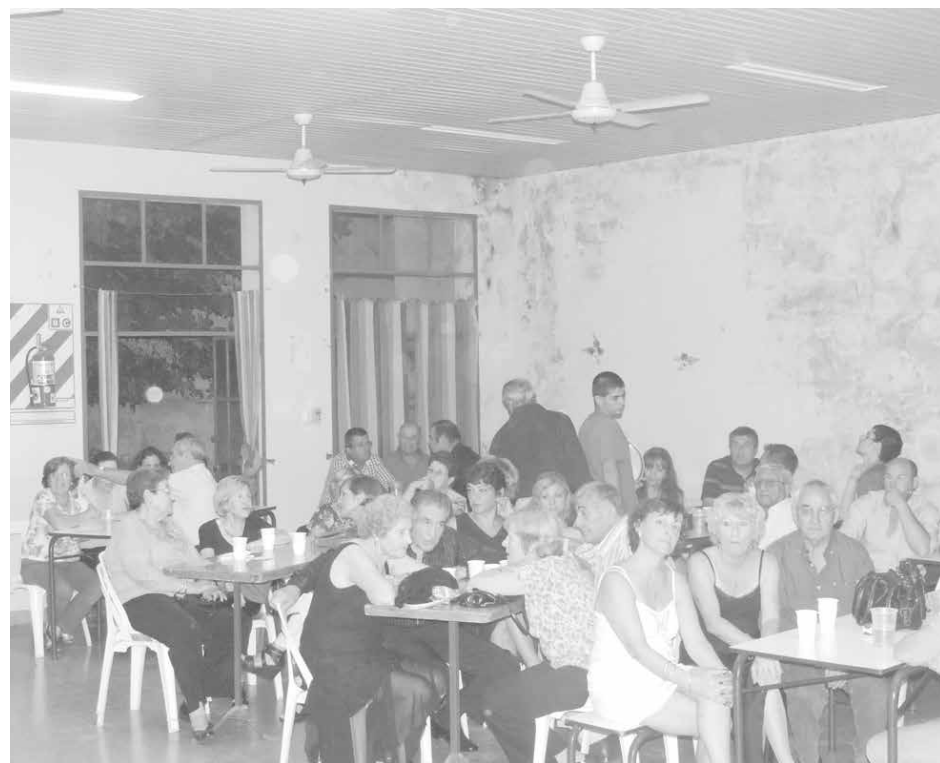
El público acompañó la velada de Milonga Solidaria.