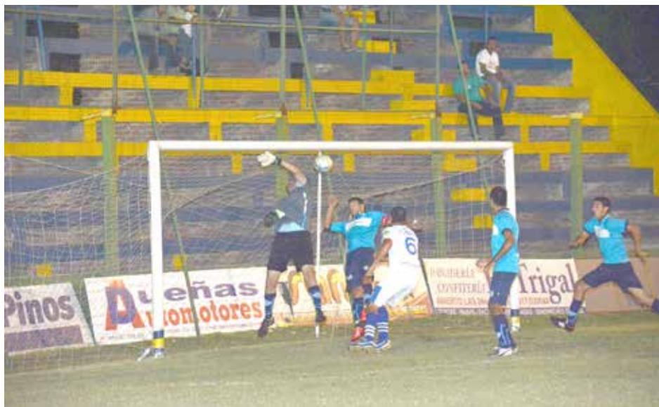
Nahara cabecea para convertir el primero de Once Tigres.

Atlético 9 de Julio rescató ayer un punto importante de lo que parecía una derrota ante San Agustín.