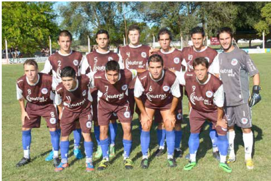
Deportivo San Agustín.

El millonario empató sobre la hora ante San Agustín – Libertad se afianza y superó a French por 4 a 2 - Victorias de Dudignac, La Niña y Once Tigres.