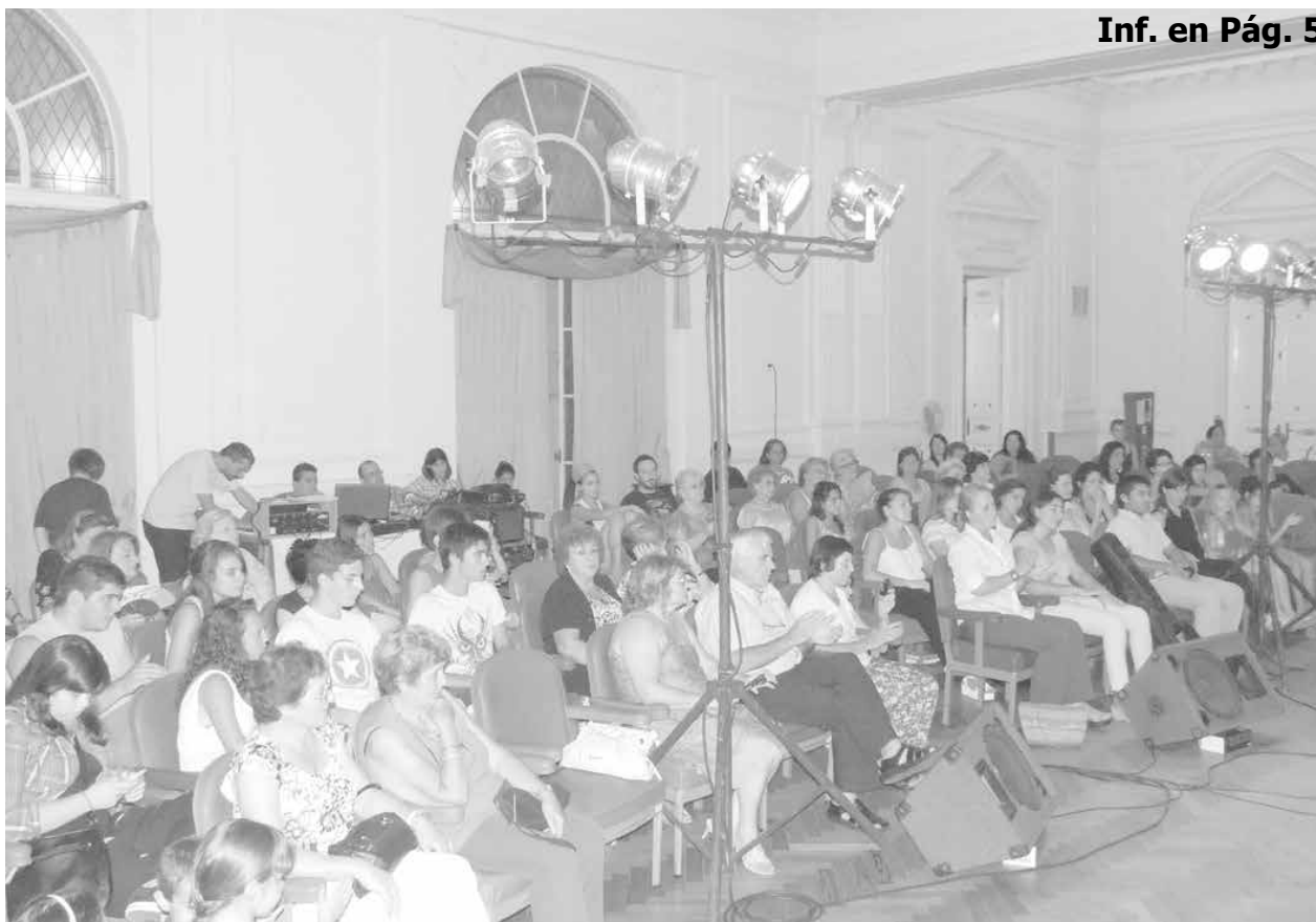
Asistentes al comienzo del Mes de la Mujer en el Salón Blanco.