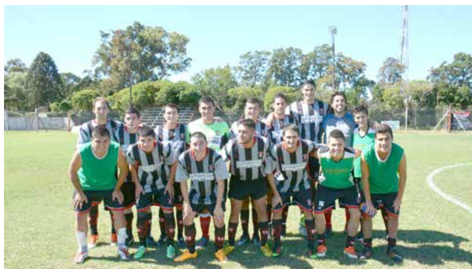
Atlético 9 de Julio.