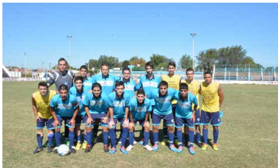
Atlético San Martín.