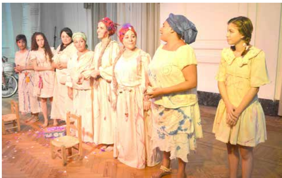
Las ocho mujeres que brindaron su homenaje con la obra de teatro "La edad de la ciruela".