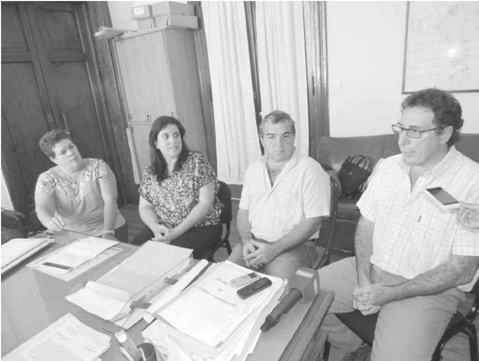
El municipio sigue brindando detalles de la tarea que realiza.

estamos mejor que antes”, señaló asimismo Gago.