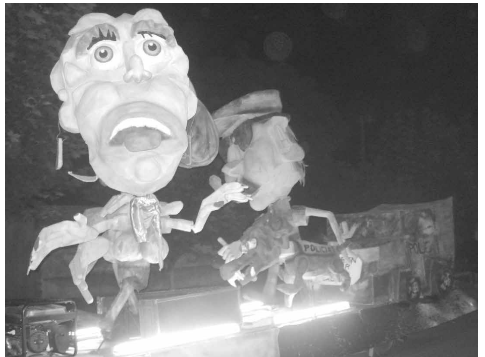
Caretones presentes que animan la noche de corsos.

"Realmente estamos muy satisfechos por el acompañamiento de toda la localidad, que se ha sumado espontáneamente al grupo inicial que puso en marcha esta idea, de la que participan todas las instituciones de la comunidad, cada uno con sus responsabilidades", señaló asimismo nuestro interlocutor.