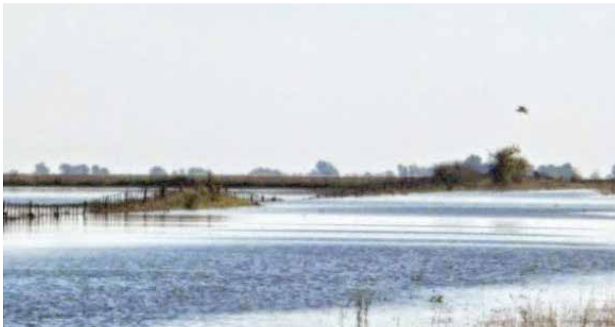
Agua del Río V que estaría llegando al distrito de Villegas

Las lluvias abundantes que azotaron a una parte de la provincia de San Luis, han hecho que el Río V crezca de manera preocupante, y esto ha comenzado a despertar la atención a las comunidades que se en-