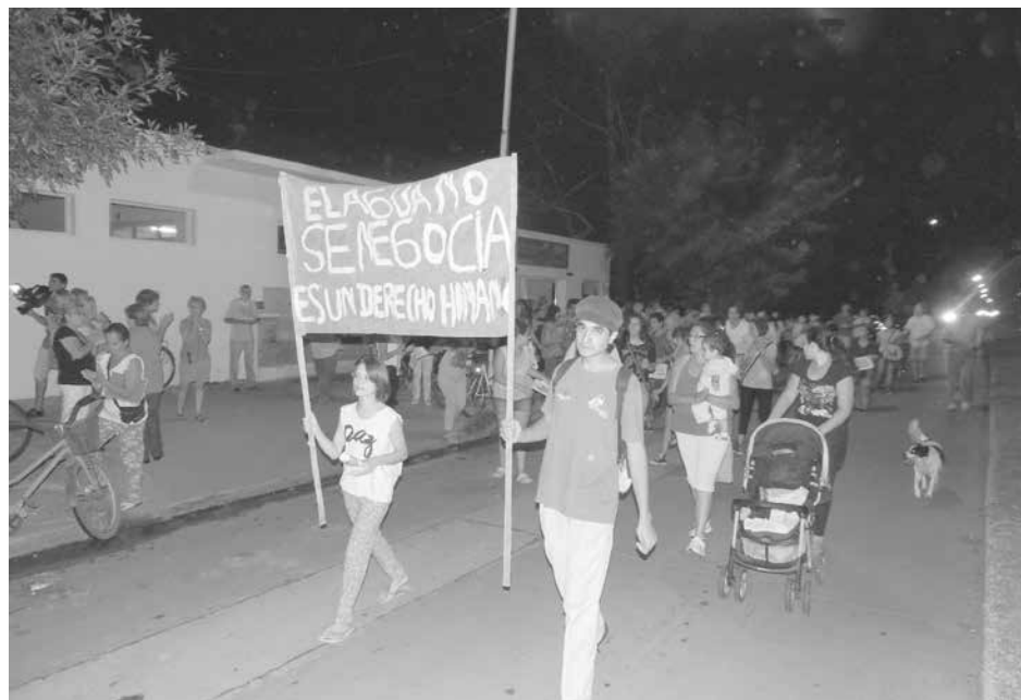
Los manifestantes expresaron su preocupación por la falta de soluciones concretas.