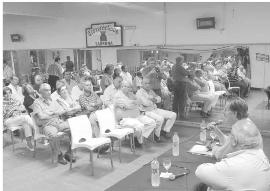
La jornada se realizó en una confitería cétrica.

implicar en la causa contra el Vicepresidente Boudou por casos de corrupción”. “Se intenta instalar un clima de impunidad, y la sociedad argentina no quiere que haya impunidad”, finalizó.