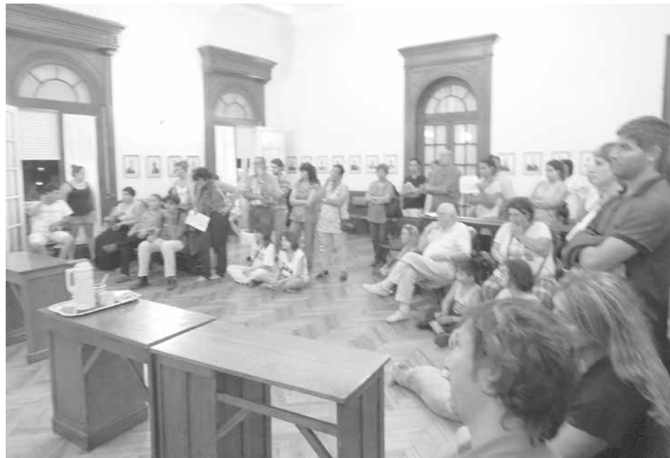
Vecinos que se movilizaron desde ABSA hasta el municipio.

En tanto, respecto de la Comisión de seguimiento local