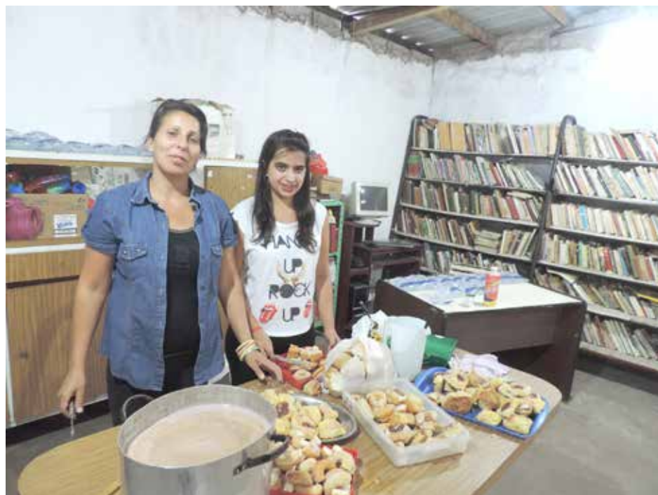
Los distintos talleres expondrán su trabajo en el festival del barrio.