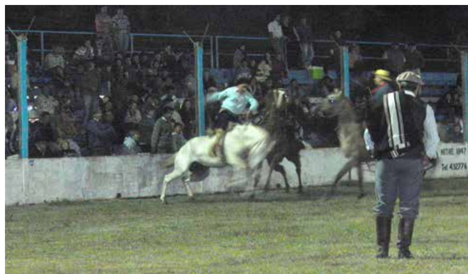
La jineteada tuvo lugar en el estadio Santiago Noé Baztarrica.