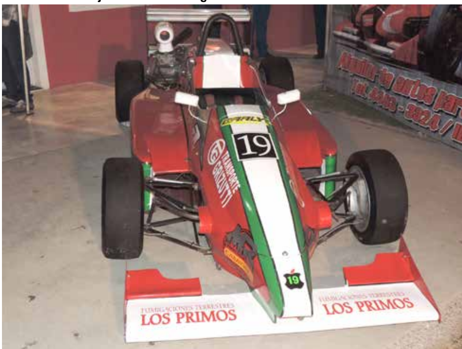
Presentación de la unidad con el número 19.