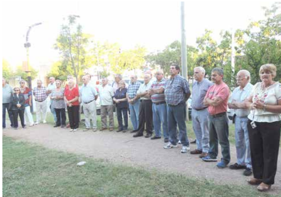
El público acompañó el acto realizado el sábado.

han apoyado a lo largo de todos estos años”. “La reciente incorporación de los aparatos de gimnasia