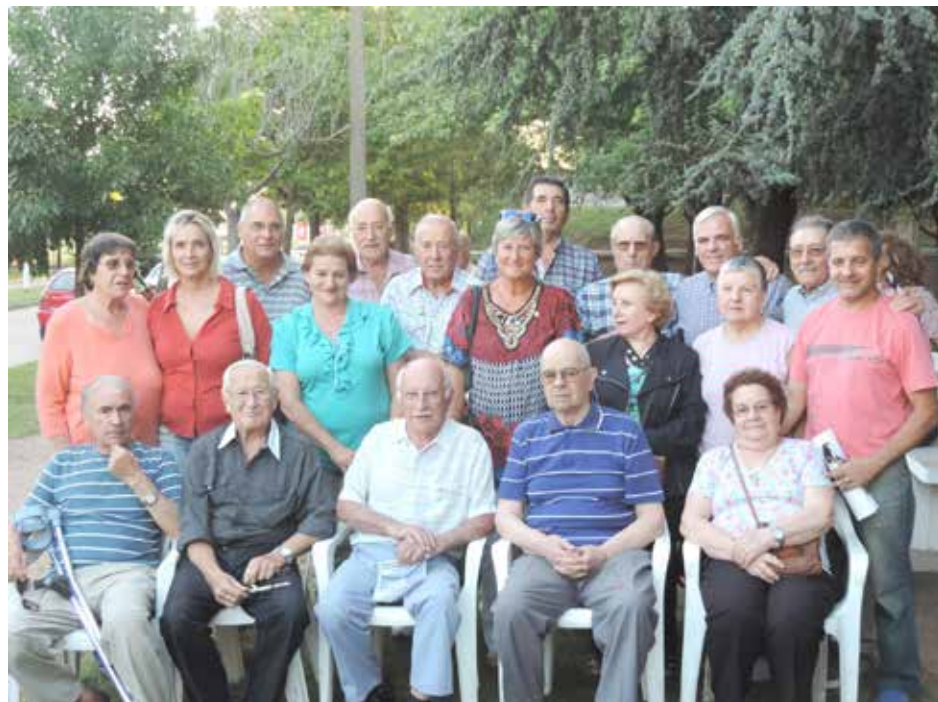
Integrantes de la Asociación de Tejo junto a autoridades municipales y del Club de Leones.

“Agradezco a esta institución, porque ha hecho que este espacio, a lo largo de 15 años, se haya convertido en un ámbito de integración y participación ciudadana, ya que más allá de las actividades puntuales para la tercera edad, se han agregado otras para la integración de los chicos con discapacidad y aquellos que