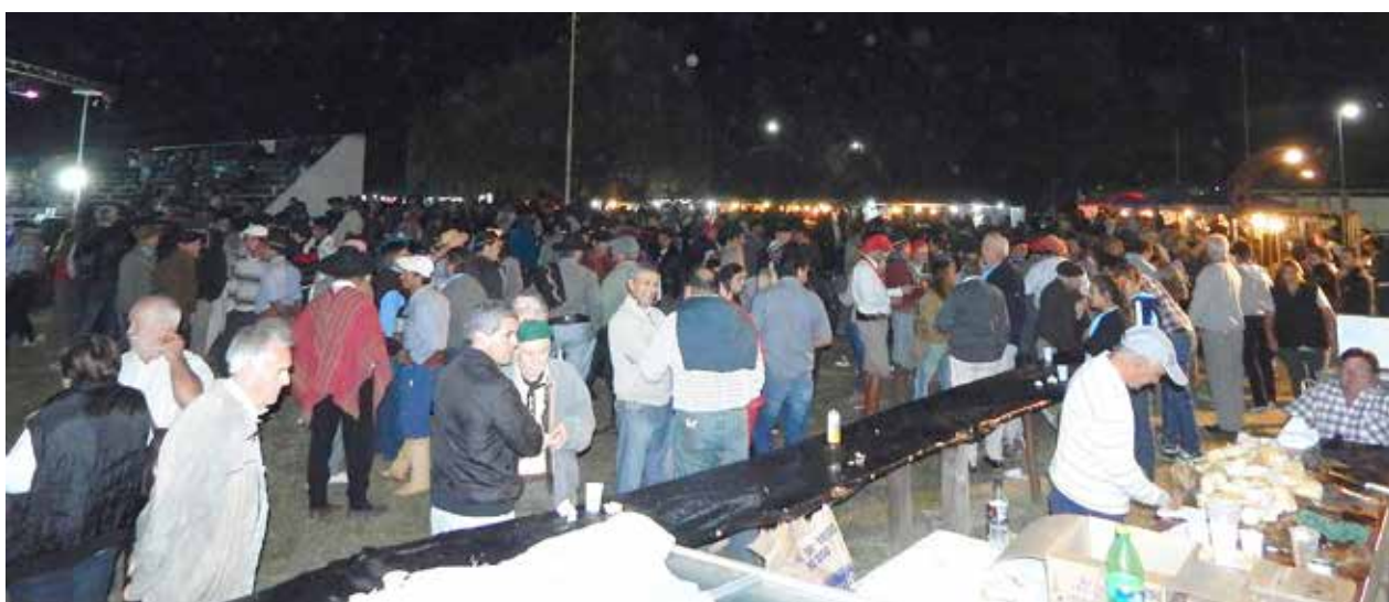
Importante marco de público en la noche del sábado.

Nota: La Asamblea se celebrará a la hora indicada con el 51 % de los socios con derecho a voto, y una hora después se considerará legalmente constituida con la cantidad de socios presentes. Nueve de Julio, 23 de Febrero de 2015.