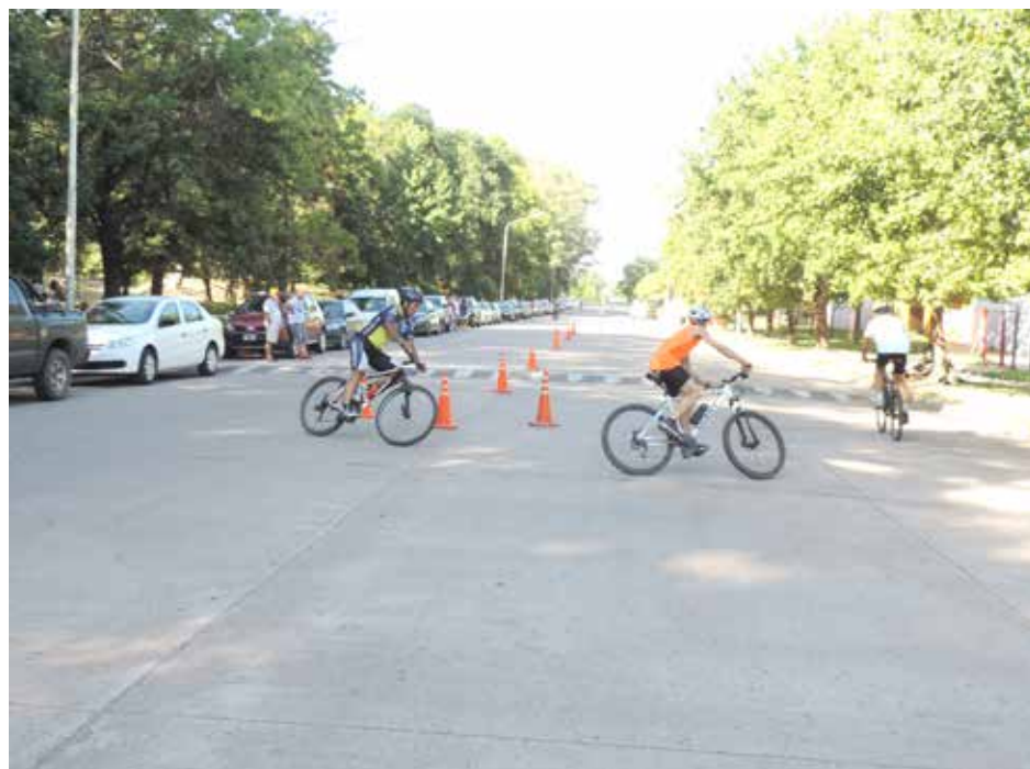
Las tres disciplinas que conforman el triatlón brindaron un espectáculo brillante.