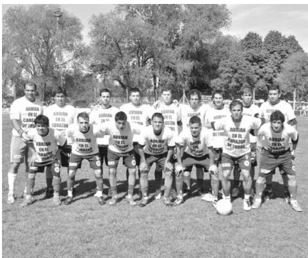
Deportivo San Agustín.

Agustin Alvarez..... Vs..... San Martín Atl. Quiroga..... Vs..... Libertad Atl. 9 de Julio..... Vs..... Atl. French S. D. Dudignac..... Vs..... Once Tigres Dep. San Agustín..... Vs..... Atl. La Niña