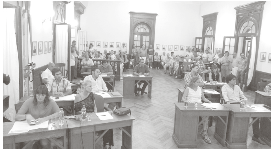
La oposición acompaña el preyecto pero cuestionan algunos puntos importantes.

Sin embargo reconoció que en horario comercial de tarde “a veces también cuesta encontrar espacio para estacionar, pero la diferencia es que un trámite no admite posibilidades, hay que hacerlo y no realizarlo puede traer perjuicio a los vecinos. En cambio, por ejemplo, comprar un pantalón puede ser realizado en cualquier momento e incluso no perjudica dejar el auto más lejos” explicó.