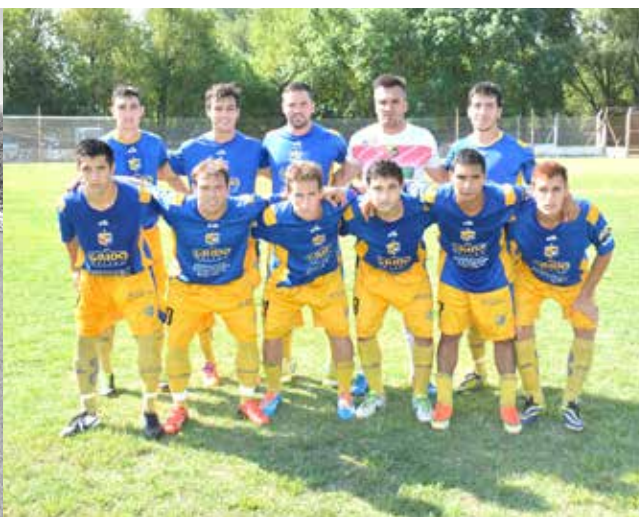
Atlético Once Tigres.