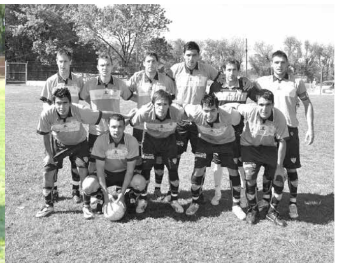
Atlético San Martín.