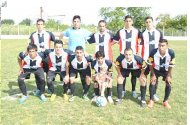
Atlético La Niña.