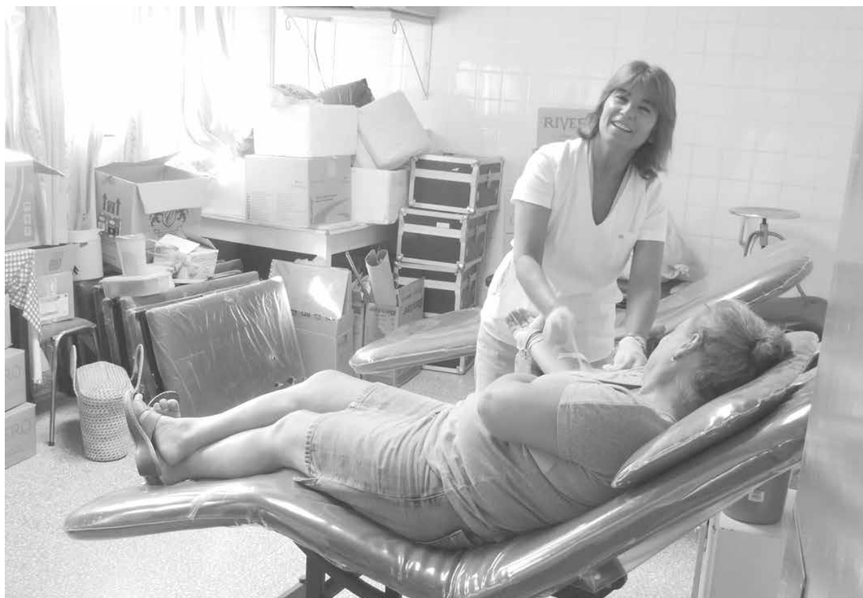
El personal del Hospital llevó adelante una nueva campaña solidaria de donación de sangre.

En la mañana de ayer, miércoles 11 entre las 8 y las 10 hs., una nueva colecta de sangre se realizó en el Servicio de Hemoterapia del Hospital "Julio de Vedia" de nuestra ciudad. Inf. Pag. 5