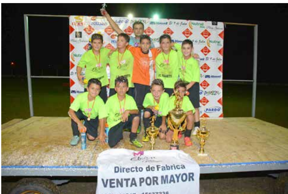
Campeon categoría 2005 Elean Indumentaria.