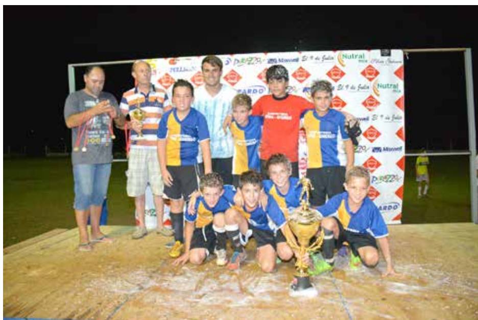
Campeon categoría 2003 Carpintería Spina y Ghergo.