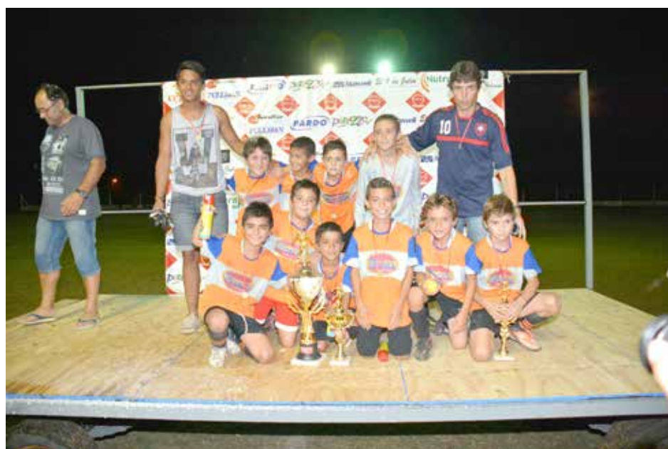
Campeon categoría 2006 Woody Fast Food.