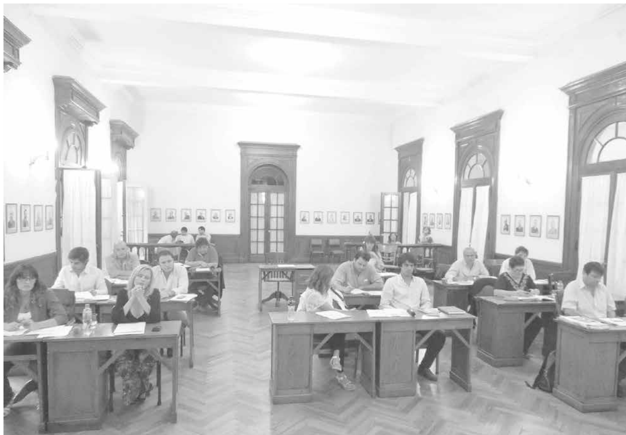
Esta noche en el HCD, concejales, funcionarios y vecinos dejarán sus posturas por el futuro estacionamiento medido.