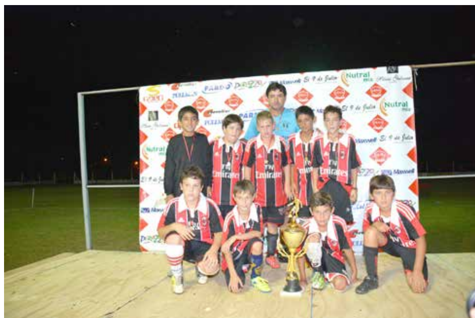
Campeon categoría 2004 Farmacia Aramburu.