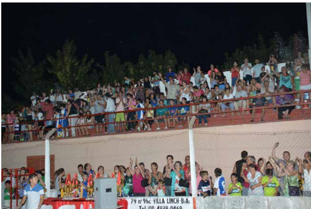
El público acompañó con entusiasmo el desarrollo de las finales y la entrega de premios.