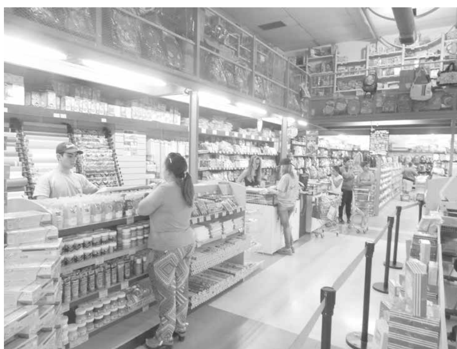
Todo listo para la venta de artículos educativos y anexos.