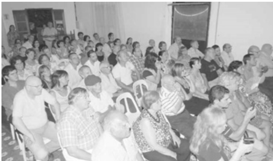
El público acompañó y se deleitó con un excelente show.