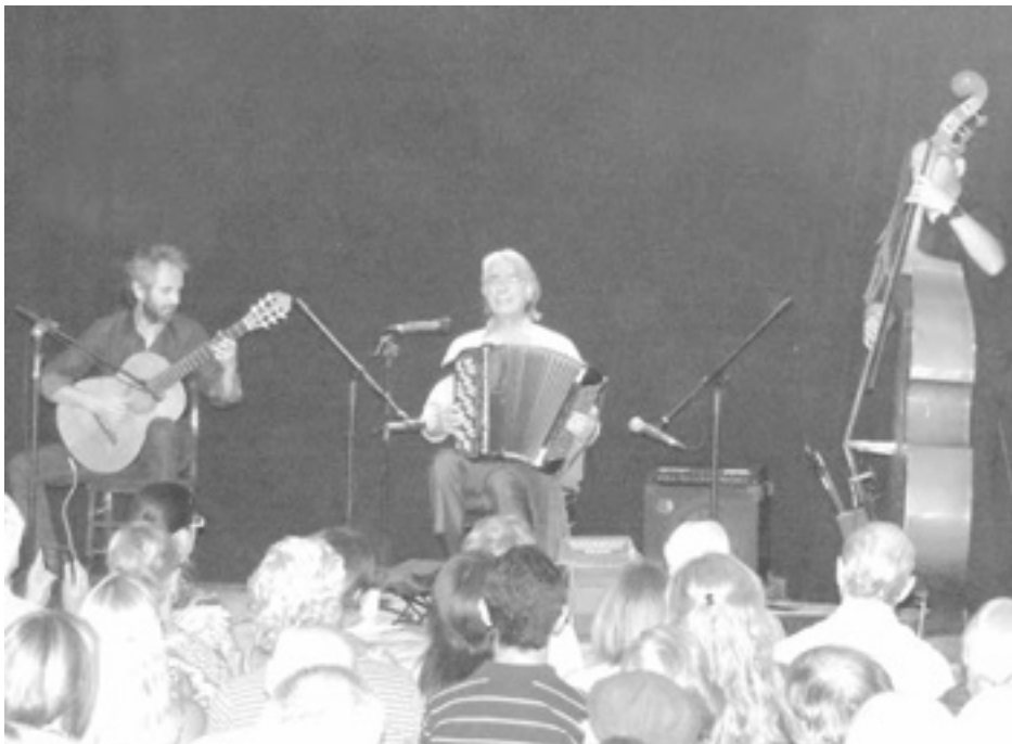
"El Maestro" y sus músicos en plena actuación.

"La Esquina", Arte y Cultura de Tucumán y Santiago del Estero, llevó adelante el pasado sábado una nueva presentación en nuestra ciudad del reconocido folklorista Raúl Barboza, quien desde hace años se encuentra radicado en Francia. Barboza, artista de chamamé de muy destacada trayectoria, recibió recientemente un premio muy importante, y como lo hace habitualmente en cada verano, visitó nuestro país y