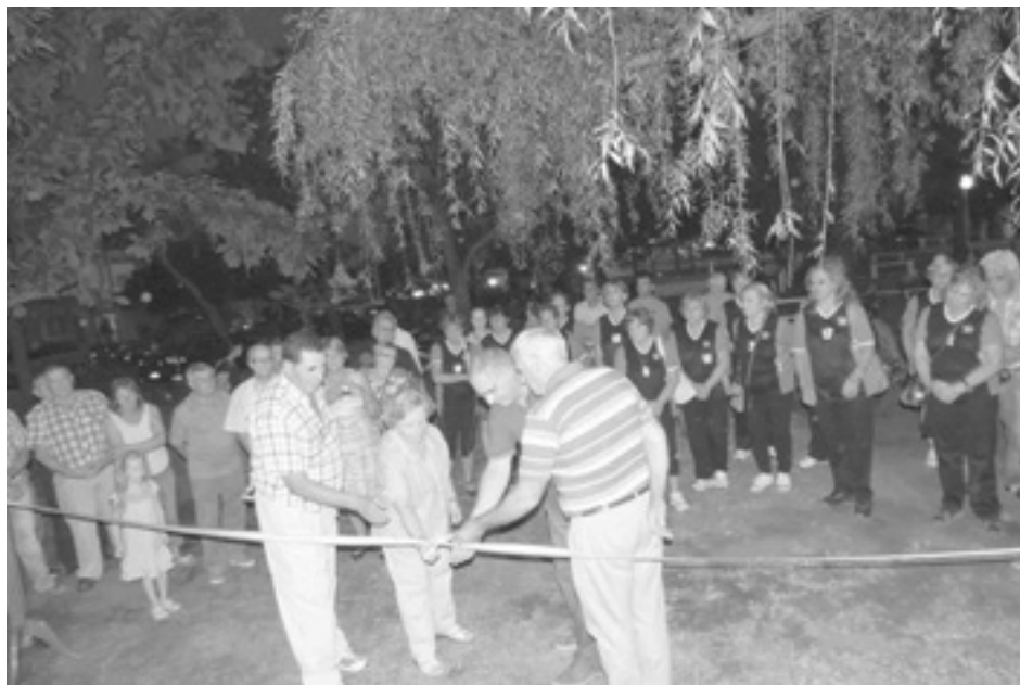
Autoridades municipales, del Club de Leones y de la Asociación de Tejo realizaron el corte de cintas.

En la tarde del pasado sábado, en el Playón Municipal "Eva Perón", ubicado en la intersección de Avdas. San Martín y Agustín Álvarez, fue inaugurado un sector de gimnasia, conformado por aparatos que fueron donados por el Club de Leones de 9 de Julio, dispuestos en un lugar prolijamente diseñado y dotado de iluminación