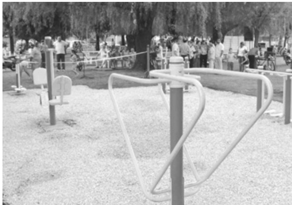
Vista de la nueva aparatología donada.

Asimismo, agradeció la disposición de los abuelos que llevan adelante la acción de la