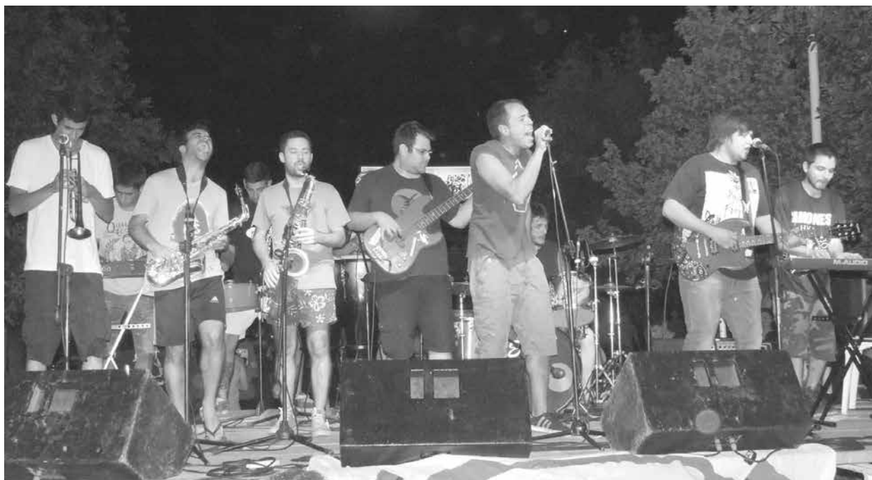
El cierre de la noche estuvo a cargo de La Big Band Ska.