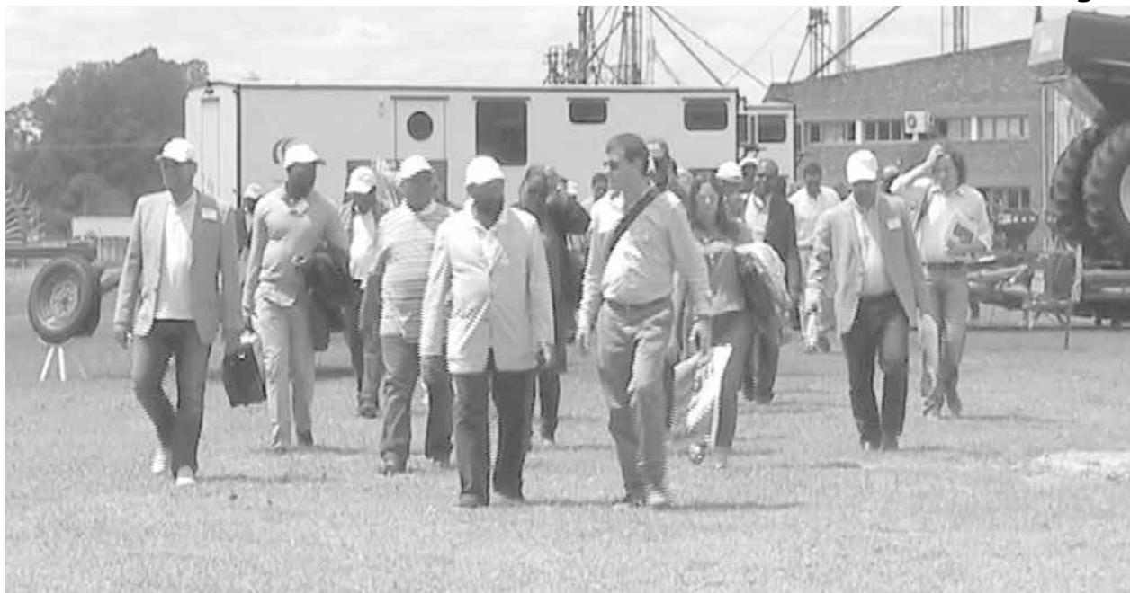
Los angoleños recorrieron el predio de la firma local.