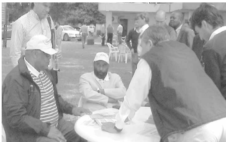
Importante intercambio industrial realizó la firma Yomel.

un Embajador, un Gobernador y un Ministro, por lo que "se organizó un show room para que puedan observar