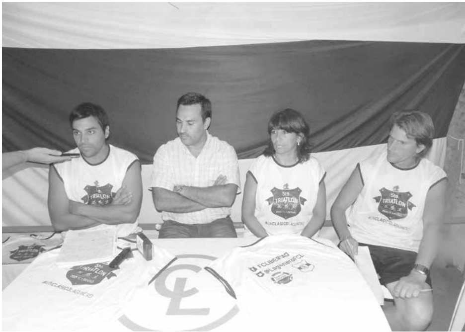
Integrantes del Club Libertad en diálogo con los medios. ción, vóley y Futbol Infanto 22.45 hs Cierre de la fiesta Cumbia. Juvenil). del agua con Migrantes