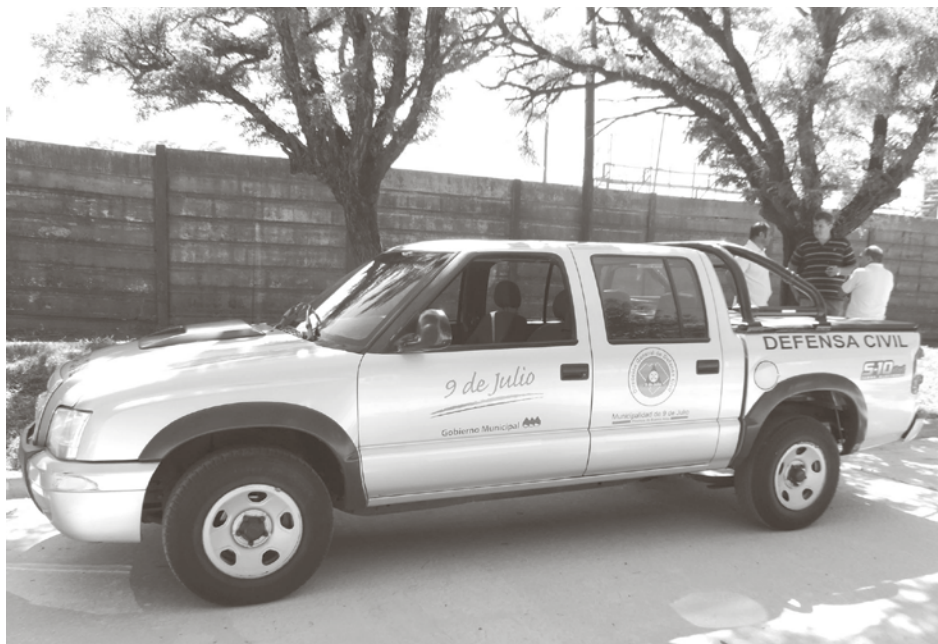
La unidad Chevrolet S10 incorporada por el municipio.