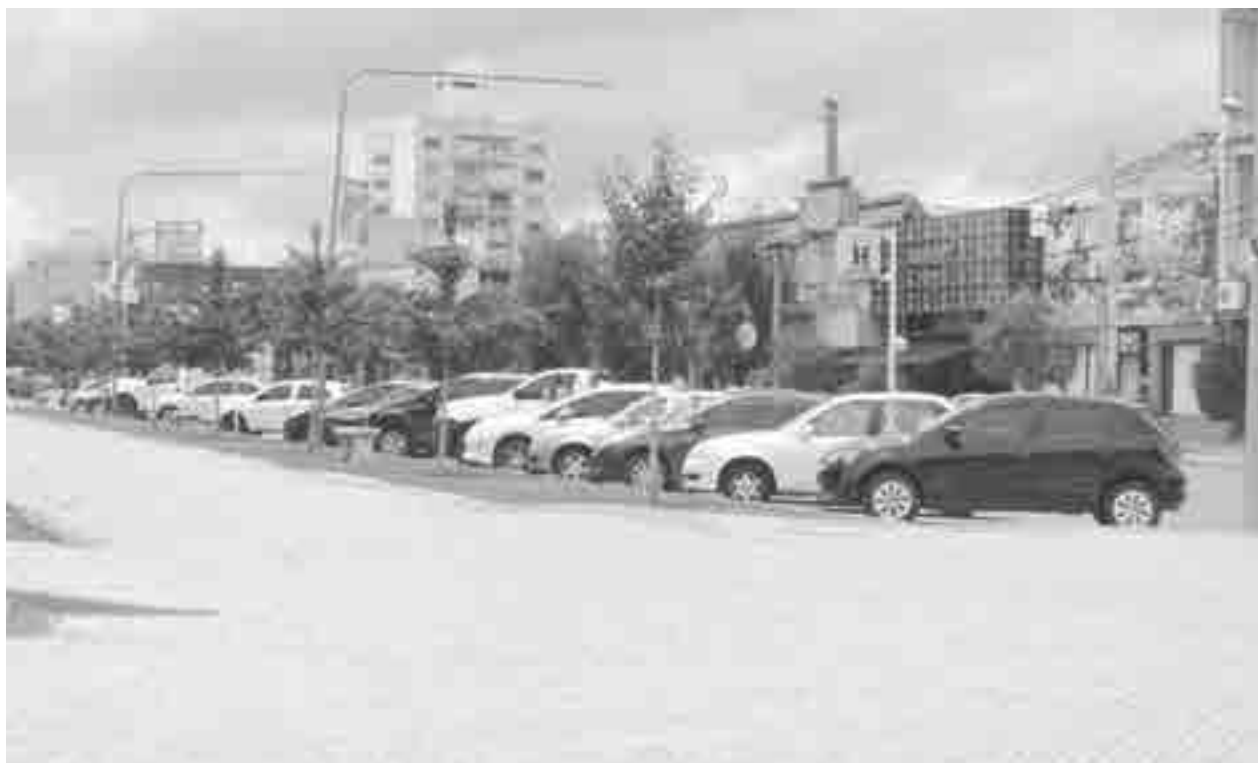
La implementación del estacionamiento medido será necesario para el ordenamiento del tránsito.