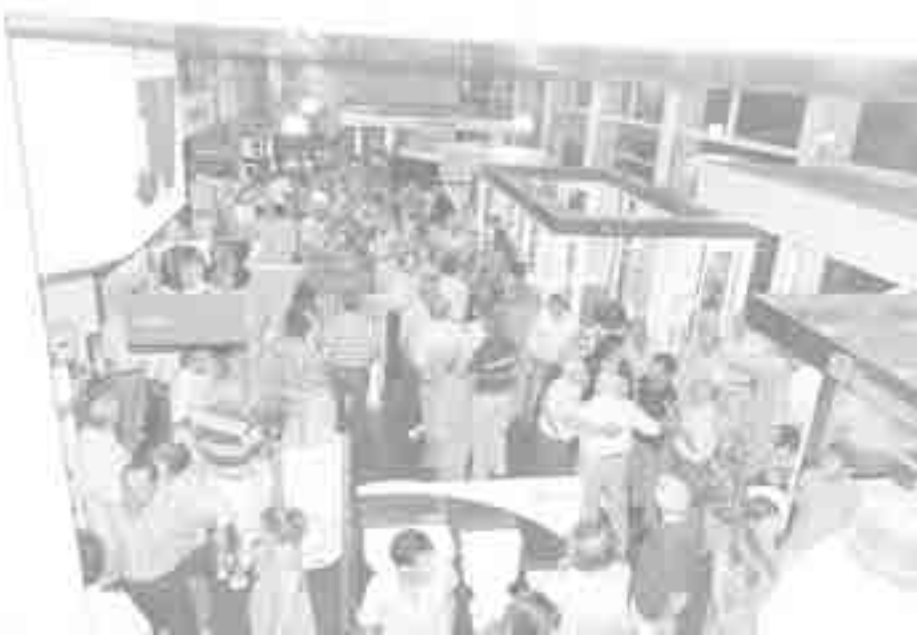
Familiares, clientes y amigos presentes en la inauguración.