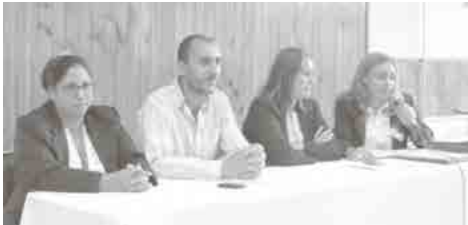
Autoridades de ANSÉS presidieron el acto de entrega.

En la jornada ayer, en el salón del Centro de Jubilados y Pensionados de 9 de Julio, la delegación local de ANSES procedió a efectuar la entrega de 94 nuevas