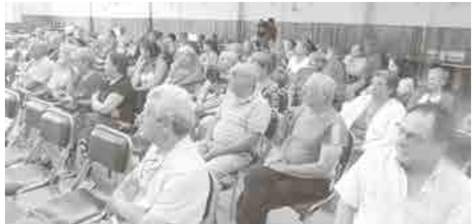
Beneficiarios presentes en la jornada de ayer.

Previsional, que se pusiera en marcha meses atrás al ser aprobada por el Congreso Nacional un Proyecto de Ley impulsado por la Presidenta de la Nación, Cristina