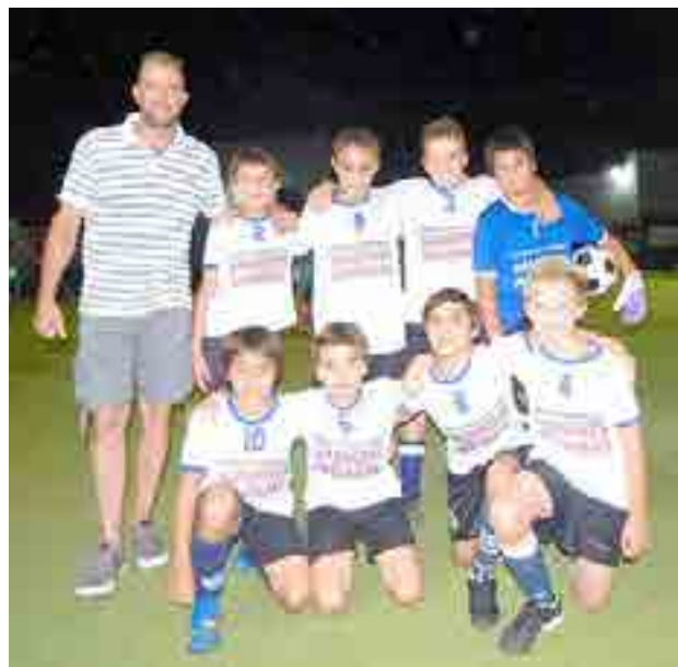
Equipo de Mundo Animal, animador del torneo.

Serán este jueves y viernes en su cancha de césped sintético. La final será el martes 20